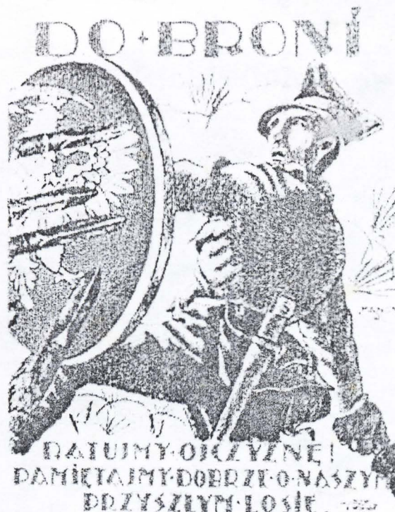
Poster de Propaganda Polaca "¡A las armas! ¡Defendamos a la Patria! Recordemos bien nuestro futuro sino."