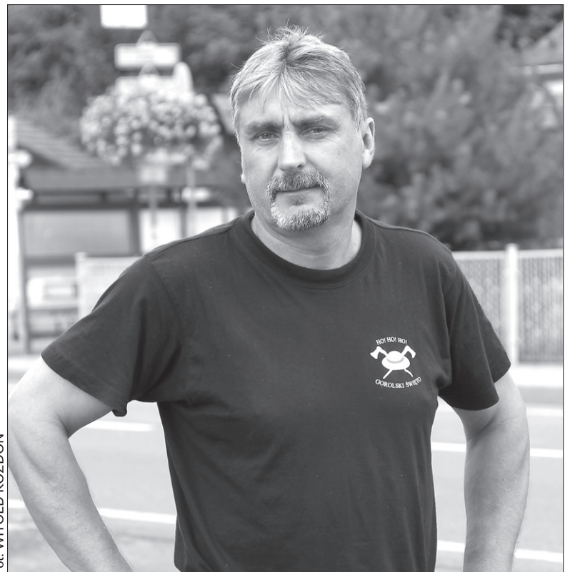
Fot. WITOLD KOZDŃ