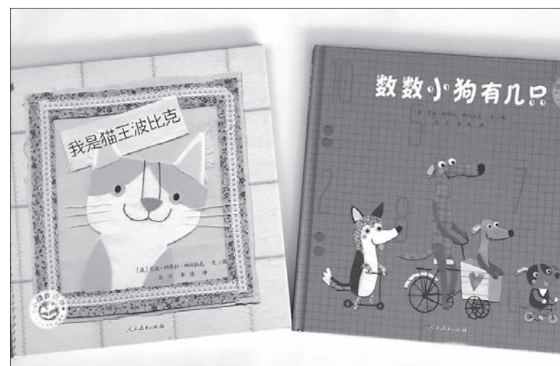
„Nasza Księgarnia” zagościła w Pekinie.