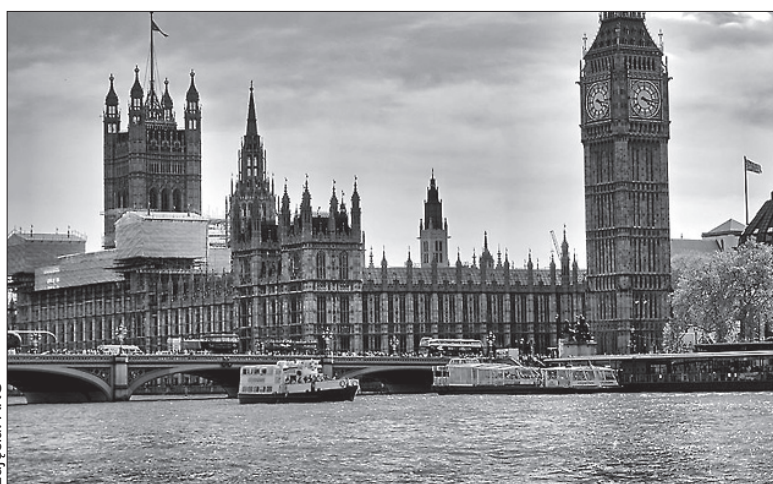
Polacy stanowią na Wyspach Brytyjskich zdecydowanie największą grupę narodową bez brytyjskiego paszportu.

Według wyliczeń ONS, matki 26 proc. dzieci rodzających się na Wyspach nie są obywatelkami Wielkiej Brytanii. Polki rodzą rocznie w Wielkiej Brytanii 23 tys. dzieci – najwięcej ze wszystkich imigrantek (3,3 proc. wszystkich urodzeń). ONS