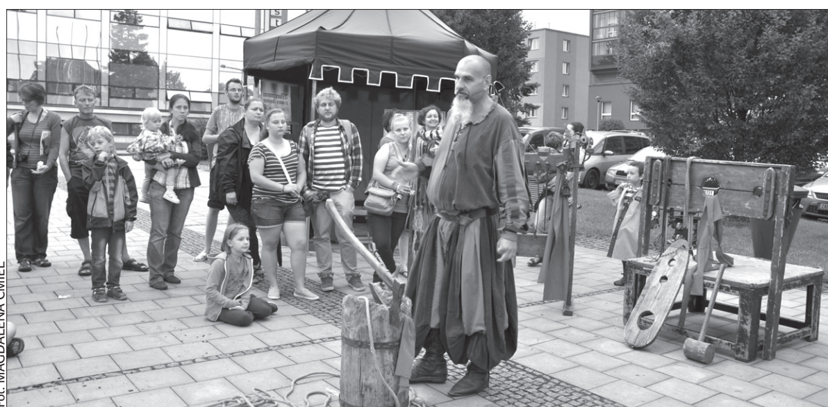
Na jednej z imprez można było spotkać średniowiecznego kata.

Trzecia edycja Trzynieckiego Lato Kulturalnego już za nami. W jej ramach odbyło się 25 imprez. Celem było umilenie letniego popołudnia na Placu Wolności oraz na Rynku Masaryka. Bogaty program przygotowany był w każdy wtorek i czwartek. Usłyszeć można było różne style muzyczne, od muzyki ludowej, folkowej, dętej, aż po muzykę popową czy rockową. W skład programu weszły m.in. pokazy sokolnictwa, indiańskie zabawy dla dzieci, Przegląd Mniejszości Narodowych, Gastroshow, miniolimpiada w nietradycyjnych dyscyplinach sportowych, obchody urodzin miasta z przebojami z 1985 roku czy tradycyjne kino letnie. – Wszystkie imprezy na Pla-