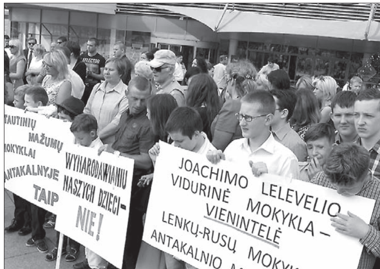
Rodzice walczą o przyszłość swoich dzieci.

Rodzice, którzy uczestniczyli w piątkowym spotkaniu, są kategoryczni: twierdzą, że, zanim remonty się nie skończą, w budynku przy ul. Minties dzieci pobierać nauki nie mogą – ze względów bezpieczeń-