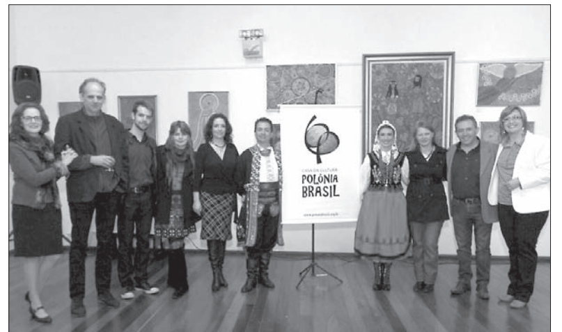
Polacy są aktywni również w Brazylii.