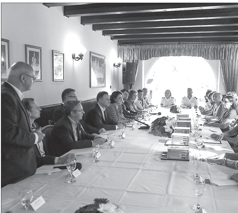
Tym razem prezydent RP, Andrzej Duda, spotkał się z Polonią chorwacką.

Prezydent Andrzej Duda dziękował Polonii chorwackiej za jej pracę. – Jesteście tu ambasadorami Polski – mówił podczas spotkania w Konavle koło Dubrownika.