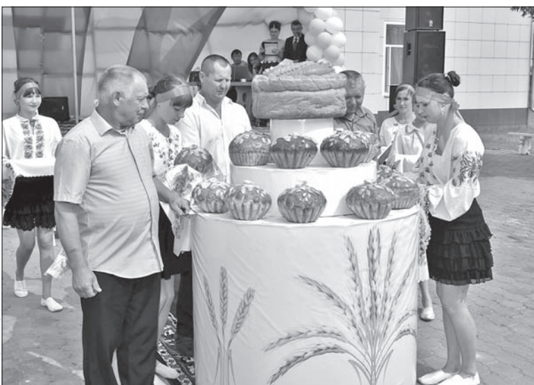
Większość mieszkańców Jasnej Polany stanowią Polacy.