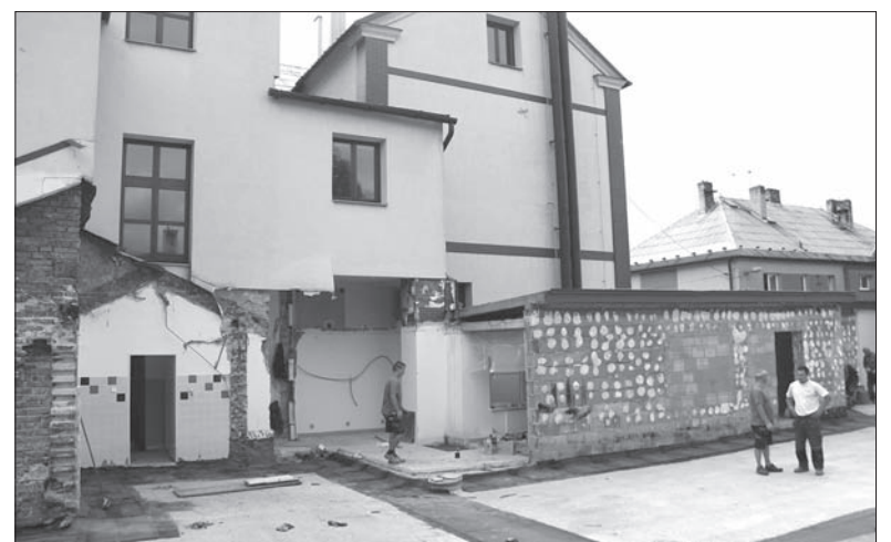
Remont wędrzyńskiej polskiej podstawówki idzie pełną parą. Tam, gdzie teraz można spotkać robotników, już niedługo stanie nowa szatnia dla dzieci, a stara zostanie zagospodarowana na klasę. Firma budowlana ma zdążyć z remontem, który obejmuje również toalety i lokal dyrekcji, przed rozpoczęciem roku szkolnego. Ten w wędrzyńskiej polskiej szkole zaplanowano na poniedziałek 5 września. (sch)