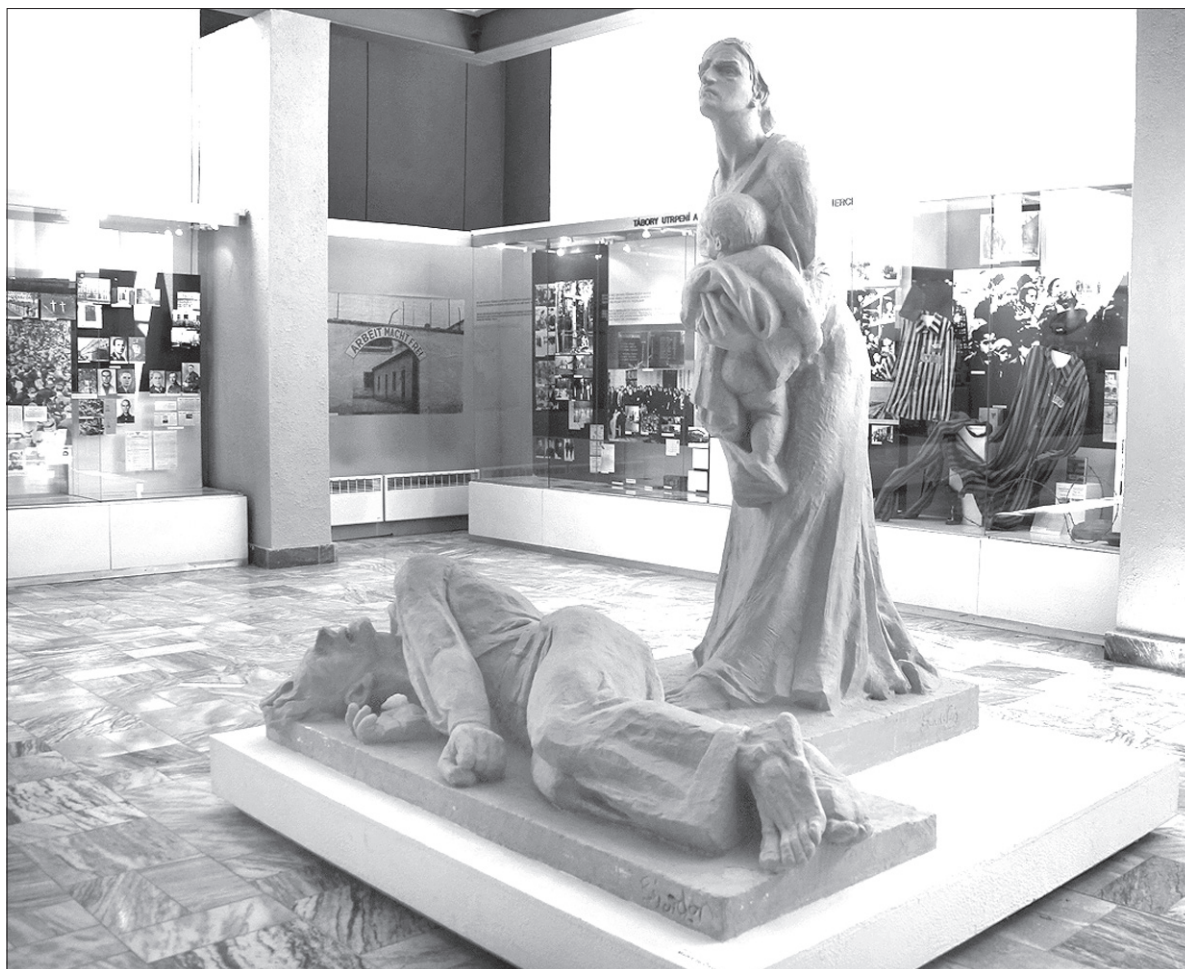
Stała ekspozycja w żywocickim muzeum pochodzi z 1994 roku.

Dzisiejsze Javoříčko ma zdecydowanie mniej mieszkańców niż to przedwojenne. Osadę tworzy 14 budynków. W większości są to domy bliźniacze wybudowane po wojnie dla wdów po zamordowanych i ich dzieci. Pierwotnie liczono, że cała wioska zostanie odnowiona, lecz część kobiet nie chciała wrócić, osiedliły się w innych miejscowościach. Wioska wchodzi w skład gminy Luká. – Nasza wioska ma dziś niespełna 40 mieszkańców. Tutejsi ludzie pamiętają z dzieciństwa wydarzenia wojenne i do dziś o nich opowiadają. Ja również znam tę historię z opowiadań