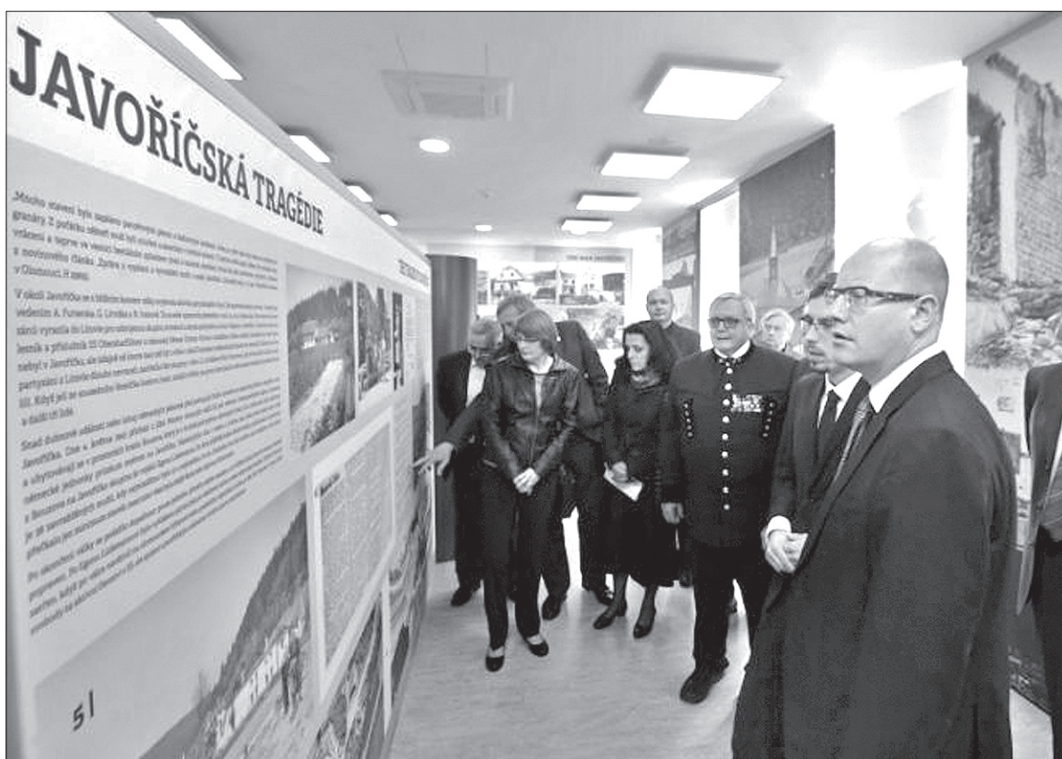
Budynek dawnej szkoły w Javoříčku został przekształcony w nowoczesne muzeum.

obok budynku, a także koło pomnika pomordowanych wzniesiono w 1955 roku, przechodzą tłumy turystów zmierzających do popularnych javoříčských jaskiń krasowych, które już przed wojną były magnesem przyciągającym turystów. Na początek urządzili bistro dla turystów, by zarobić przysłowiowych parę groszy na swą działalność. W ub. roku została uroczystie otwarta ekspozycja muzealna. – Na parterze mamy salę kinową, w której wyświetlamy dokument o tragedii, na piętrze stałą ekspozycję, której częścią są także dwa modele wioski: dawnej i obecnej – opowiada działacz. Podkreśla, że na otwarcie muzeum połączone z obchodami 70-lecia tragedii, przyjechał nawet premier Bohuslav So-