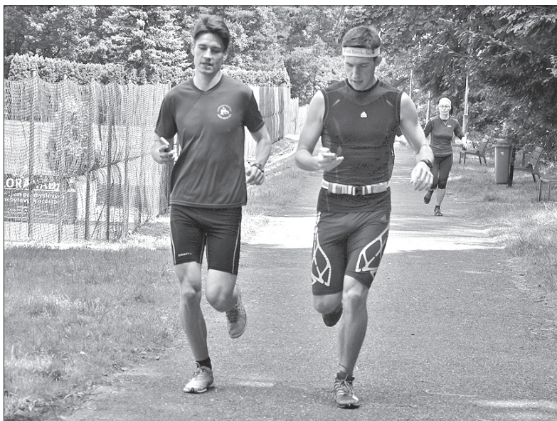
Aplikację wykorzystują nie tylko maratończycy, ale wszyscy biegacze rekreacyjni.