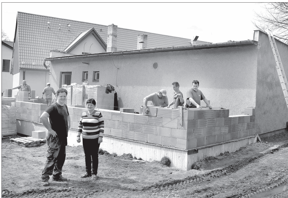
Trzanowice mogą się pochwalić rozbudową Domu PZKO.

Do nowej, przybudowanej części, będzie można wejść zarówno z zewnątrz, jak i z samej sali i kuchni Domu PZKO. W sąsiedztwie kuchni powstanie mały magazyn, obok znajdzie się szatnia, do której będzie można wejść z sali. W pozostałej części powstanie zaplecze techniczne. – Projekt przebudowy był pierwotnie bardziej wyrafinowany. Powierzchnia Domu PZKO miała być większa, w dodatku dach miał zostać podwyższony, by mogły powstać tam pokoje. Realizując prze-