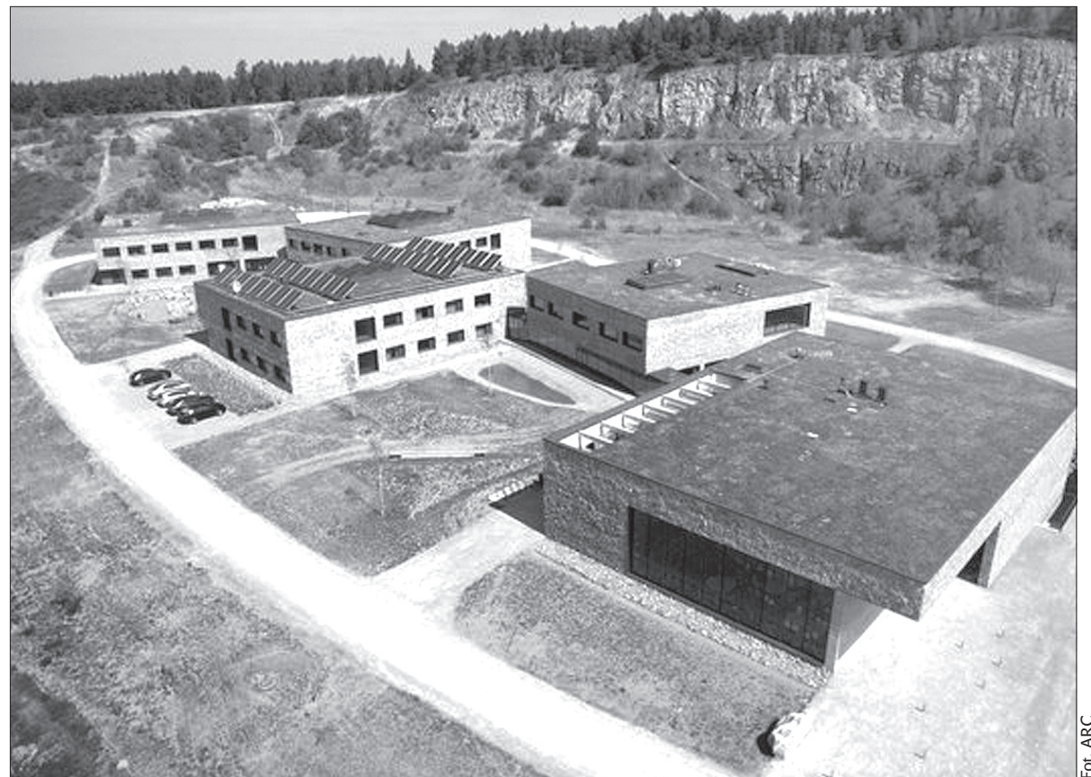
Europejskie Centrum Edukacji Geologicznej w Górach Świętokrzyskich.

Władze Wydziału Geologii UW chcą stworzyć z ECEG letnią szkołę geologii dla geologów z całej Europy. Od nowego roku akademickiego ruszy nabór na nowy kierunek studiów