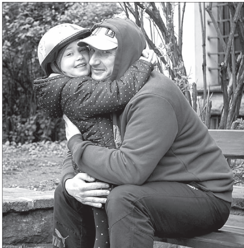
Wiele polskich rodzin cieszy się z rządowego programu 500+.

Jak nietrudno zgadnąć, od samego początku program cieszy się olbrzymim zainteresowaniem. W ciągu dwóch pierwszych tygodni kwietnia wnioski złożyło 1,4 mln osób. To ponad połowa z uprawnionych do otrzymania świadczenia 2,7 mln rodziców. W Cieszynie tylko w ciągu pierwszego tygodnia miejscy urzędnicy przyjęli 829 wniosków. Z kolei w Skoczowie do dziś magistrat od-