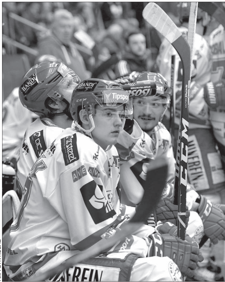
Trzyńczanie dziś zagrają na wyjeździe z Mładą Bolesławią. Czy wrócą z tarczą?