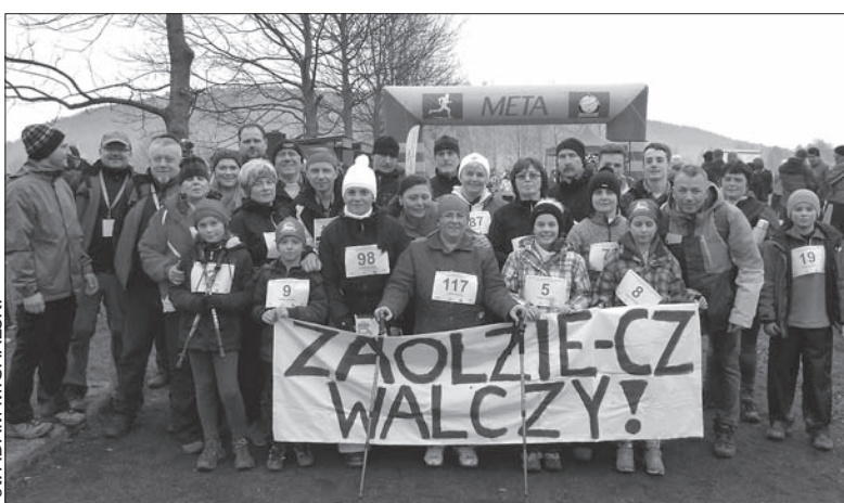
Reprezentacja Polaków w RC od wczoraj walczy na arenach sportowych Sanoka, Ustrzyk Dolnych i Przemyśla w XII Światowych Zimowych Igrzyskach Polonijnych „Podkarpackie 2016”. Pierwsze medale igrzysk rozdano wczoraj, po zamknięciu numeru. Bliżej z igrzyskami można być na naszej stronie internetowej glosludu.cz. Na zdjęciu część zaolziańskiej ekipy, a dokładnie zawodnicy startujący w wczorajszej konkurencji nordic walking. (jb)