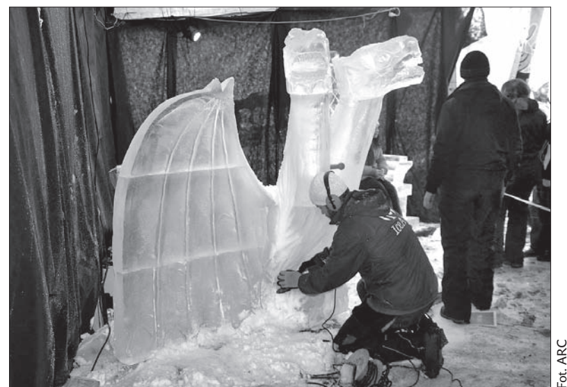
Takie lodowe cuda można przez cały styczeń podziwiać na Pustewnach.