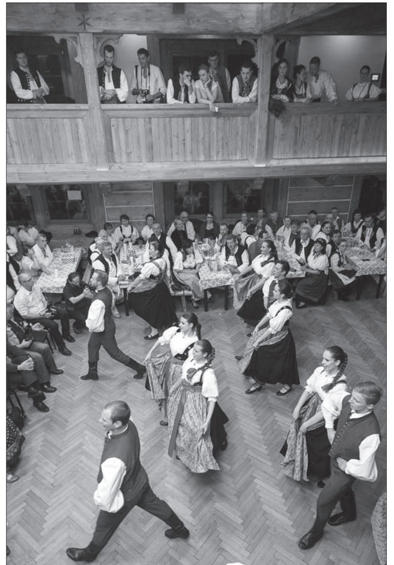
Zespół „Olza” pokazał, co potrafi.