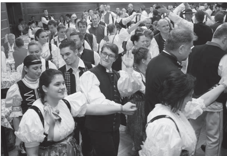
Tradycyjnie bal rozpoczął się chodzonem.