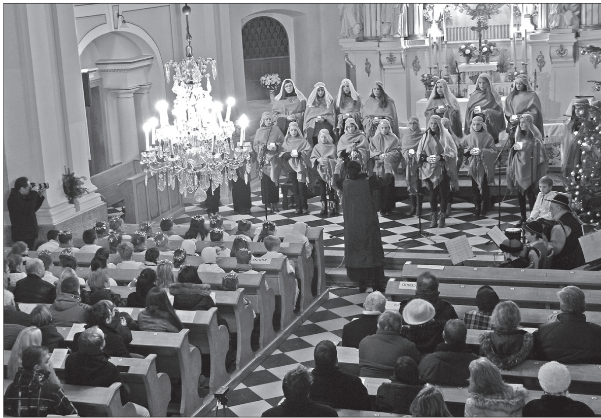
Chór szkolny „Crescendo” z PSP w Bystrzycy w czasie piątkowego koncertu w miejscowym kościele ewangelickim.

– Koleda, koleda, na skrzypczkach granie, niech leci do nieba to nasze śpiewanie... – intonowały szkolne „Wiolinki”. Młodszy chór, do