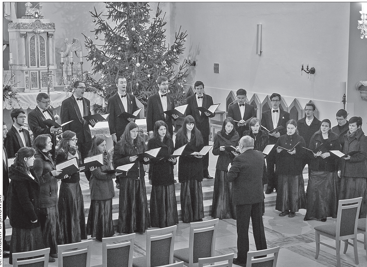
Występ „Canticum Novum” zrobił na wszystkich duże wrażenie.