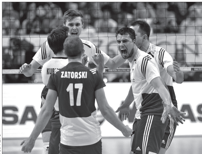
Polscy siatkarze w zawałowym meczu pokonali Niemców, zachowując szansę na awans do igrzysk olimpijskich w Rio de Janeiro.

Turniej w Tokio zaplanowany jest na przełom maja i czerwca. O przepustkę do igrzysk olimpijskich powalczą ekipy Japonii, Chin, Iranu, Australii, Wenezueli, Polski, Francji oraz Kanady. Zespoły zagrają systemem każdy z każdym. Awans wywalczą cztery drużyny, a jedno miejsce jest zarezerwowane dla drużyny z Azji, bo turniej w Japonii jest równocześnie kwalifikacją tego kontynentu. Bilety do Rio mają już w kieszeni Brazylijczycy, USA, Włochy, Argentyna, Rosja oraz Kuba. (jb)