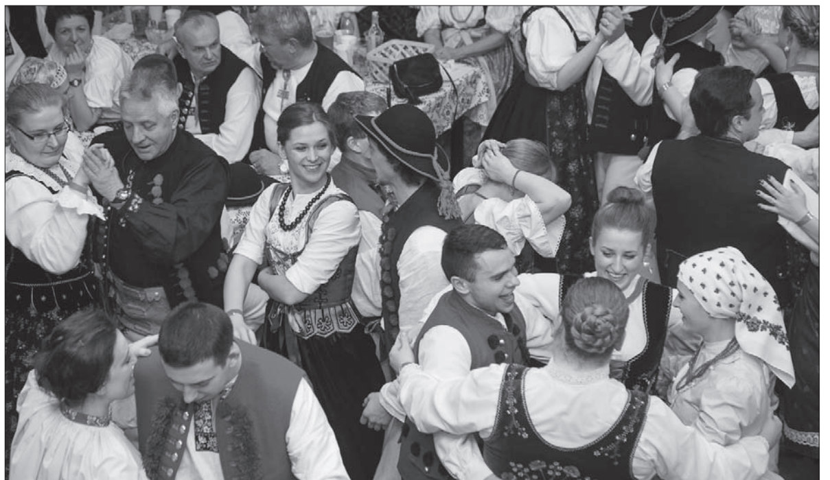
Na parkiecie było tłoczno i gorąco.