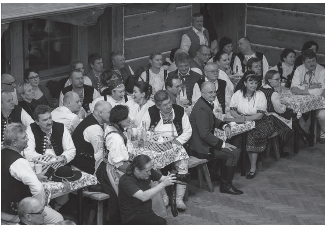
Znane twarze wśród gości.