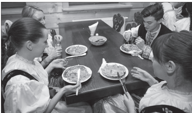
Jadła i napitku na balu nie brakowało. Jak się nieoficjalnie dowiedzieliśmy – wszystkim smakowało.