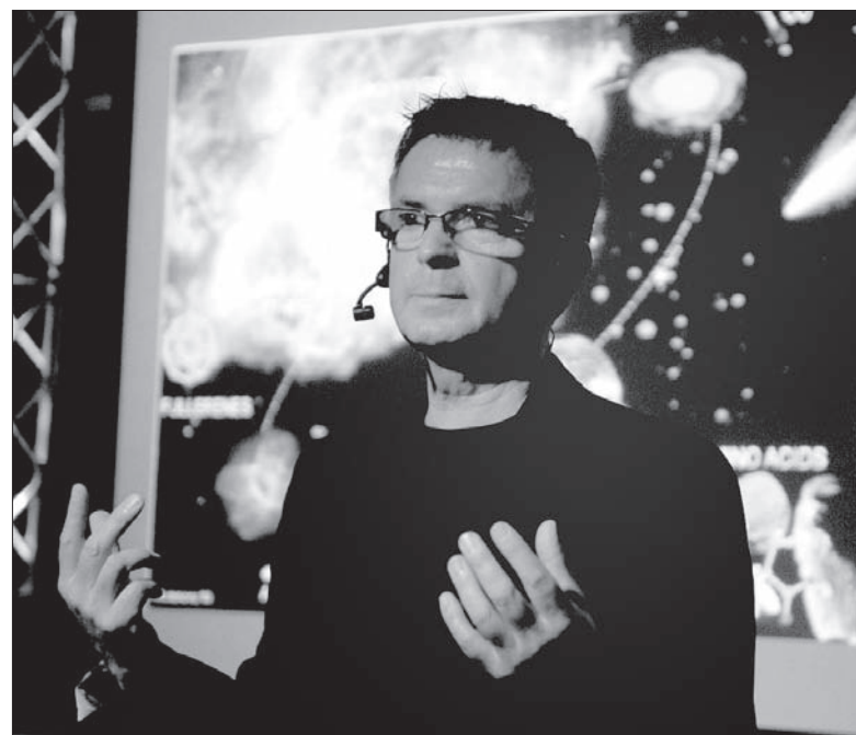
Prof. Aleksander Wolszczan podczas wykładu w Fabryce Trzcinicy w Warszawie.