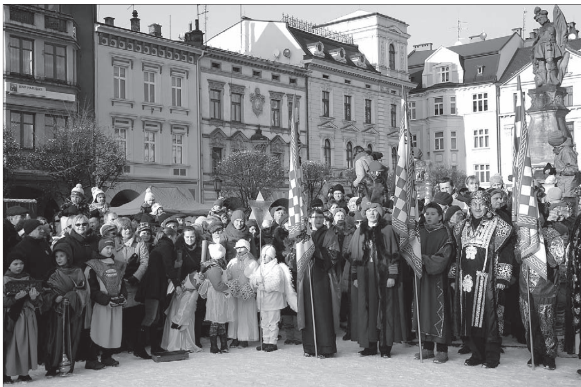
Cieszyński Orszak Trzech Króli przyciągnął na rynek tłumy.

Cieszyński Orszak Trzech Króli był okazją do wspólnego celebrowania wtorkowego święta, które jest w Polsce również dniem wolnym od pracy. Uczestnicy obejrzeli jaseł-