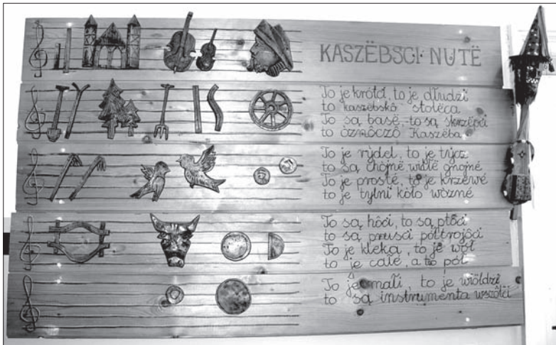
Tekst Kaszubskich Nut, czyli miejscowego abecadła.