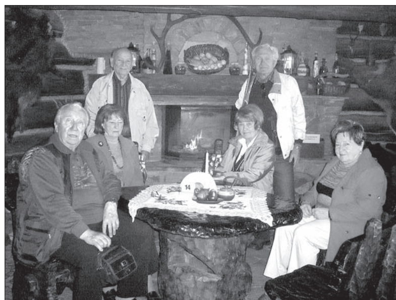
Tym razem spotkanie miało miejsce w Beskidzie Śląskim.

Pitała zaproponował, żebyśmy jedno spotkanie urządzili na przykład