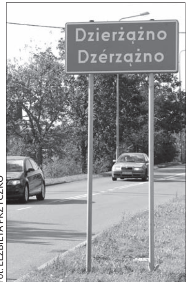
O tym, że jesteśmy na Kaszubach można się zorientować dzięki dwujęzycznym tablicom drogowym.

Podczas wizyty w Muzeum Kaszubskim uczniowie ze Śląska Cieszyńskiego mieli też okazję zażyć... tabaki. Śmiechu było przy tym co niemiara, ale młodzież dowiedziała się również, że zażywanie tabaki to jeden z najślawniejszych kaszubskich zwyczajów. Według współczesnych szacunków używkę tę stosuje nadal ponad 100 tysięcy mieszkańców regionu. Kaszubi sypią szczyptę na rękę (między kciuk i wskazujący palec) i mocno pociągają nosem. Zażywanie tabaki jest elementem regionalnej kultury, gestem towarzyskim i przede wszystkim wielowiekową tradycją. W wie-