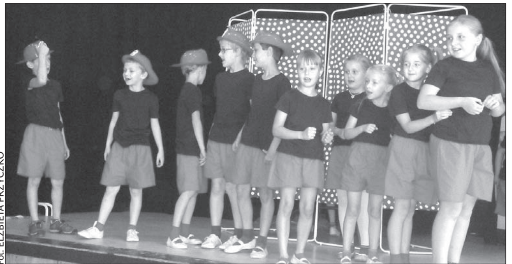
Młodsza grupa nieborowskich aktorów w akcji, czyli „Gapcio” z przedstawieniem „Pali się”.

mierze gimnazjaliści. Tymczasem do teatryku zaczęło przychodzić dużo młodszych dzieci, nawet przedszkolaków, więc przedział wiekowy był już za duży – wyjaśniła okoliczności powstania „Gapcia”. W tej chwili najmłodszy aktor ma niespełna pięć lat. Ciekawostką jest fakt, że w „Gapciu” grają dziś dzieci tych, którzy przed dwudziestu laty występowali w pierwszej „Gapie”. (ep)