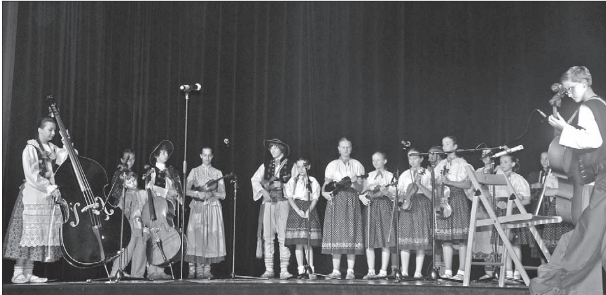
Zespoły „Beskidek” i „Rozmarynek” połączyły siły i stworzyły niecodzienne widowisko.