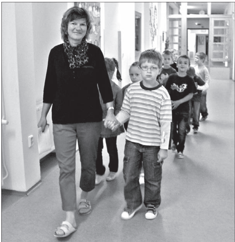
Nowi uczniowie zwiedzają szkołę.

Nauki w pierwszej klasie na pewno będzie dużo. Trzeba przecież opanować cały alfabet, nauczyć się nie tylko czytać i pisać, ale także liczyć. Jak jednak zapewniła nas pani nauczycielka, pierwsza klasa to nie tylko nauka i obowiązki. Na dzieci czekają przecież także wycieczki, zabawy i imprezy, a w listopadzie wszyscy uczniowie pierwszego stopnia wyjadą na zieloną szkołę. (ep)