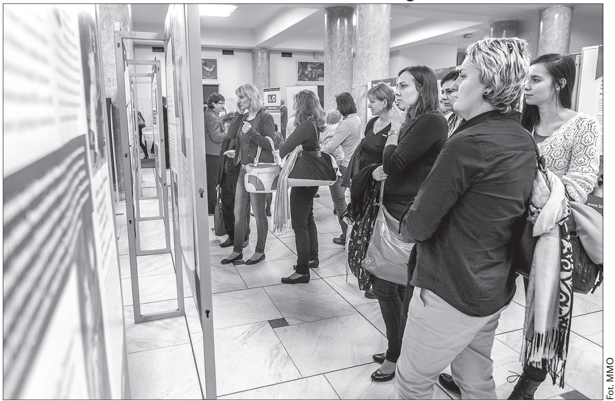
Wystawa w foyer Domu Kultury Miasta Ostrawy.

Biały Krąg Bezpieczeństwa ma sieć poradni w dziewięciu miastach Republiki Czeskiej. Ofiarom, ich krewnym, a także świadkom przestępstw pomagają bezpłatnie prawnicy, psycholodzy i pracownicy opieki społecznej. Nasz region obsługuje