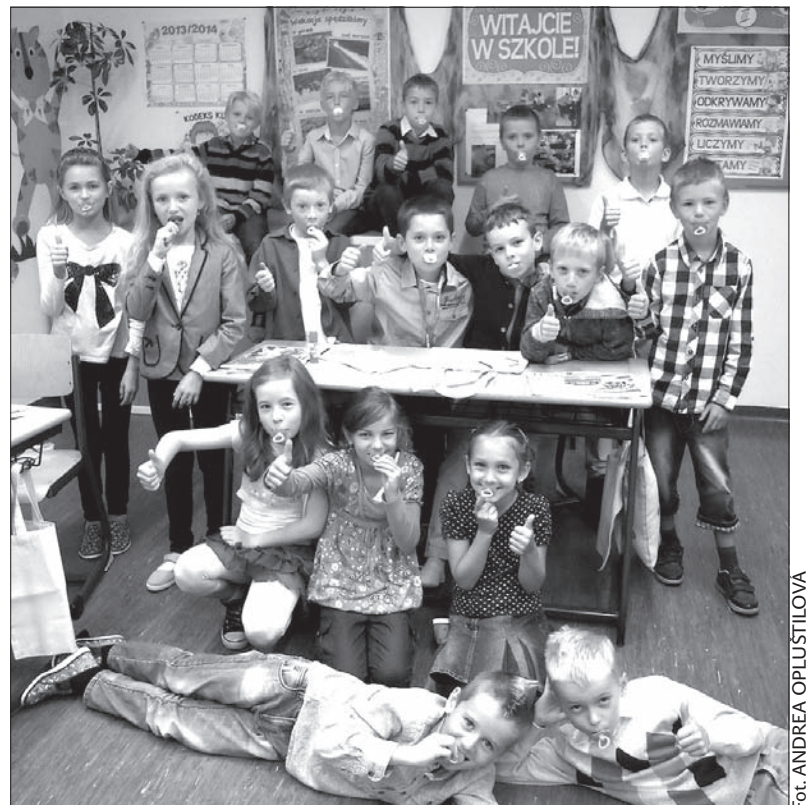
18 urwisów z klasy trzeciej.

sza Pani na powitanie rozdała nam smoczki, czyli słodkie lizaki, żeby nie było nam żal minionych wakacji. Ale co tam... za 10 miesięcy znowu będzie wielka lab!