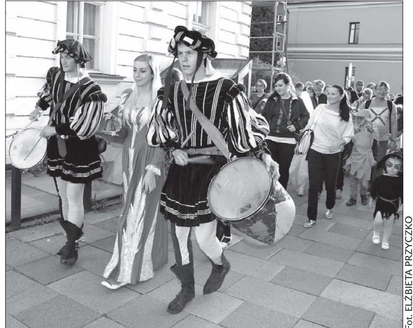
Barwny korowód straszydeł wyruszył jak zwykle spod ośrodka kultury „Strzelnica”.

cy imprezy popisali się bowiem nie lada wyobraźnią. Barwny korowód wyruszył na drugą stronę rzeki.