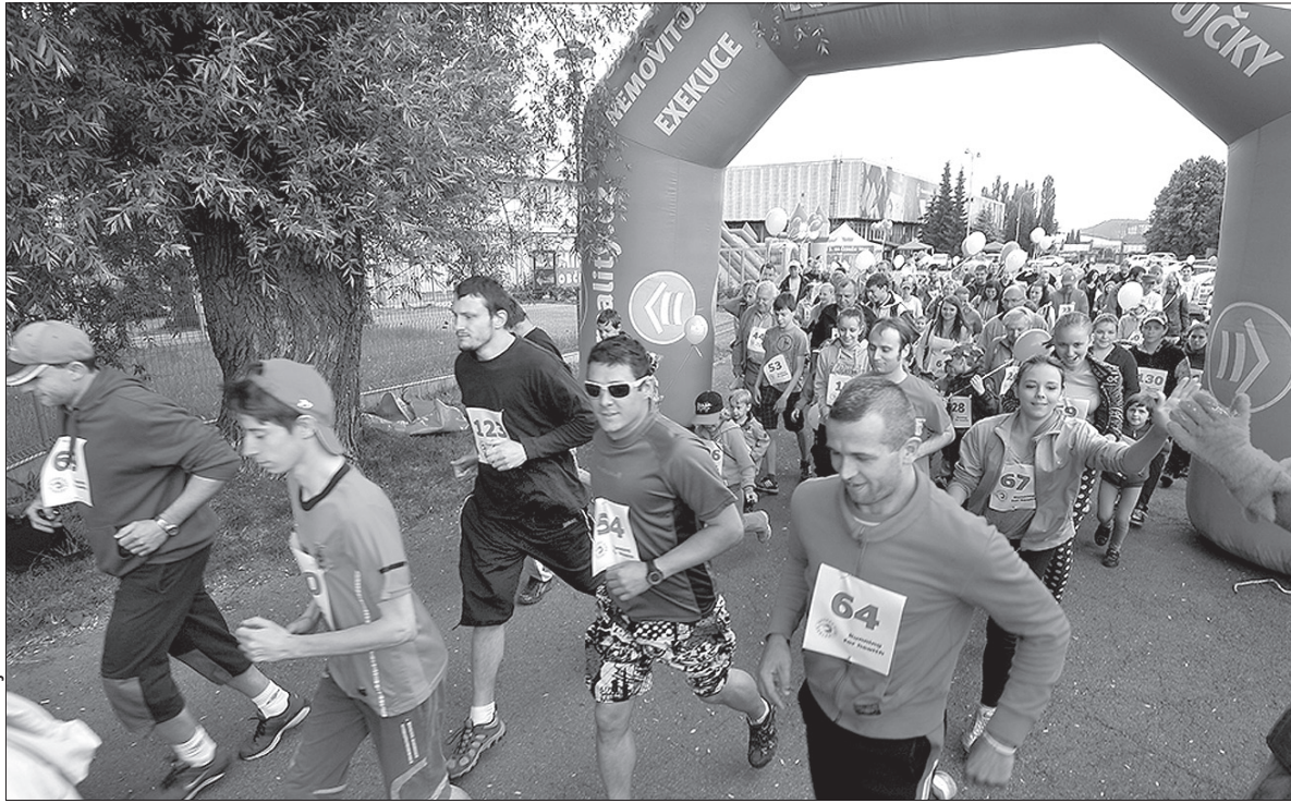
Na trasie tegorocznego biegu w Trzyniecu.

Organizatorzy zadbał o najmniejsze szczegóły. Nie zabrakło szereg imprez towarzyszących, w