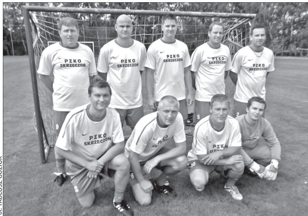
Zwycięska drużyna MK PZKO Bogumin-Skrzeczoni.