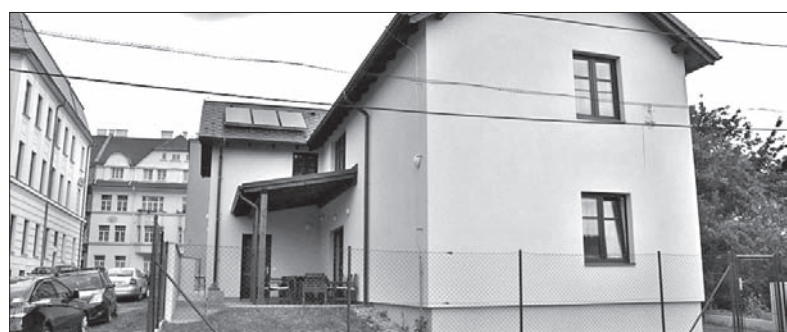
W tym domu powstały nowe mieszkania chronione.

Nowy dom z dziesięcioma mieszkaniami chronionymi powstał dzięki programowi transformacji placówek pobyty. (sch)