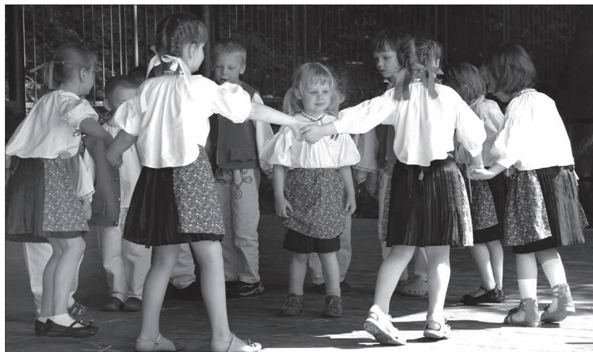
Najmłodszy nieborowianie na scenie.