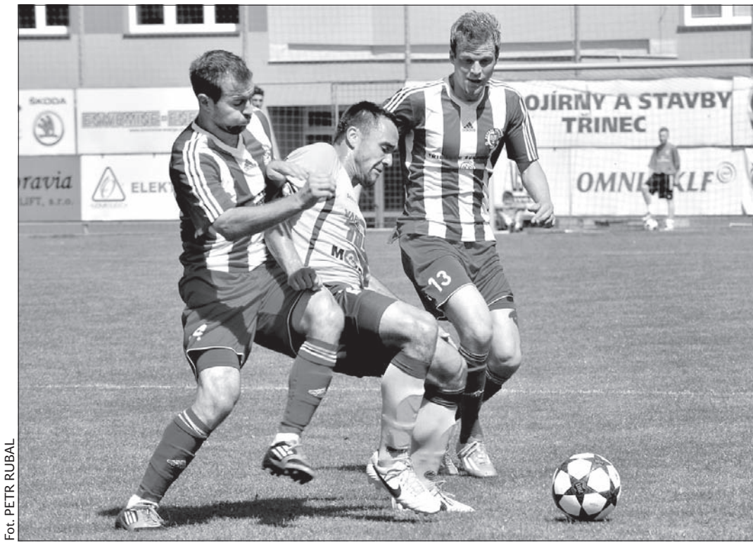
Trzyńczanie w wiosennej rundzie na stadionie Rudolfa Łabaja jeszcze nie przegrali.