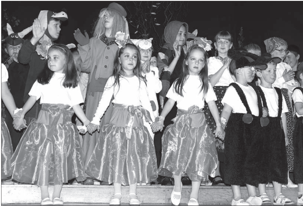
W przedstawieniu wystąpili uczniowie szkoły razem z przedszkolakami.

Z tej okazji w miejscowym Domu PZKO wystawiły bajkę śląską pt. „O dobrej Hance i złej Marynce”. Wystąpiło w niej 48 młodych aktorów, śpiewaków i tancerzy – 23 przedszkolaków i 25 uczniów nawiejskiej szkoły.