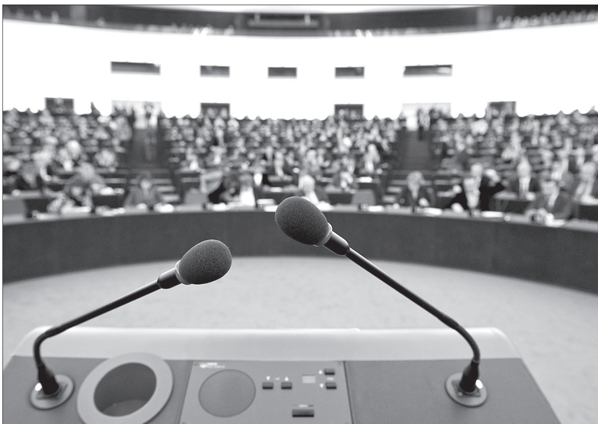
Najnowsza kadencja Parlamentu Europejskiego potrwa do roku 2019.

Tošenovský jest jednym z dwóch europosłów wyłonionych z listy Obywatelskiej Partii Demokratycznej. Partia ma o siedem mandatów