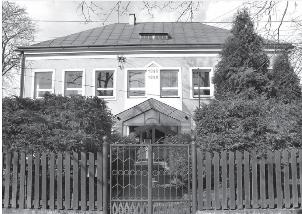
Polska podstawówka w Gródku. Zdjęcie wykonane w 2002 roku.