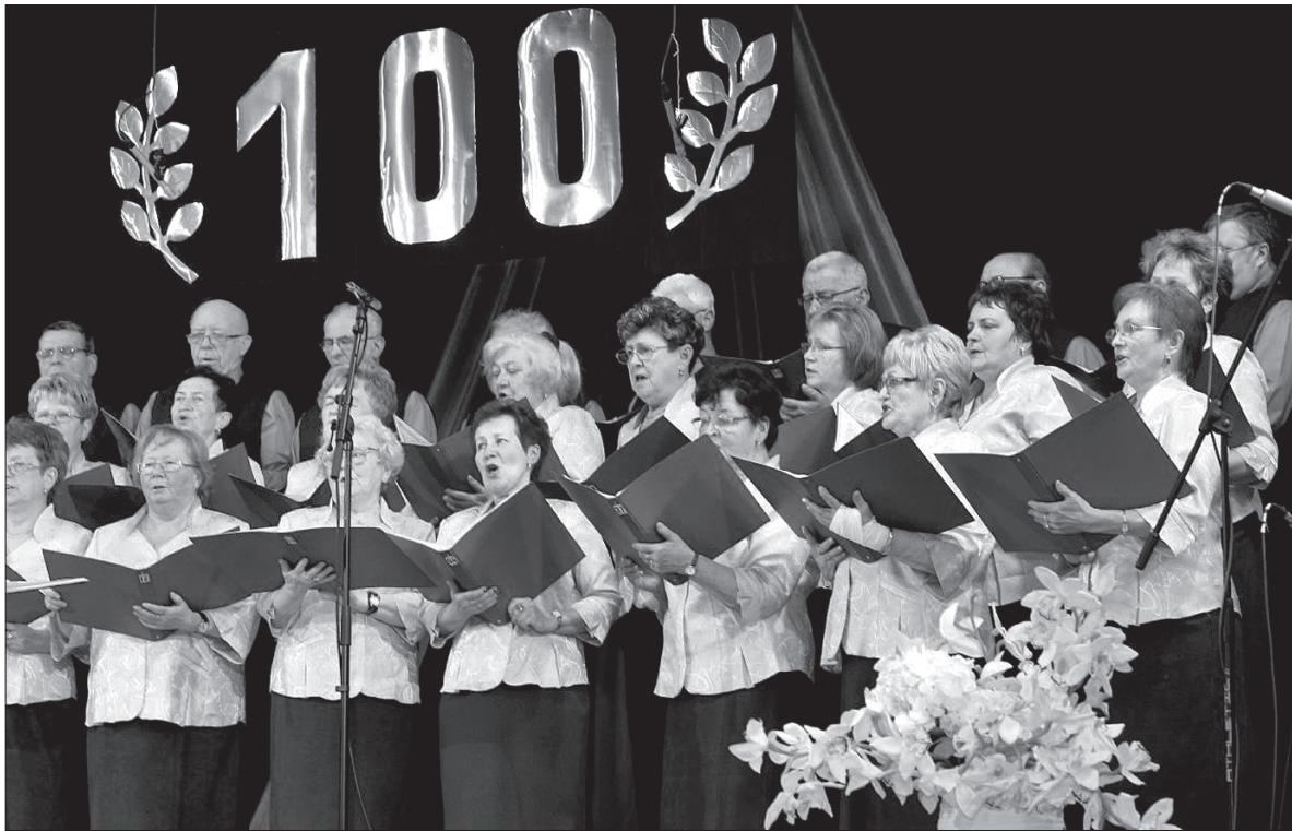
Chór Mieszany „Sucha” podczas występu na jubileuszu 100-lecia śpiewactwa w Suchej Górnej.

– W tej chwili jesteśmy na etapie poszukiwania dogodnego terminu prób. Chór „Sucha” nie jest dla mnie nieznanym zespołem. Miałem przy-