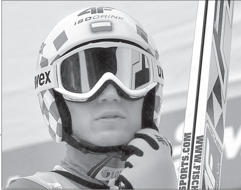
Kamil Stoch – jeden z faworytów dzisiejszego konkursu w Wiśle.

Na skocznię im. Adama Małysza (HS-134) szykują się tłumy kibiców.