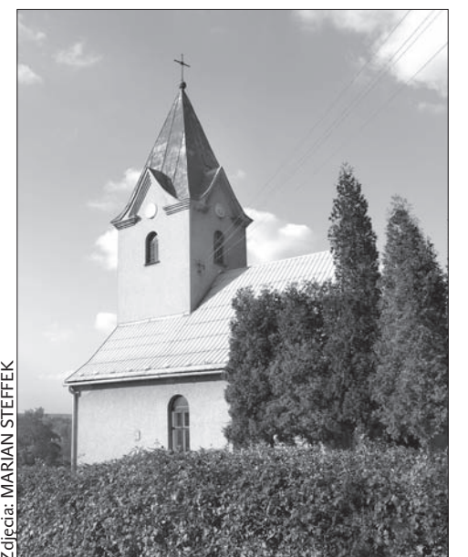
Kościółek ewangelicki na cmentarzu.

Budowę kaplicy rozpoczęto 10. IX. 1923 r. a dokończono w r. 1924. Poświęcka odbyła się