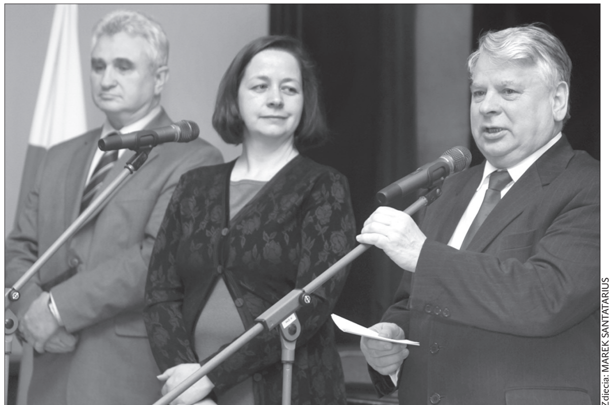
Marszałkowie Senatów RC i RP: Milan Štěch oraz Bogdan Borusewicz podczas spotkania w „Strzelnicy” w Cz. Cieszynie.

– Przyjąłem zaproszenie pana marszałka, by móc wam podziękować za waszą aktywność, za to, że współtworzyacie przyjazne stosunki pomiędzy naszymi krajami. Chciałbym was poprosić o to samo na przyszłość – powiedział marszałek czeskiego Senatu. Przypomniał, że również w Pradze żyje wielu Polaków, z którymi czę-