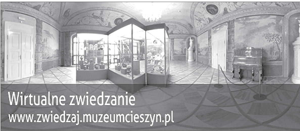
Dzięki projektowi Muzeum Śląska Cieszyńskiego można zwiedzać bez wychodzenia z domu.

Wśród wybranych przez jury przedsięwzięć oprócz cieszyńskiej „e-kultury” znalazły się bardzo różnorodne inicjatywy, na przykład otwarcie nowej siedziby Muzeum Marynarki Wojennej, otwarcie odbudowanego polskiego cmentarza w Koji nad Jeziorem Wiktorii w Ugandzie, zakończenie konserwacji najcenniejszych zabytków Lublina czy stworzenie Muzeum Animacji w Łodzi. (ep)