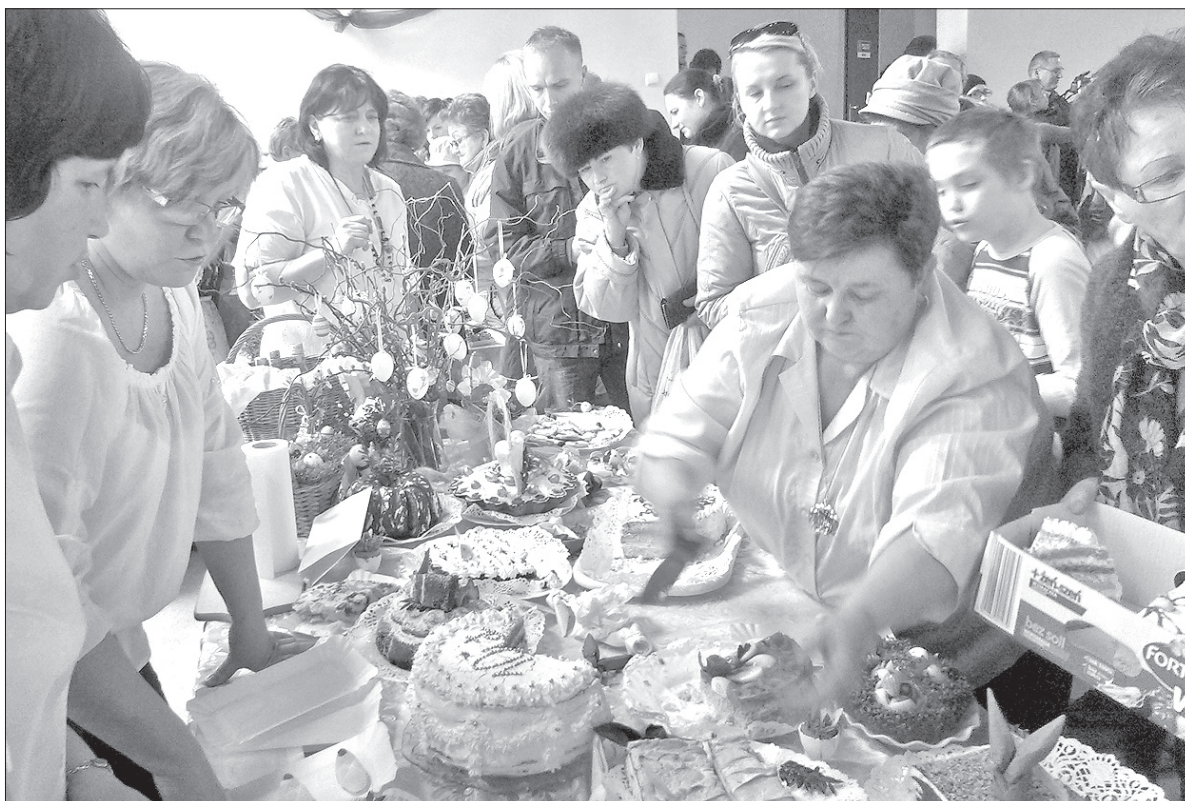
Stoły uginęły się pod ciężarem wielkanocnych potraw.

Kiedy w piątkowy wieczór w jednej z wiślańskich restauracji