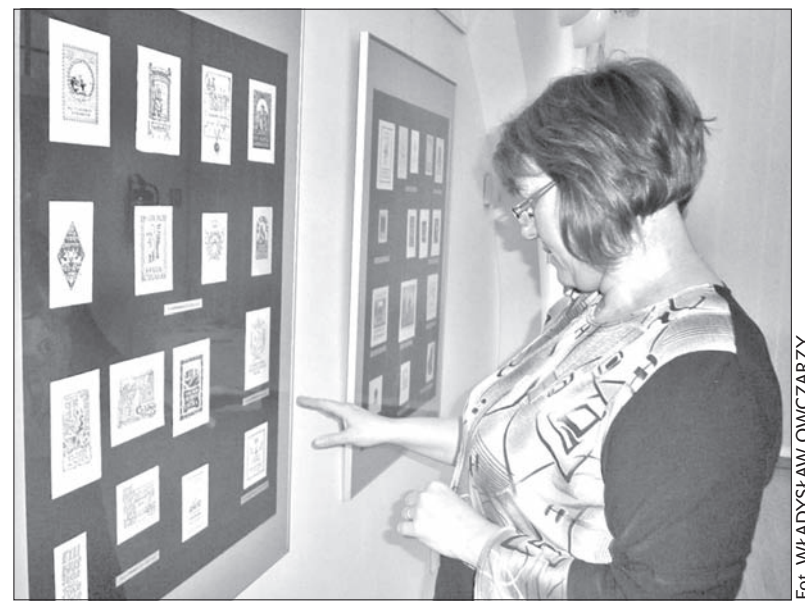
Fot. WŁADYSŁAW OWCZARZY