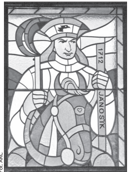
Witraż z 1957 roku przedstawiający Janosika w Parku Kultury i Wypoczynku w Bratisławie. Autor: Janko Alexy.