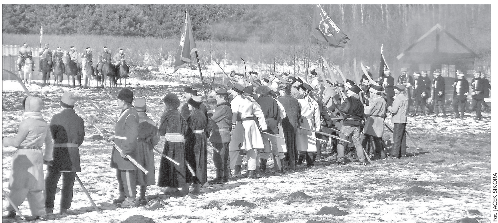
Z rekonstrukcji bitwy pod Grochowiskami sprzed 150 lat.

Bystrzyczanie nie tylko oglądali rekonstrukcję bitwy sprzed 150 lat, ale spotkali się też z przedstawicielami władz miasta, na czele w burmistrzem Włodzimierzem