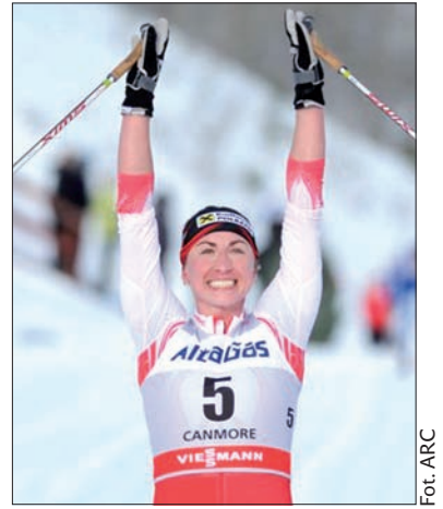
Justyna Kowalczyk triumfująca.