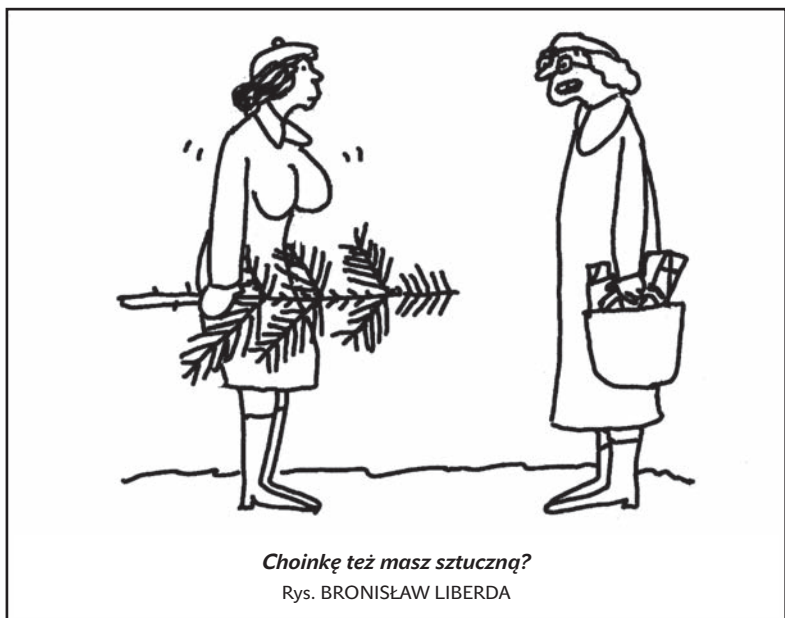
Choińkę też masz sztuczną?