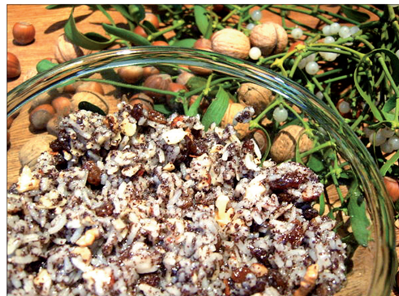
... Ewy Furtek

(z użyciem odrobiny mąki), które wgniatamy do foremek dowolnego kształtu (foremek nie trzeba smarować, bo kopciuszki łatwo z nich wychodzą). Pieczemy w rozgrzanym piekarniku na 180 st. C przez kilka