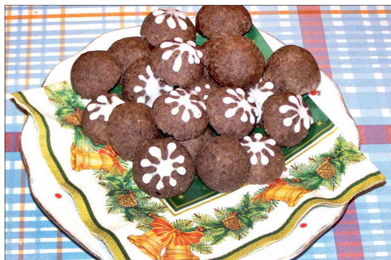
Świąteczny specjal Marty Orszulik...

Co roku przed świętami Bożego Narodzenia piekę ok. dwudziestu rodzajów ciasteczek. W tym roku też pewnie się nabiera co najmniej osiemnaście różnych gatunków.