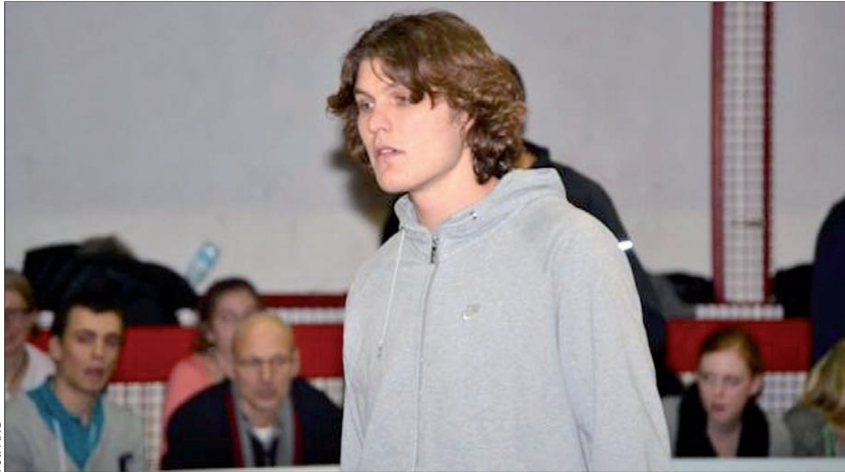
Iwan Uchow wraca do Wędrynie w roli złotego medalisty igrzysk w Londynie.

Pierwszoplanową postacią obu mityngów będzie Rosjanin Iwan Uchow, który po raz pierwszy przyjeżdża w roli złotego medalisty igrzysk olimpijskich. Uchow podczas letnich igrzysk olimpijskich w Londynie pokazał klasę, wygrywając wynikiem 238 cm. Taki sam rezultat osiągnął Uchow podczas skoków w Hustopeczach. W hali warunki do skakania są jednak trochę inne i niewykluczone, że w tym roku Rosjanin pobije swój rekord. Do Uchowa należy też rekord „Beskidzkiej Poprzeczki” wynoszący 234 cm. – W Trzynie czuję się zawsze świetnie. Tamtejsza publiczność potrafi dopingować. Widać i słychać, że kibice znają się w Czechach na lekkiej atletyce – stwierdził Uchow. Jego styl należy skądinąd do najbardziej oryginalnych w peletonie skoczków wzwyż. W fazie lotu, bezpośrednio nad poprzeczką, jak gdyby zatrzymuje się w miejscu. Przypomina to trochę sceny z filmu Matrix. Rosjanin uwielbia muzykę rockową, ostre nuty zabrzmiały też podczas jego skoków w