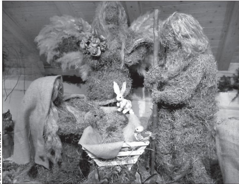
Szopka ze słomy i siana.

nia w godz. 10.00-18.00. Otwarta będzie również w Wigilię (do godz. 16.00) oraz w święta Bożego Narodzenia. Dziś i jutro w zamku odbywa się również bożonarodzeniowy jarmark. (dc)