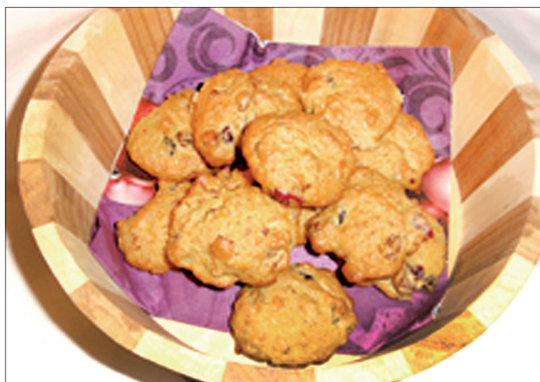
... Darii Woźnicy

W rondelku rozpuszczamy margarynę, prażymy płatki owsiane, dodajemy cukier i studzimy. Potem dodajemy proszek do pieczenia, rodzynek, jajka, mąkę i wg potrzeby