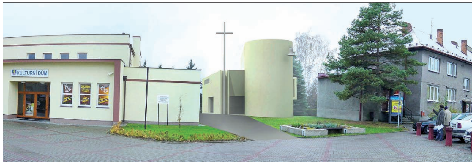
Tak ma wyglądać rynek w Cierlicku, kiedy obok stanie nowe Centrum Duchowe (wizualizacja w środku).

Rada Gminy uchwaliła w październiku przyznanie dotacji w wysokości 4 mln koron na budowę Centrum Duchowego, ale pod warunkiem, że budowa rozpocznie się najpóźniej do dwóch lat. Koszty budowy oszacowano na 15,4 mln koron. – Inwestycja będzie pokryta z własnych środków, częściowo z dotacji gminnej, zwrócimy się też z prośbą o wsparcie do tych przedsiębiorstw, z powodu których budowano w przeszłości zaporę. Zresztą, jak wynika z doświadczeń innych miejscowości, nikt, rozpoczynając budowę kościoła, nie ma od razu pieniędzy na jej dokończenie. Te gromadzone są stopniowo – powiedział „Głowski Ludu” radny Jaromír Žvak, znany cierlicki przedsiębiorca, który jest zarazem członkiem Rady