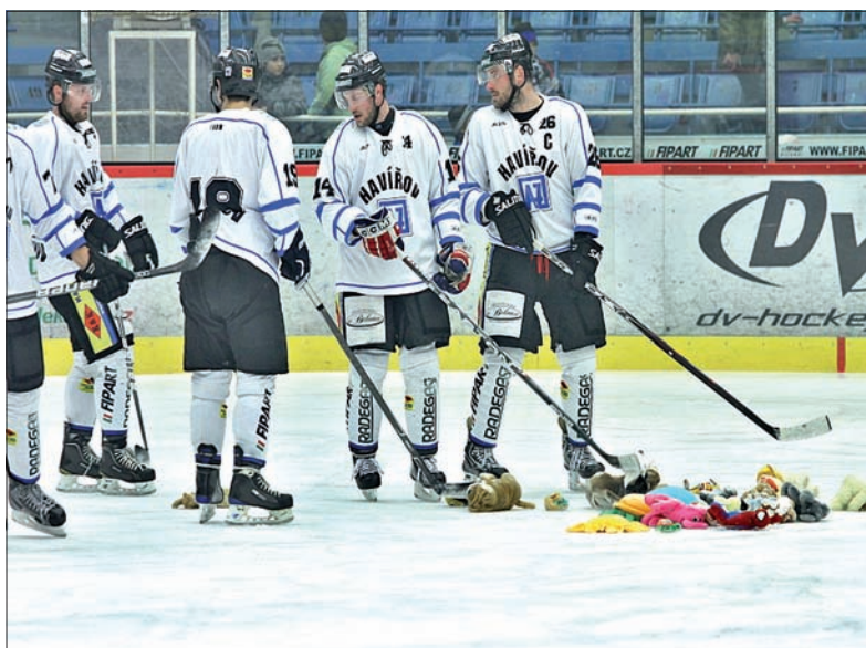
Pluszkami, jako podziękowanie za świetny hokej. Zespół Hawierzowa prowadzi w tabeli grupy wschodniej II ligi.

Lokaty: 1. Hawierzów 54, 2. Prościejów 50, 3. Przerów 45, 8. Karwina 31 pkt. Dziś (17.00): Hawierzów – Wsecin i Karwina – Opawa. (jb)