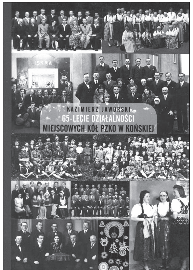
Okładka najnowszej publikacji Kazimierza Jaworskiego.