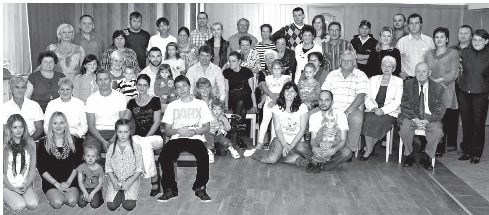
Uczestnicy sobotniego zjazdu rodziny Leitkepów.

kawałku roli we własnym gospodarstwie z dwiema lub trzema krowami, prosiakami i drobiem. Pięcioro starszych dzieci uczęszczało do polskiej szkoły w Olbrachcicach. Po roku 1920, kiedy we wsi otwarto szkołę czeską, tzw. masarykową, rodzice pod groźbą utraty pracy na kopalni przez głowę rodziny, zmuszeni byli kolejne dzieci zapisać do założonej wtedy szkoły czeskiej. Narodowość jednak zachowali polską. Na spotkaniu królowała gwara cieszyńska, ale najmłodsze pokolenie w większości posługiwało się już językiem czeskim.