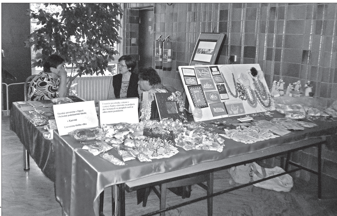
Swoje produkty przedstawili w Karwinie także pensjonariusze tzw. warsztatów pracy chronionej z Olzy.