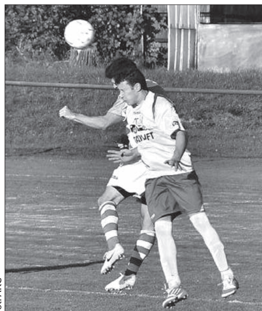
Z meczu Lutynia Dolna – Czeladna.

Piłkarzom Starego Miasta wystarczyły dwa strzały na bramkę Kreželoka, by wygrać te zawody. Gra toczyła się przeważnie w polu karnym gości, którzy liczyli na kontry i wybijanie piłki na oslep. Taktyka stosowana przez większość zespołów gra-