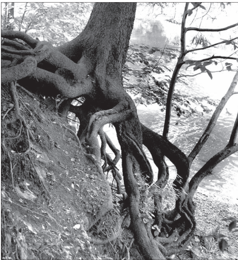
Nadmierna eksploatacja drzew w ostatnich latach martwi nie tylko ekologów.

Obszary, gdzie nie ma drzew, porasta wysoka trawa i gąszcz. Zagłuszają m.in. miejsca, gdzie stoją pomniki upamiętniające ofiary Tragedii Żywocickiej, przez co nawet te, które znajdują się tuż obok głównej alei, stały się niewidoczne. Nadmierna eksploatacja drzew w lasach podmiejskich (nie tylko Żywocickim) realizowana w ostatnich latach martwi nie tylko mieszkańców. Nie podoba się również władzom Hawierzowa. W marcu wystosowały list do dyrektora generalnego spółki Lasy RC. Na konkretne wyniki, a raczej tylko obietnicę zmiany, trzeba było czekać pół roku. Dyrekcja generalna skierowała wódaty miasta do zarządu lasów w Ostrawie i dyrekcji wojewódzkiej w Frydku-