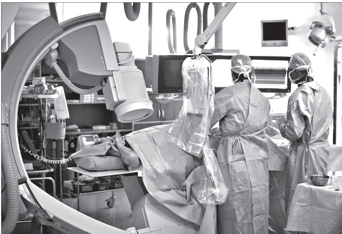
Unikatowy zabieg w Szpitalu Podlesie.

Szpital Podlesie od 2009 wchodzi w skład narodowej sieci ośrodków leczenia chorób sercowo-naczyniowych, utworzonej przez ministerstwo zdrowia. Trzyńscy lekarze, jako pierwsi w kraju, przeprowadzili od tego czasu kilka unikatowych zabiegów. (dc)