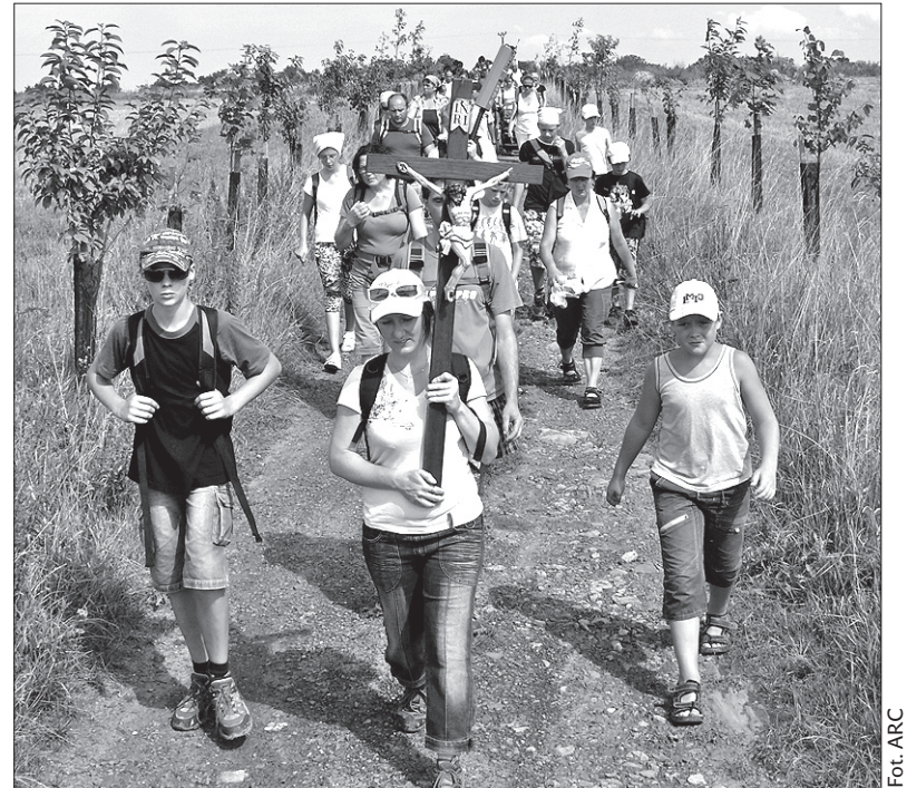
Pielgrzymi w drodze do Frydku.

Frydek jest tradycyjnym miejscem pielgrzymowania katolików z naszego terenu. Z prośbami o wsparcie do Matki Boskiej Frydeckiej pielgrzymki wyruszają zwłaszcza w sierpniu i wrześniu. W minioną sobotę do Bazyliki Nawiedzenia Panny Marii udali się parafianie z Ropicy. Drogę pokonali w dziewięć godzin. Wśród 48 pątników najmłodszy miał niespełna dwa lata i jechał w wózku. Pielgrzymom to-