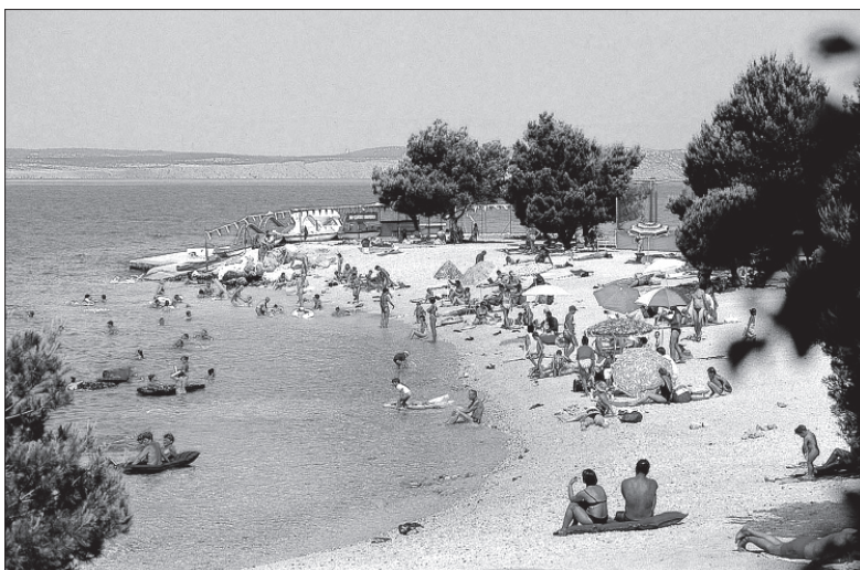
Plaża nad Adriatykiem w Crikvenicy.

Ponad czterdzieści dzieci z Karwiny wypoczywa w tych dniach nad morzem w Chorwacji. Rozpoczął się pierwszy turnus wypoczynku zorganizowanego, w większej części opłaconego przez miasto. Dzieci z opiekunami wyjechały do Crikvenicy autokarem w poniedziałek pod wieczór. W sumie do końca wakacji będzie wypoczywać nad morzem 130 dzieci – uczniów wszystkich szkół podstawowych w Karwinie. (dc)