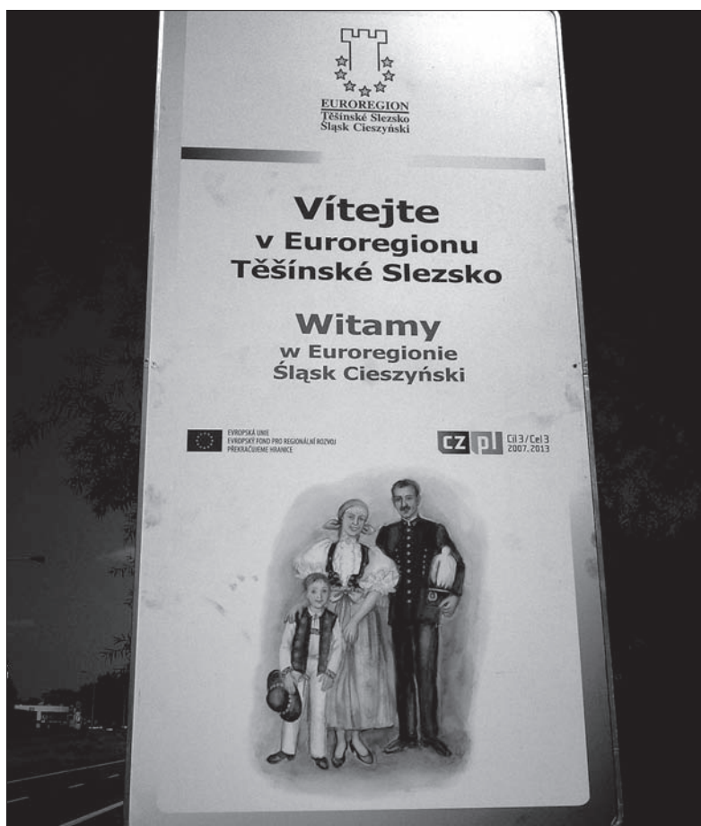
Tu zaczyna się Śląsk Cieszyński. Na zdjęciu tablica przy wjeździe do Hawierzowa.

Ci, którzy wybrali Śląsk, w 90 proc. nie umieli sami bliżej sprecyzować, jaki to Śląsk. Dopiero, gdy daliśmy im do wyboru przykładowo Śląsk Opawski, Cieszyński, Dolny lub Górny, drogą logicznej dedukcji z reguły (choć nie wszyscy) wybrali Cieszyński. Jedna młoda kobieta wahała się między Śląskiem Cieszyńskim i Dolnym, inna – starsza hawierzowianka, pochodząca z Opawy – nawet na podstawie naszej podpowiedzi nie była w stanie określić, o jaki Śląsk chodzi. Jedynie mężczyzna w wieku emerytalnym bez wahania odpowiedział: – Tu jest Śląsk Cieszyński. Urodziłem się w Ostrawie, ale przez lata mieszkałem w Karwinie, teraz w Hawierzowie, wiem, że oba te miasta leżą na Śląsku Cieszyńskim.