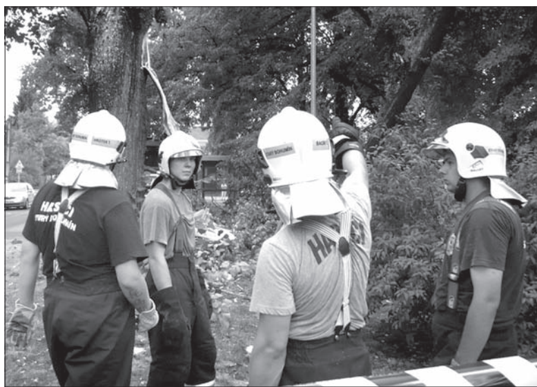
W Boguminie strażacy przez cały wtorek usuwali skutki nocnej burzy.

Dąbrowę Górnica. Z powodu powalonych drzew utrudniona była komunikacja kolejowa na szlaku