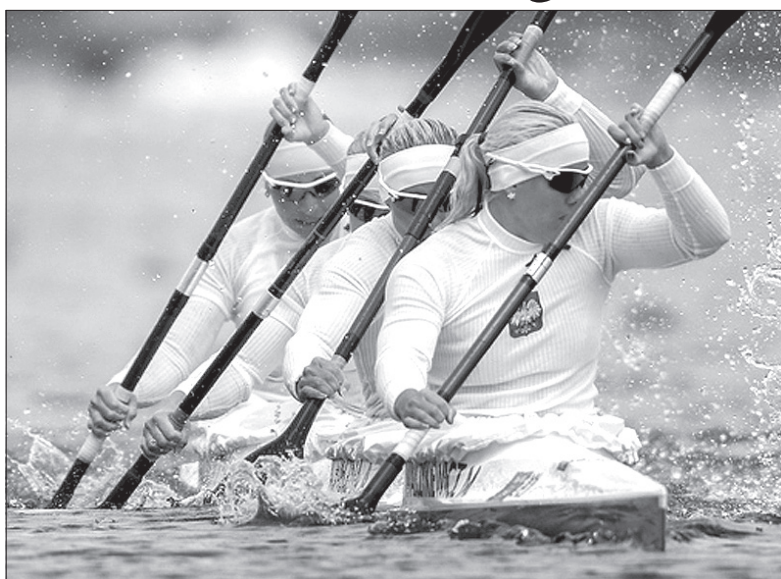
Polskim kajarkom zabrakło wczoraj do medalu dwie dziesiąte sekundy.

Po wczorajszym finale na torze kajakowym pozostał duży niedosyt. Polki w półfinale osiągnęły najlepszy wynik na świecie w tym sezonie