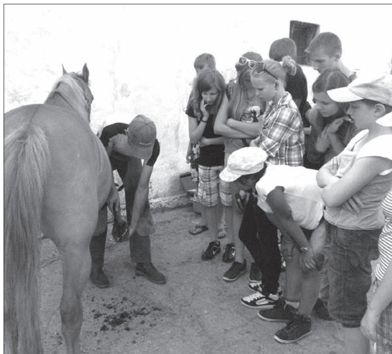
Dzieci przyglądają się podkuwaniu konia.