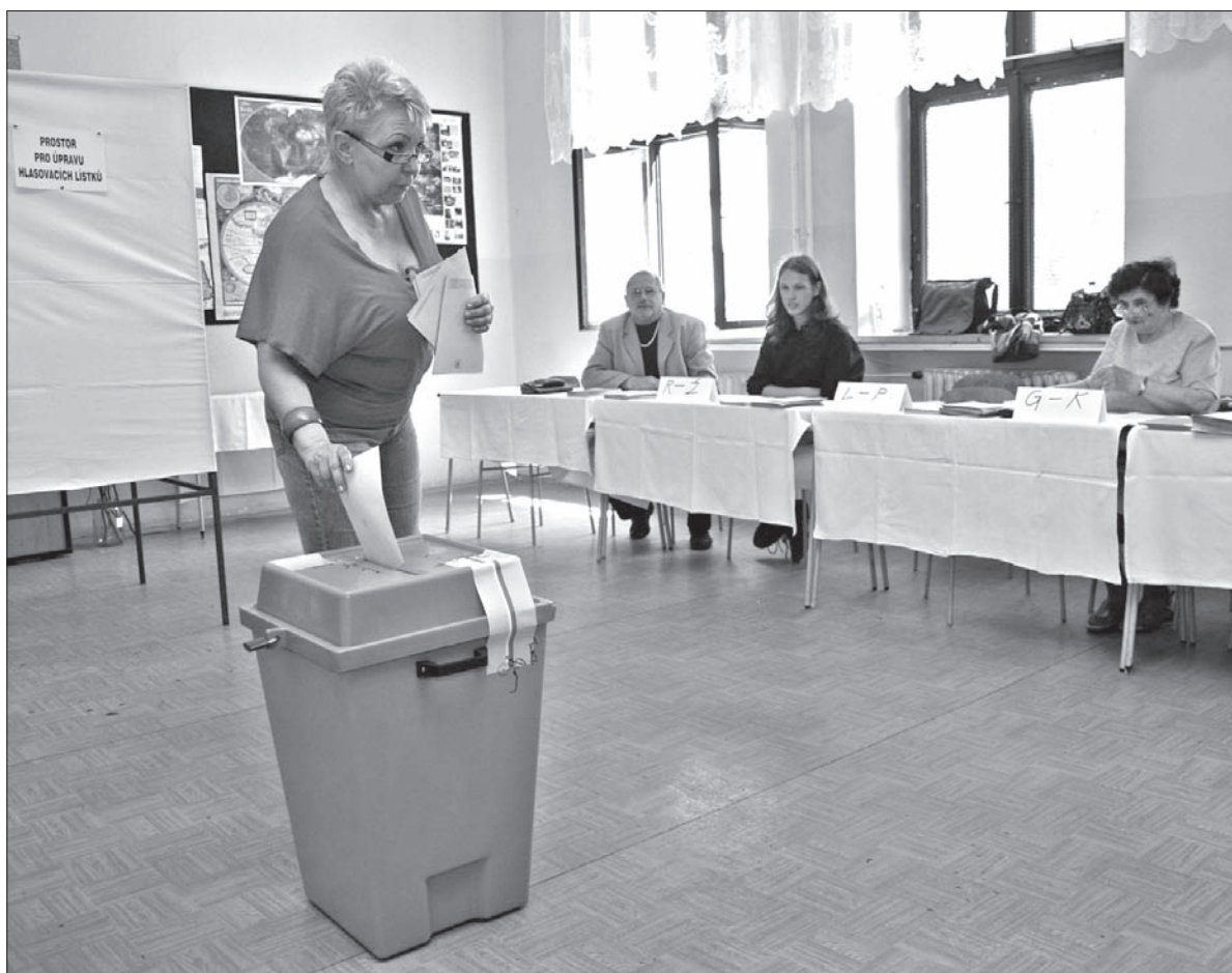
Już wkrótce znów pójdziemy do urn.