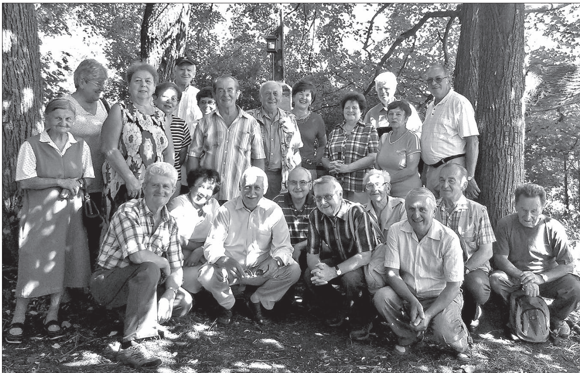
Pamiątkowe zdjęcie pod krzyżem wędryńskiego Klubu Seniora.