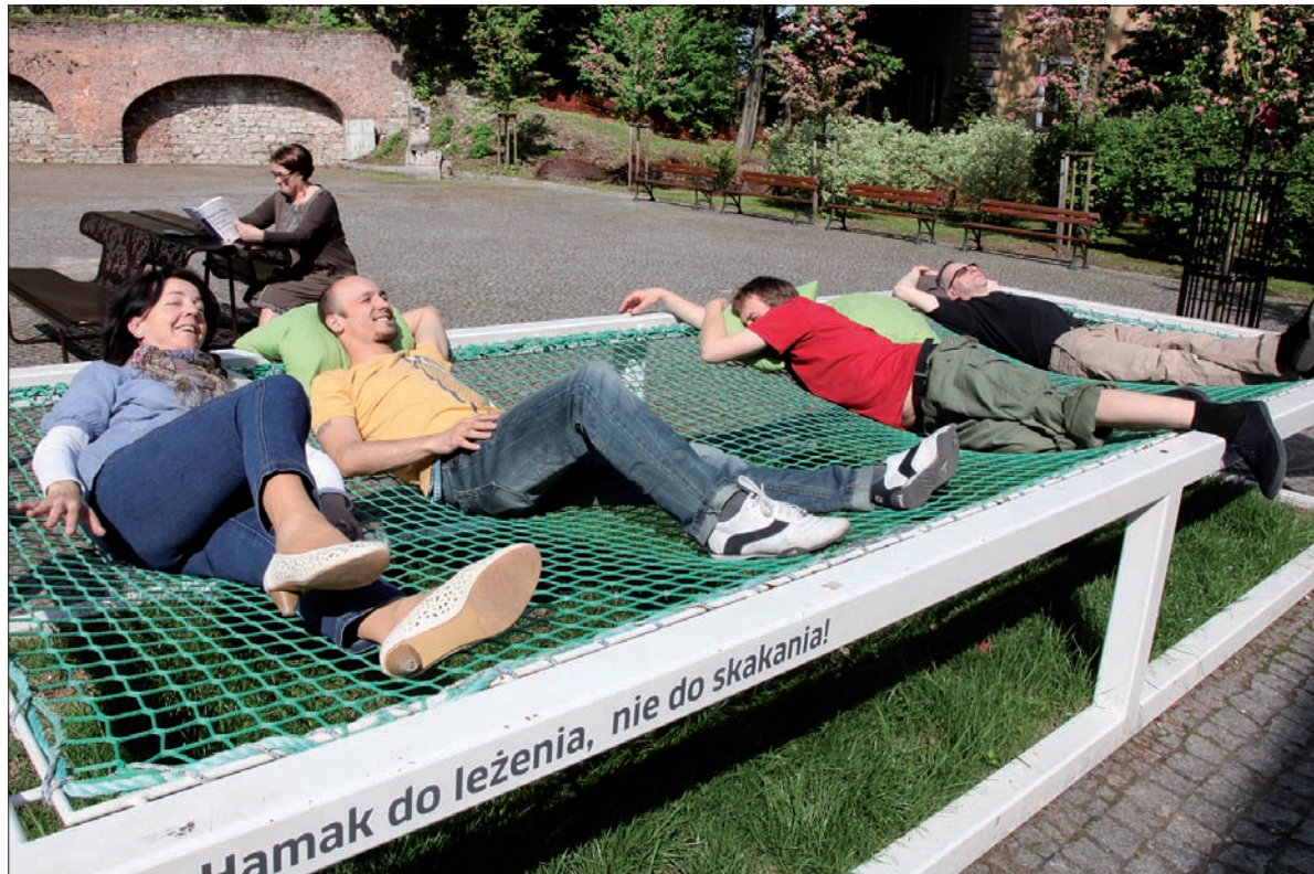
Na placu zamkowym można spokojnie odpocząć.