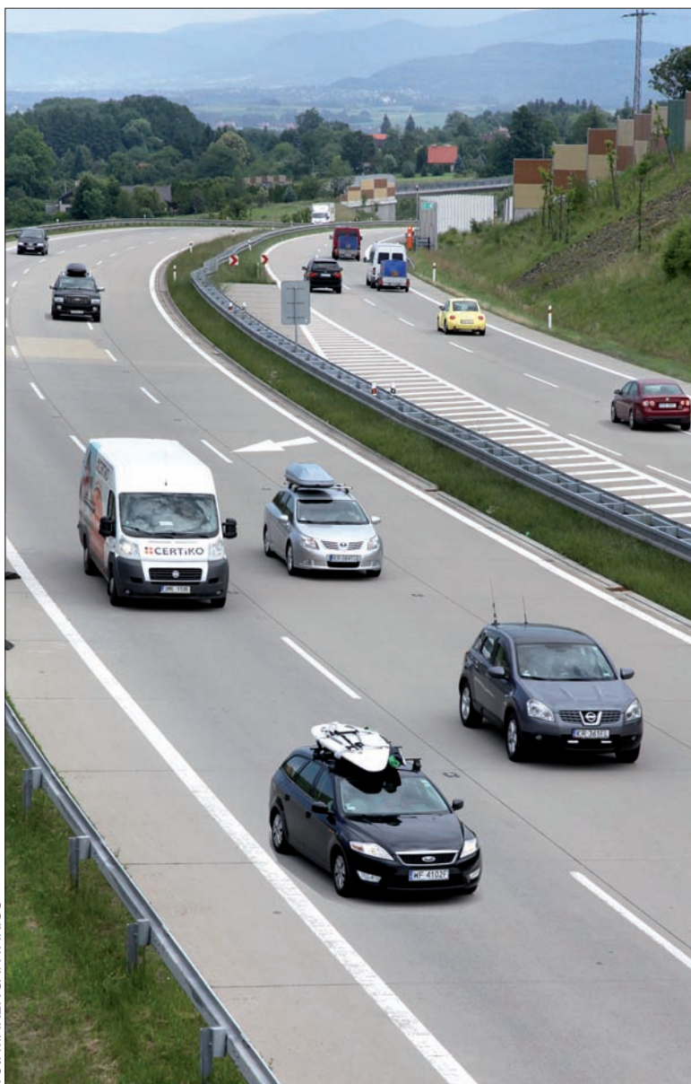
Wczoraj po południu na drodze szybkiego ruchu z Czeskiego Cieszyna do Frydku-Mistku było jeszcze w miarę spokojnie.