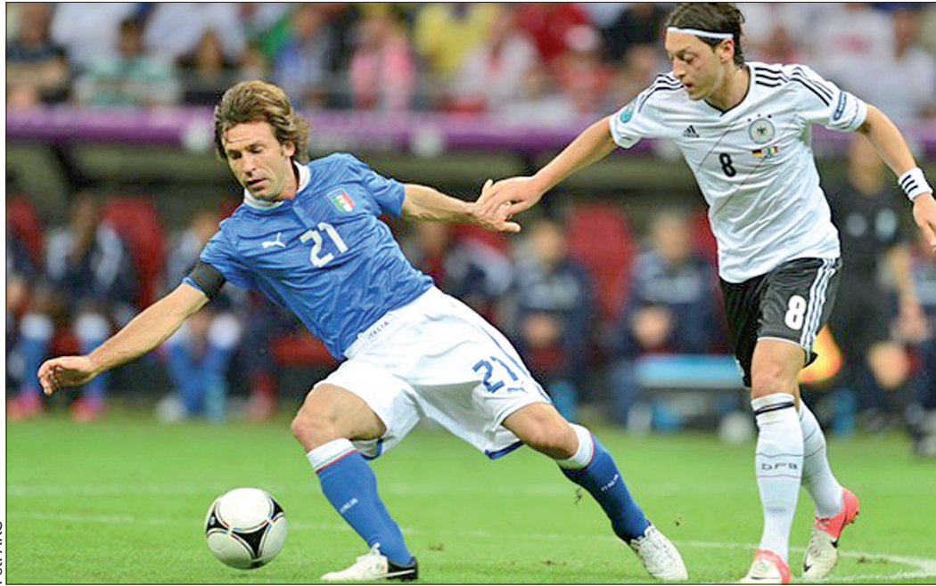
Andrea Pirlo (przy piłce) należy do kluczowych zawodników reprezentacji Włoch.

Do najlepszych włoskich piłkarzy w tych mistrzostwach należy Andrea Pirlo. Pomocnik Ju-