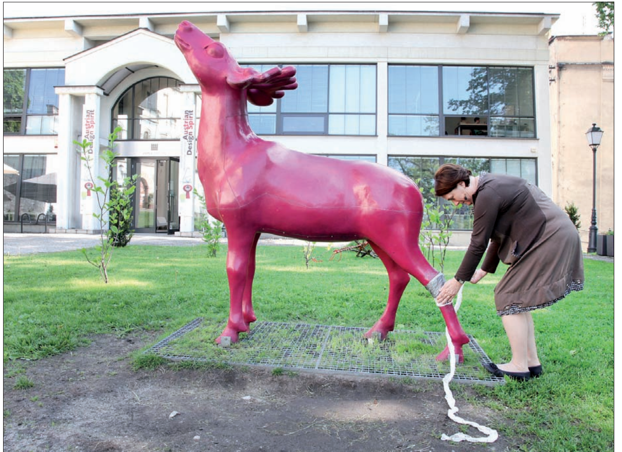
Jelonek miewa czasami zabandażowaną nóżkę...