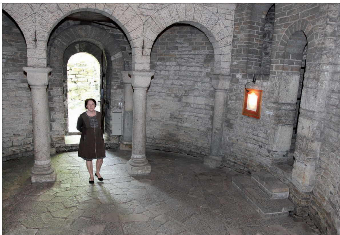
Rotunda św. Mikołaja i Wacława to jeden z symboli Cieszyna.

Tekst: JACEK SIKORA