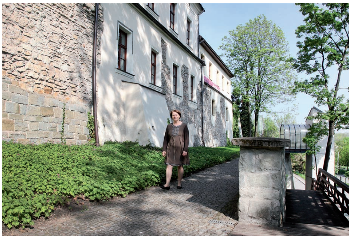
Warto spacerować się Uliczką Cieszyńskich Kobiet.

otworzyć salę ze stałą ekspozycją tradycyjnego rzemiosła. Warto też odwiedzić taras widokowy – zaprasza nas szefowa Zamku. Rzeczywiście. Krajobrazy są po prostu wspaniałe. – Tam jest Książnica Cieszyńska, Teatr im. Adama Mickiewicza, Ratusz, Hotel Pod Brunatnym Jeleniem... – wskazuje ręką naszą przewodniczkę. Liczymy wieżyczki cieszyńskich kościołów. Z drugiej strony zaś podziwiamy odnowiony ogród z Uliczką Cieszyńskich Kobiet. A jeśli dobrze się przyjrzeć, można zobaczyć flagi cieszyńskiego Brackiego Browaru Zamkowego.