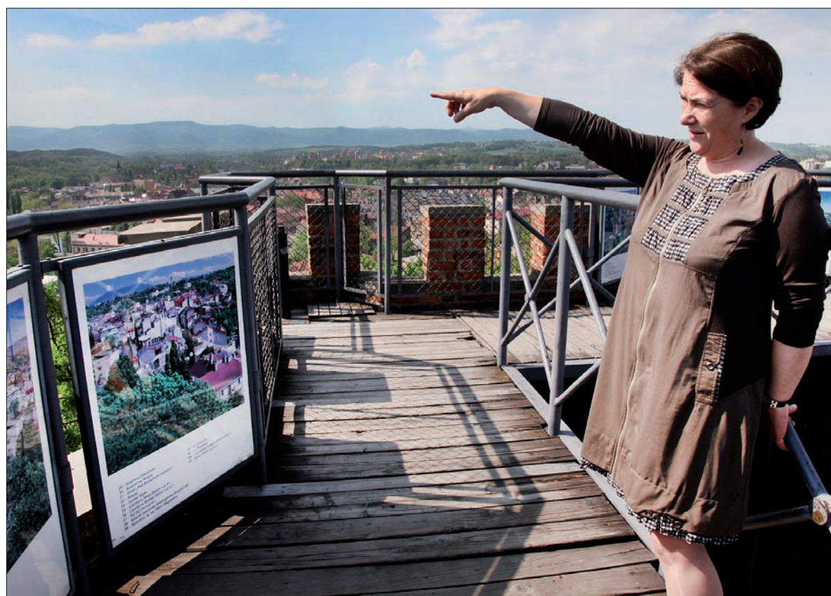
– A tam jest Wielka Czantoria – pokazuje na Wieży Piastowskiej szefowa Zamku Cieszyn.

Ruiny kryły wspomnianą już wieżę, na którą wchodzimy. – Okazało się, że chodzi o basztę z XIII wieku. To, co widzimy, to rekonstrukcja, która nie może oddać rzeczywistego pierwotnego wyglądu budynku, bo nie wiemy, jak on wyglądał. Bo na rycinach z XV wieku ona jest już w innym kształcie. Niemniej przynajmniej trochę można poznać, jak wyglądało wnętrze wieży – zachęca nas do wejścia na basz-