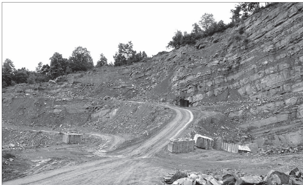
Widok na kamieniołom piaskowca godulskiego.