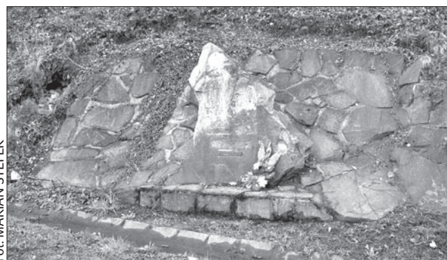
Pomnik po marcowej dewastacji przez „złomiarzy”.

Delegacja z Wierzchosławic zobowiązała się wystosować odpowiednie pisma do wójta Gródku z zobowiązaniem od-