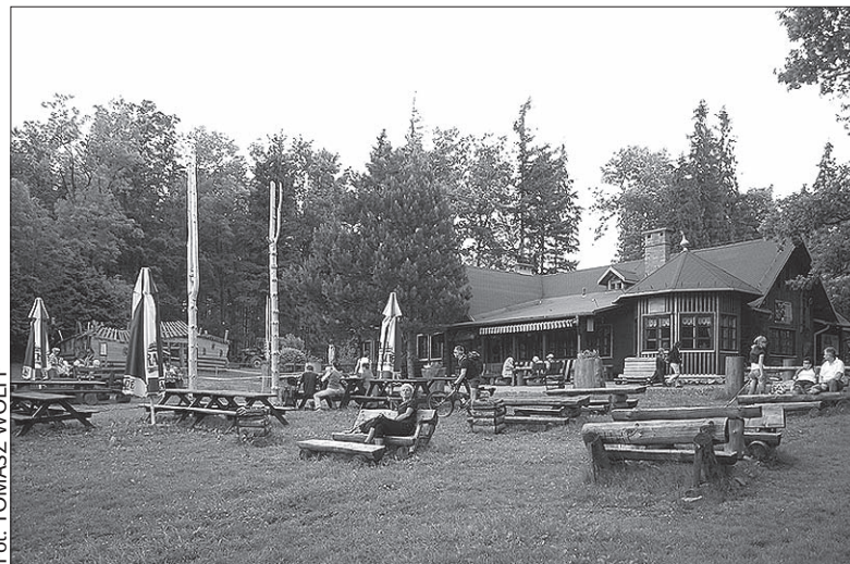
Wejście na Kozią Górę z każdej strony zajmie nam nie więcej niż półtorej godziny.

– We wtorki oraz w weekendy to miejsce spotkań seniorów, którzy „uciekają” tutaj pieszo przed lekarzem. Schronisko przechodziło różne koleje losu, od czasu, kiedy przejął