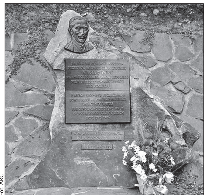
Pomnik Wincentego Witosa w roku 2004.

tworzenia replik skradzionego popiersia i tablicy. W piśmie zawarta została prośba o zgodę na zmianę miejsca usytuowania obelisku. Robert Borski wstępnie wyraził zgodę na wszechstronną pomoc przy renowacji i załatwieniu spraw związanych ze zmianą miejsca usytuowania. Prace powinny być zaplanowane tak, by w przyszłym roku można było w nowym, dogodniejszym miejscu uroczystie odsłonić na nowo obelisk z replikami popiersia i tablicy. (maki)