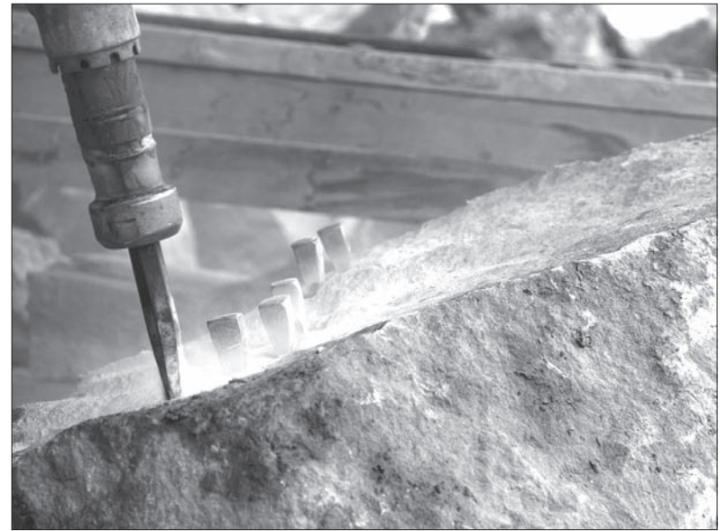
Dłuto zastąpiła wiertarka.

Moje stereotypowe wyobrażenia na temat wydobycia kamienia za pomocą dynamitu uległy zmianie. Jak się dowiedziałam, obecnie stosuje się technologie, które wykorzystywane są również w kopalniach węgla kamiennego. Mam nadzieję, że będę świadkiem przynajmniej małego wybuchu. – Dziś nie będziemy stosować materiału wybuchowego,