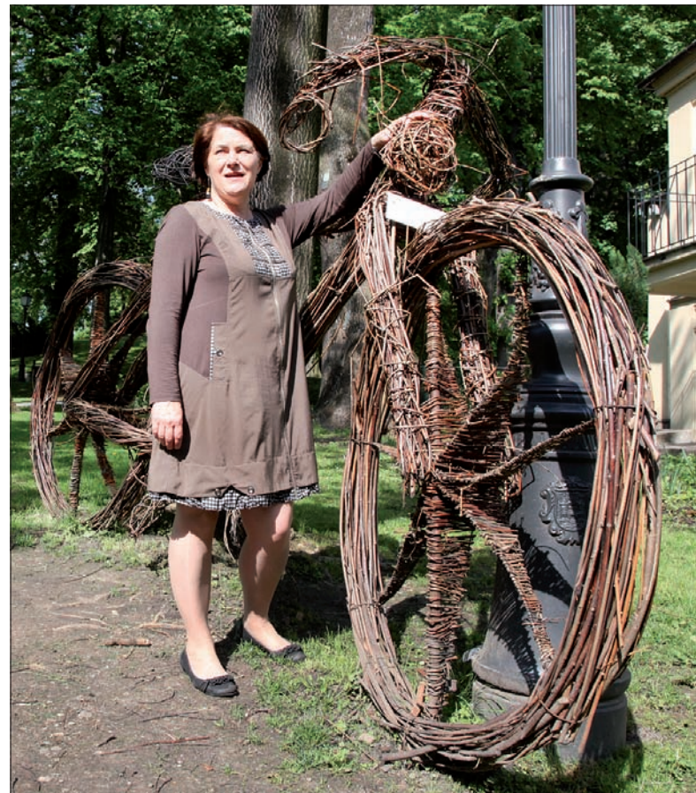
– Ten rower jest zielony, wykonany z wikliny – podkreśla szefowa Zamku Cieszyn.