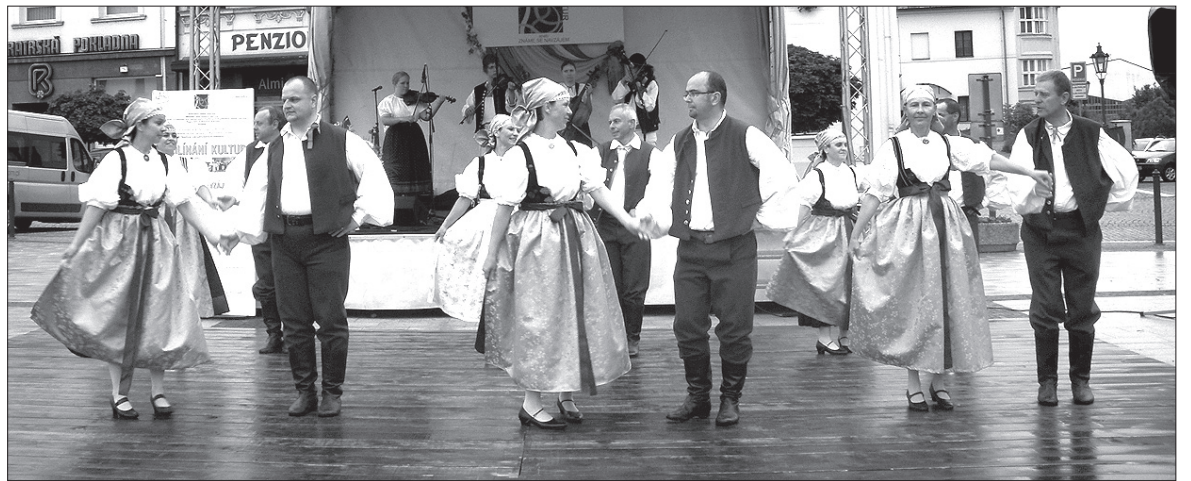
Zespół „Oldrzychowice” tańczył w trudnych warunkach, na wilgotnym podium.

Na festiwalu, którego organizatorem są miasto Karwina we współpracy z komisją ds. mniejszości narodowych oraz Miejski Dom Kultury, wystąpił cały szereg zespołów, które zaprezentowały polską, romską, grecką i słowacką kulturę. Naszymi reprezentantami były zespoły PZKO „Oldrzychowice” i „Bystrzyca”. Na uwagę zasługiwała m.in. ostrawska „Šmykňa” (folklor słowacki), grecki zespół „Evros” z Javorníka czy romska kapela „Imperio”. Pomimo niesprzyjającej pogody, po południu na rynku zebrało się sporo widzów. Młody Rom, otoczony grupką dzieci, filmował