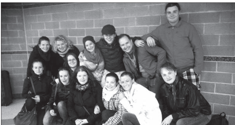
Wspólne zdjęcie w Szwecji.