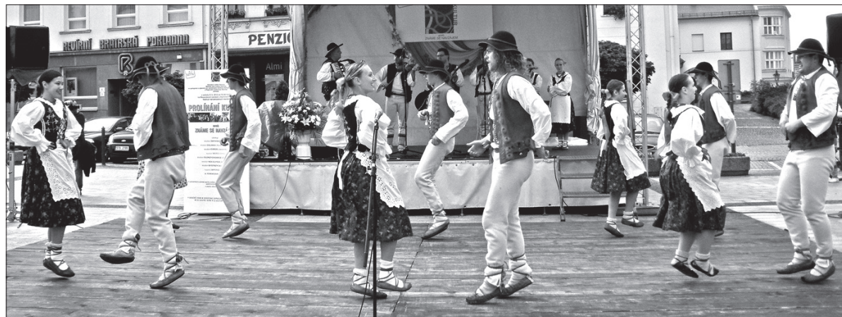
Pelen temperamentu występ „Bystrzycy”.