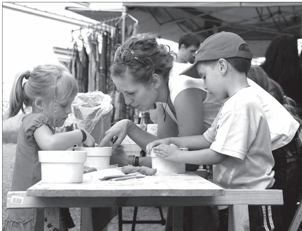
Dzieciom podobało się tworzenie czarek i misek ceramicznych w formie gipsowej.