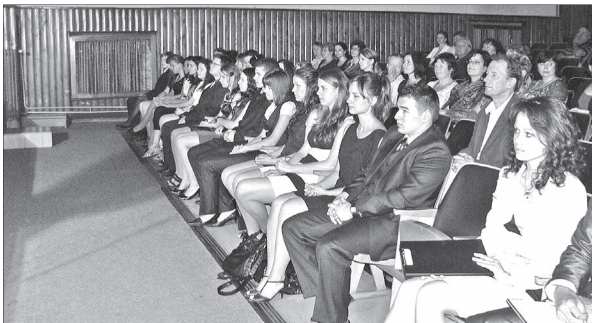
Uczniowie polskiej klasy Akademii Handlowej w Czeskim Cieszynie czekają na rozdanie świadectw maturalnych w Kinie „Centrum”.

Jak wynika z informacji, których udzielił nam dyrektorowie obydwu szkół, tegoroczni maturzyści woleli nie ryzykować i raczej wybierali niższy poziom matury państwowej. W Akademii Handlowej na wyższy poziom nie zdecydował się nikt. Ani w polskiej klasie, ani w pozostałych trzech czeskich. W gimnazjum wyższy poziom matury państwowej z matematyki wybrało 5 osób (z 37), a