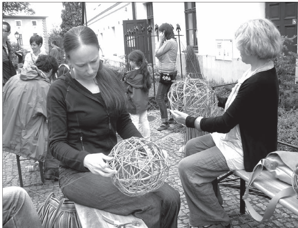
Komu nie brakowało czasu i cierpliwości, mógł wziąć udział w warsztatach plecionkarskich.