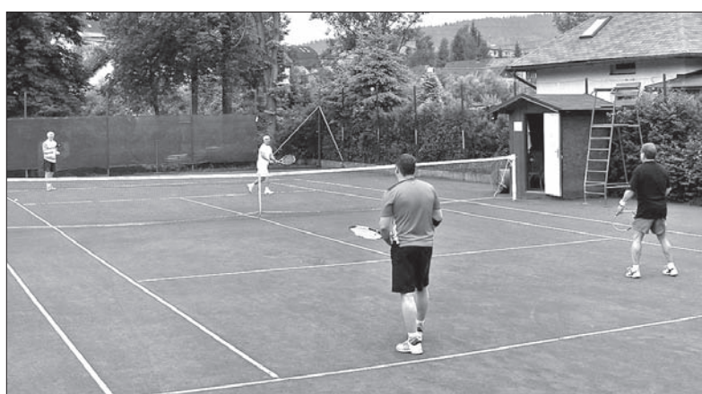
W Bystrzycy można od dziś korzystać z wyremontowanych kortów do gry w tenisa.

wrunki do gry w tenisa, ale także solidne zaplecze. Na przełomie lipca i sierpnia chcemy zorganizować