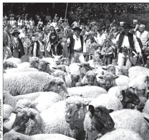
„Mieszynio łowiec” w roku 2011.

nicy, kapela z wołoskich Wielkich Karłowic, „Górole” z Mostów koło Jabłonkowa... (kor)