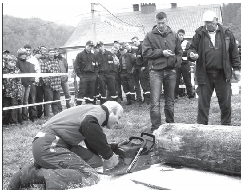
Drużyna z Oldrzychowic wywalczyła trzecie miejsce.