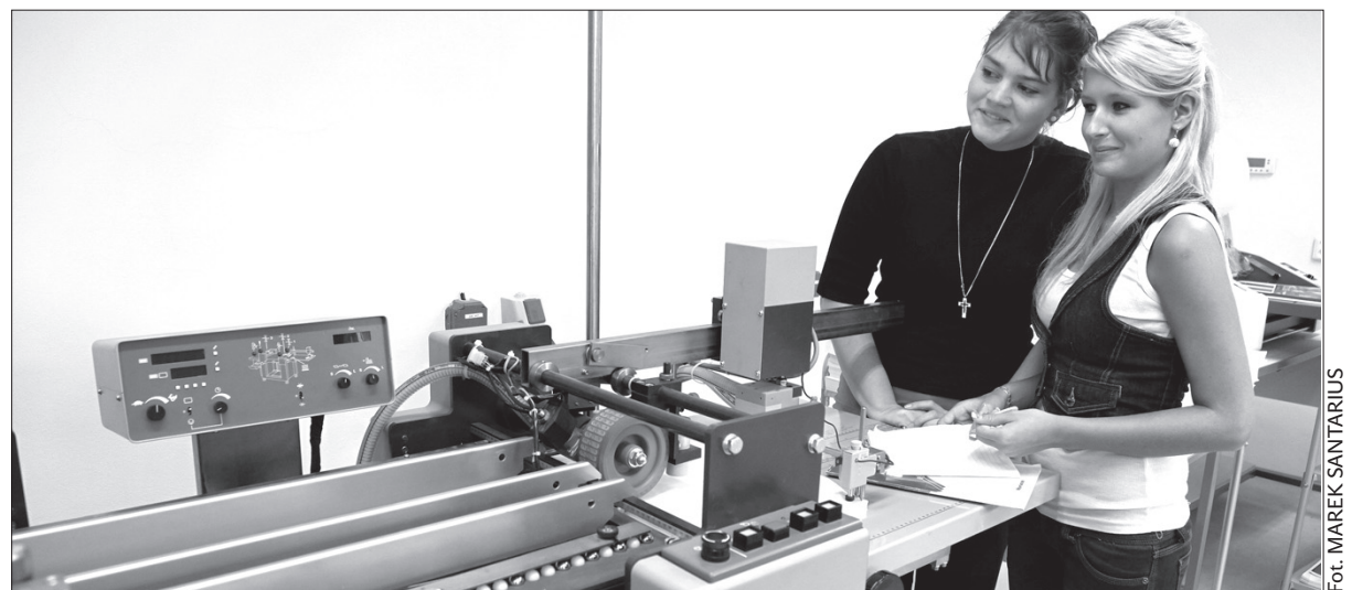
Przyszli drukarze maturalne egzaminy praktyczne będą zdawać w Studiu Poligraficznym Święty Jan.