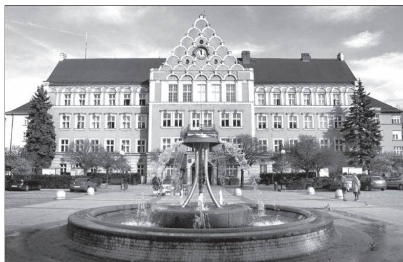
Czeskocieszyński ratusz dziś...