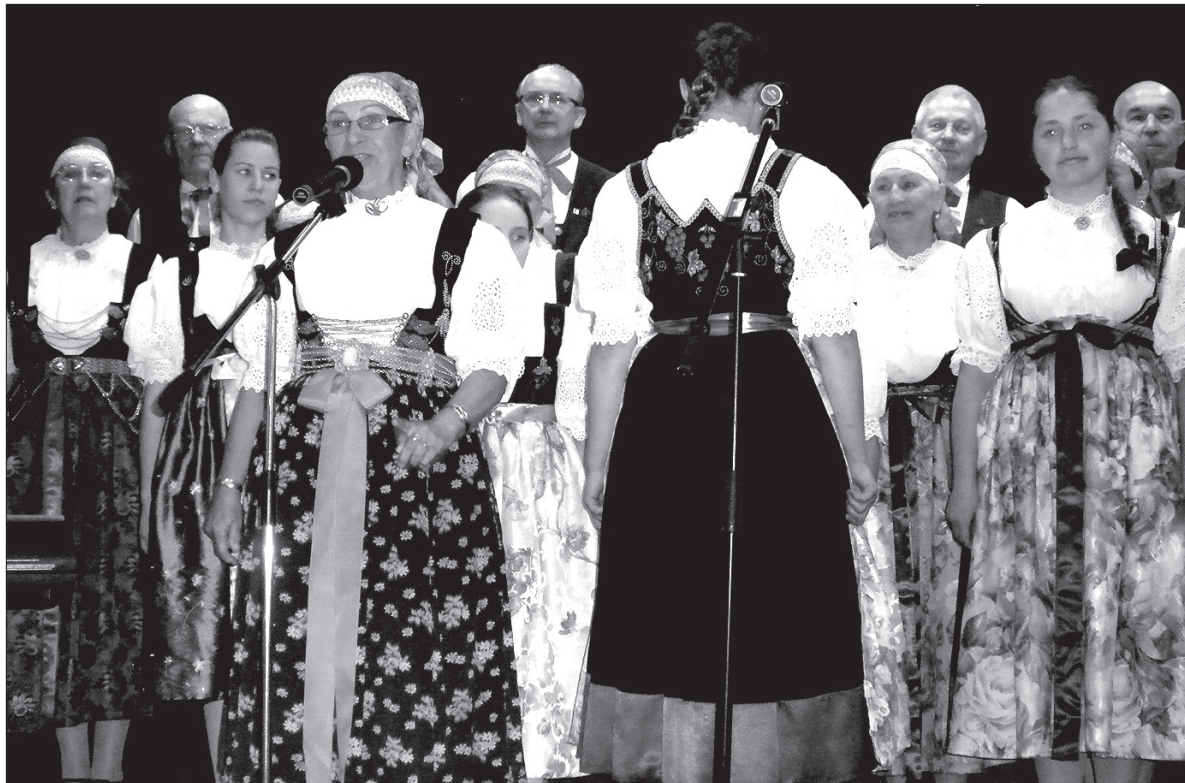
Prezentem dla pezetkaowców był występ Estrady Ludowej „Czantoria” z Ustronia.

Pięknym prezentem dla pezetkaowców był koncert Estrady Ludowej „Czantoria” z Ustronia – zespołu wielopokoleniowego, w którym obok siebie występują na scenie nastoletnie dziewczęta oraz panie i panowie, których włosy przyprószyła już siwizna. „Czantoria” wykonała wiązankę pieśni cieszyńskich w adaptacji chóralnej, bawiła zebranych również pieśniami biesiadnymi i pełnymi humoru opowiastkami gwarowymi. Goście z Ustronia nie zapomnieli złożyć życzeń pezetkaowcom obchodzącym podwójny jubileusz, podobnie