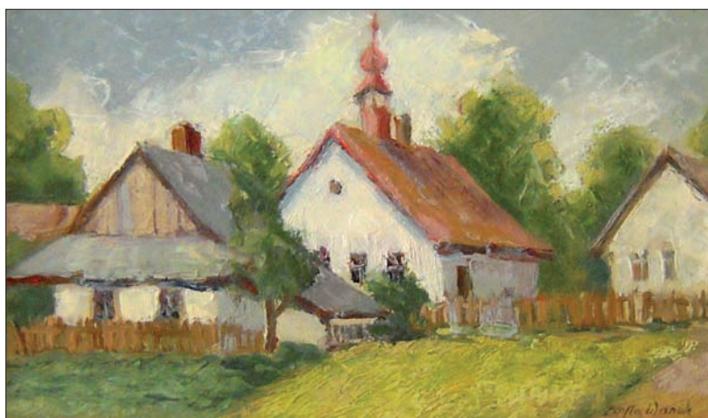
„Dawna polska szkoła w Śmitowicach”.

Później został stracony w egzekucji pod Wałką w Cieszynie. Siostra nigdy już nie znalazła nikogo, kto imponowałby jej tak, jak on. Wyszła za mąż, ale rozwiódła się i została sama.