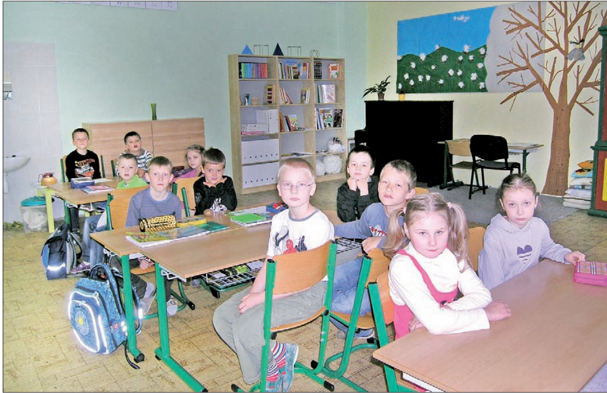
Polscy uczniowie szkoły w Koszarzyskach.

– Nasza szkoła boryka się ciągle z problemem małej liczby dzieci. Bardzo pozytywne i miłe jest jednak to, że w przyszłym roku szkolnym przywitamy w pierwszej klasie szóstkę dzieci. Mogę powiedzieć, że nasza