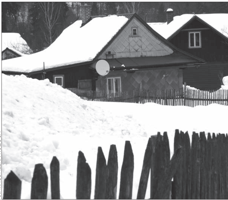
Łomna Górna skąpana w śniegu.

– Wracamy z osady Gruszków i Jelitów. Przekazaliśmy tamtejszym mieszkańcom żywność m.in. chleb, mleko, kielbasę. Od paru dni nie