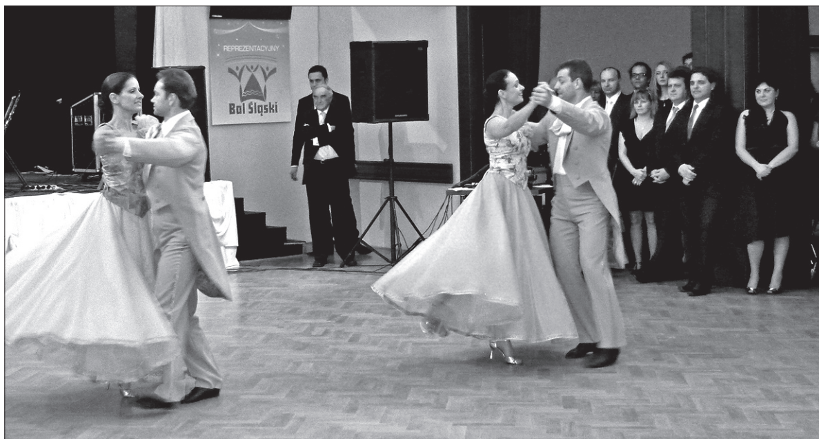
Pary baletowe ZPiT „Śląsk”.

Część gości, przede wszystkim z prawego brzegu Olzy, przybyło na bal w strojach ludowych. Osoby te zostały szczególnie uhonorowane. Przy wejściu otrzymały „plaskocz” mioduli z logo balu. Zabawę balową rozpoczęła „Biesiada Rodzinna”, czyli cztery pary małżeńskie z ZPiT „Śląsk”, które przedstawiły się w różnorodnym programie. Zabrzmiały znane pieśni musicalowe oraz biesiadne. Wszyscy zebrani śpiewali i bawili się wspólnie.