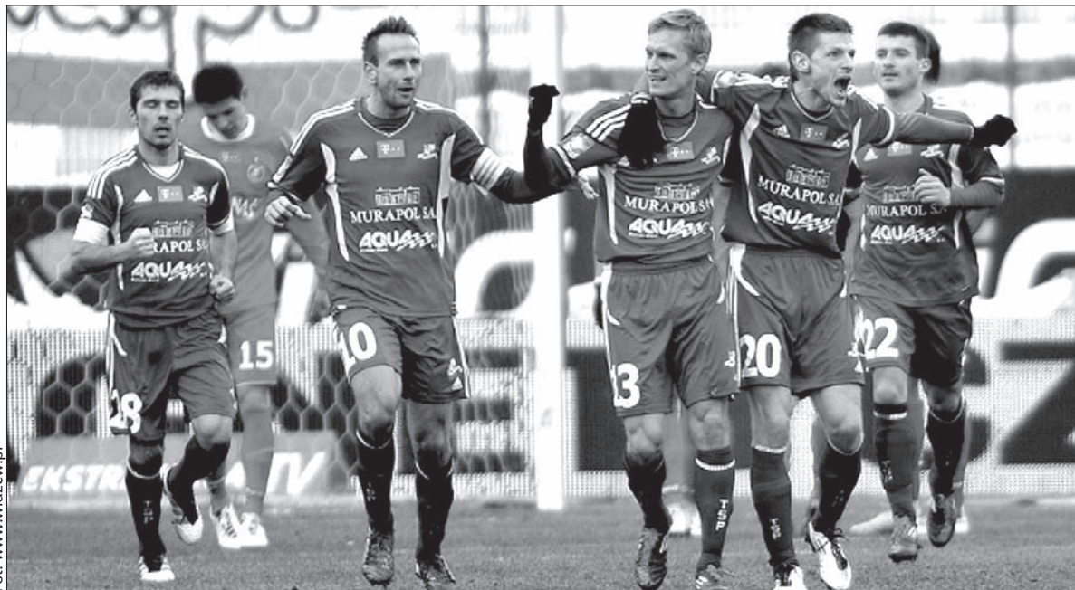
Podbeskidzie pokonało 1:0 Widzew. Tak cieszą się piłkarze po strzeleniu zwycięskiego gola.