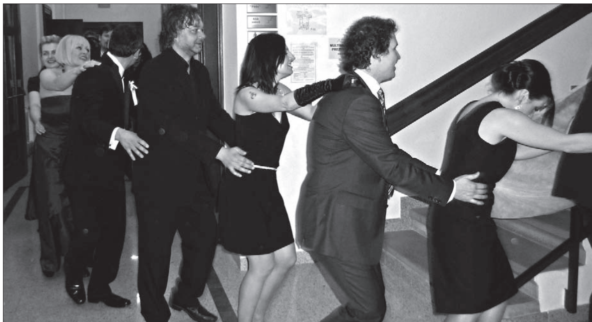
Jedzie pociąg z daleka... Cały budynek „Strzelnicy” został opanowany przez balowiczów.

W ostatni weekend sezonu balowego odbyło się mnóstwo bali ostatkowych, m.in. w Olbrachcicach, Stonawie, Karwinie-Raju, Gródku, Jabłonkowie, Mostach-Szańcach oraz Wędryni. Oprócz tego w Bystrzycy MK PZKO zorganizowało Bal Maskowy, a w Końskiej-Podlesiu bawili się goście na balu MK PZKO oraz Macierzy Przedszkola. Ostatnim balem tegorocznego sezonu był Bal Seniora w wędryńskiej „Czytelni”, który rozpoczął się wczoraj o godz. 15.00.