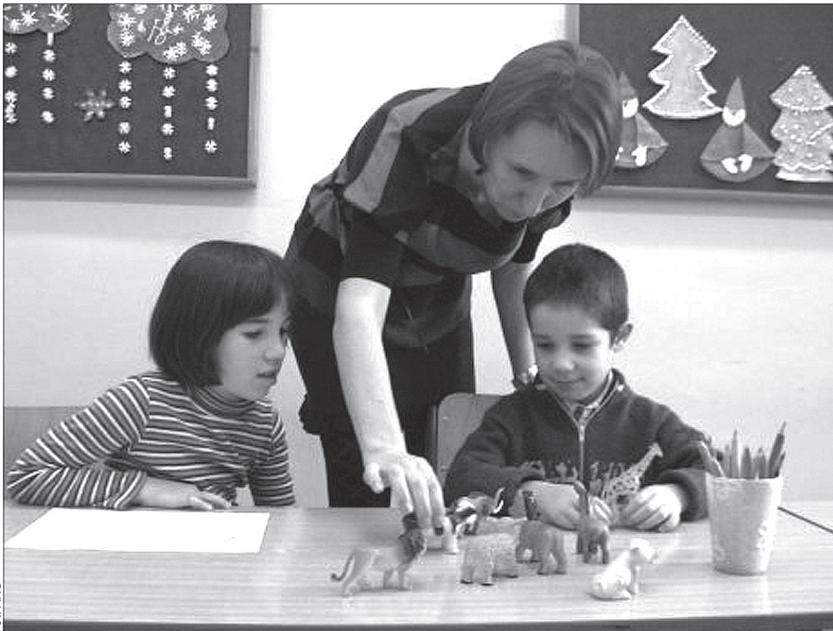
Zapisy w Polskiej Szkole Podstawowej w Wędrynie.