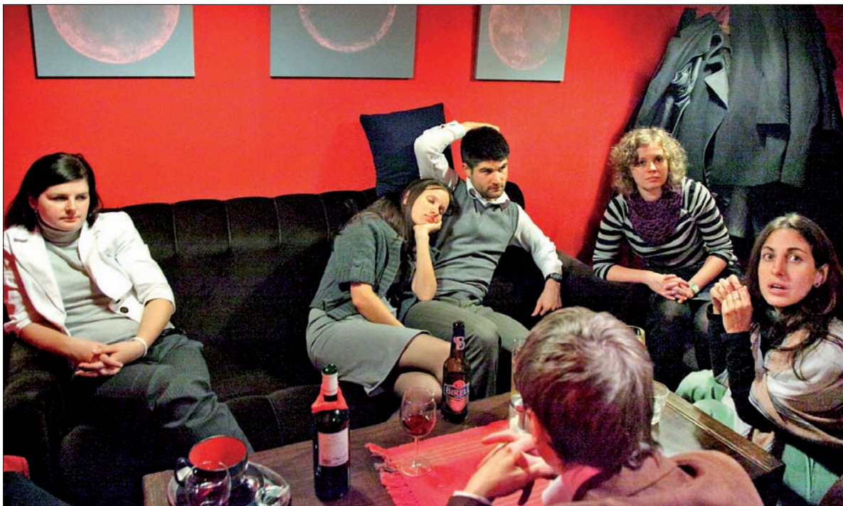
Klub „Dziupla” to jedno z miejsc, które młodzież z Czeskiego Cieszyna z pewnością zaproponuje do Szlaku Młodych Cieszyniaków.