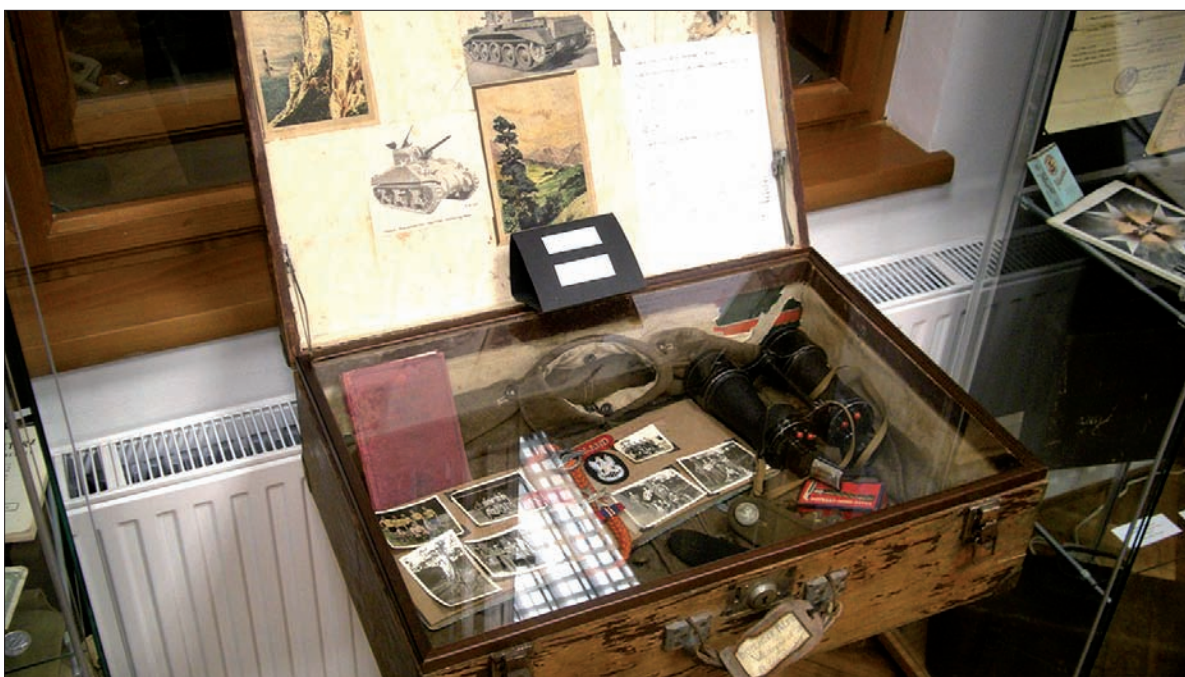
... a także sporo zdjęć, dokumentów związanych z losami Zaolziaków podczas II wojny światowej.