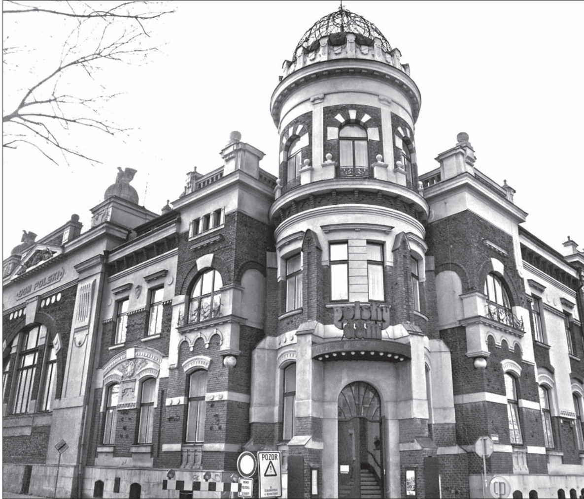
Dom Polski w Ostrawie swego czasu zajmował ważne miejsce w życiu miejscowych Polaków.

Z czasem galicyjscy chłopi i robotnicy włączyli się w nurt życia społeczno-politycznego, gospodarczego i kulturalno-oświatowego. W 1899 roku grupa robotników w Ostrawie założyła Kształcące Stowarzyszenie Robotników. Miało ono swoją siedzibę w Ostrawie, w gospodzie Hohstima przy placu Antoniego, tam też znajdowała się biblioteka