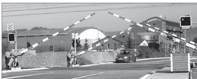
We wtorek sprawdzano, czy szlabany na nowym przejeździe kolejowym działają prawidłowo.

Korki przed szlabanami na niezbyt szerokiej drodze, gdzie dodatkowo zatrzymują się samochody zapatrujące w towar miejscowe sklepy