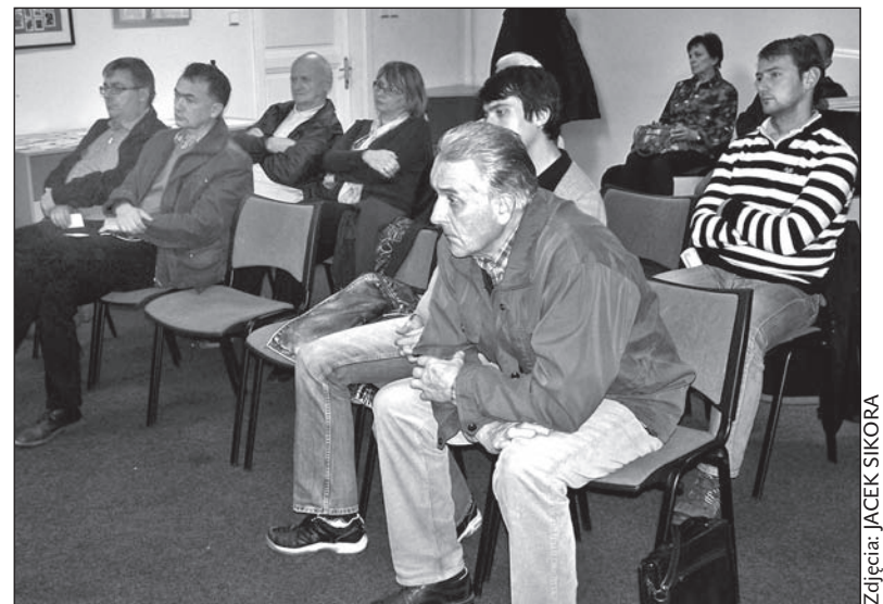
W spotkaniu tradycyjnie wzięli udział przedstawiciele organizacji członkowskich Kongresu Polaków oraz pełnomocnicy gminni.