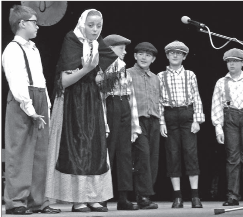
„Gizdy” z Karwiny, jedni z wykonawców koncertu poświęconego Morcinkowi.

Morcinek towarzyszył słuchaczom w czasie całego koncertu i to od razu w dwóch kreacjach. Roli dojrzałego