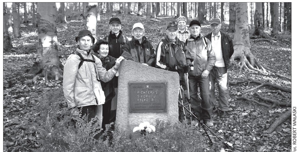
Członkowie „Beskidu Śląskiego” przy pomniku partyzantów na zboczach Kozubowej.

1945 roku. Warto dodać, że kolejna grupa turystów z „Beskidu Śląskiego” w tym samym dniu oddała pamięć partyzantom pod pomnikiem pod Małą Czantorią. (kor)