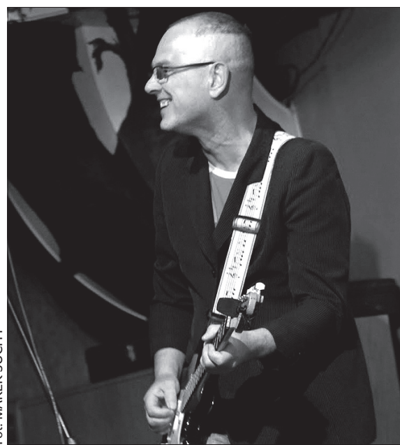
Fot. MAREK SUCHY