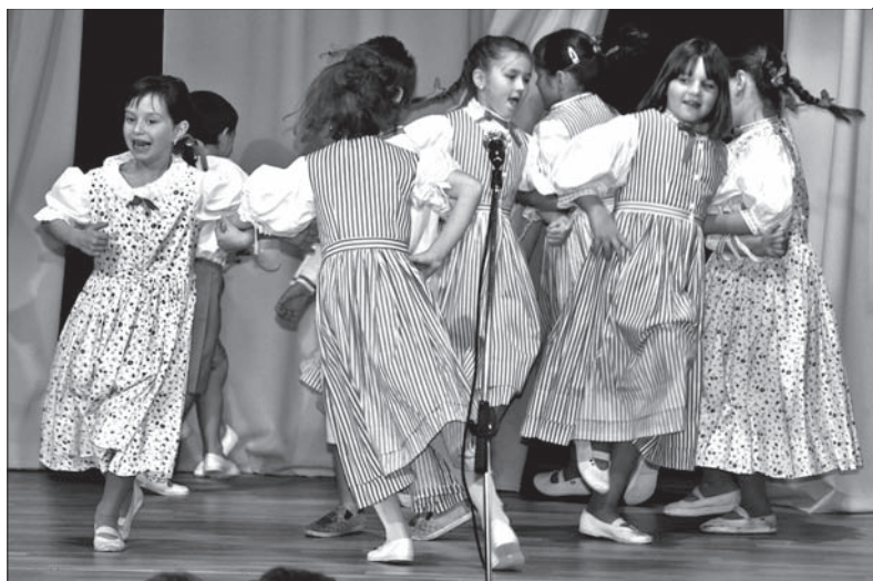
Dzieci z olbrachcickiej szkoły podczas występu.

W sobotnie popołudnie salę Domu PZKO w Olbrachcicach po brzegi wypełnili amatorzy dobrej kuchni, śpiewu i zabawy. W programie kulturalnym wystąpiły dzieci z miejscowej szkoły podstawowej, które zaprezentowały pieśni i zabawy charakterystyczne dla tego regionu. W godzinach wieczornych na scenie pojawił się też zespół wokalny „Olzanki” z miejscowości Olza z Polski. – Przepraszamy za spóźnienie, lecz