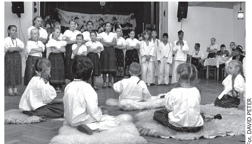
Podczas jubileuszu zespołu „Zaolzi” zaprezentował się także młodszy „Zaolzioczek” z programem „Owieczki”.

„Zaolzi” zadeklowało swój jubileuszowy program byłym tancerzom, przede wszystkim zaś współpracującym przez całe dziesięć lat z zespo-