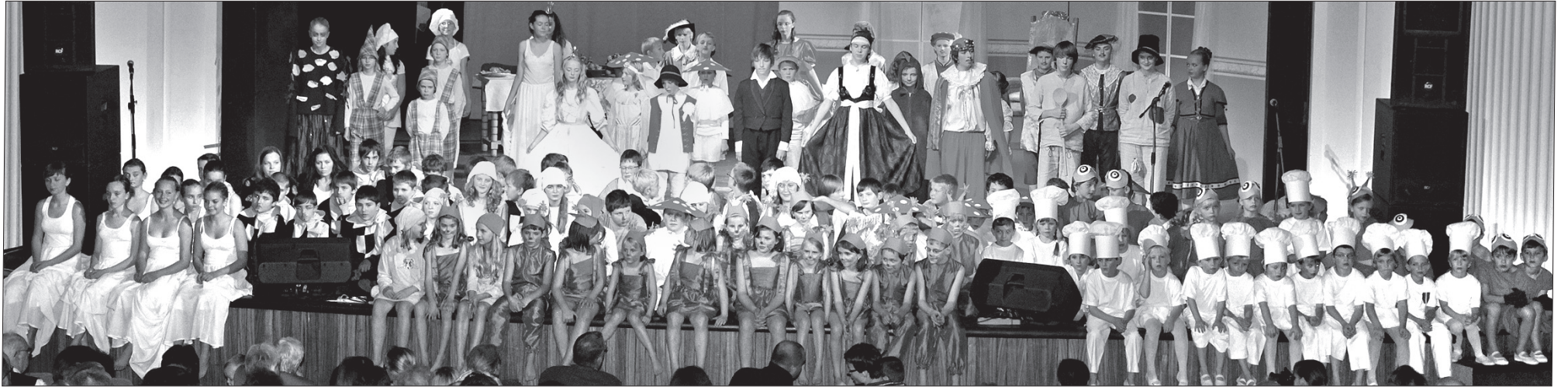
W śpiewogrze „Za siedmioma górami” przedstawili się niemal wszyscy uczniowie szkoły.