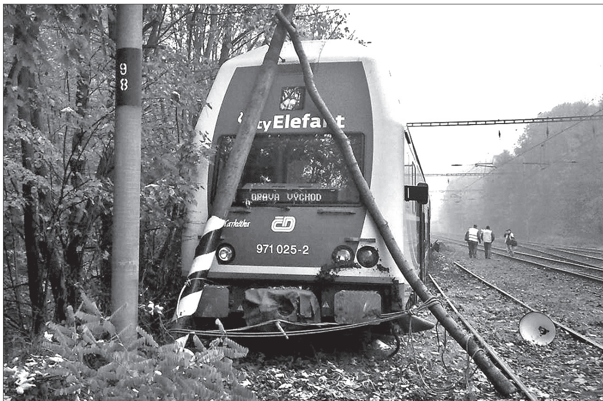
Elefant poza torami.