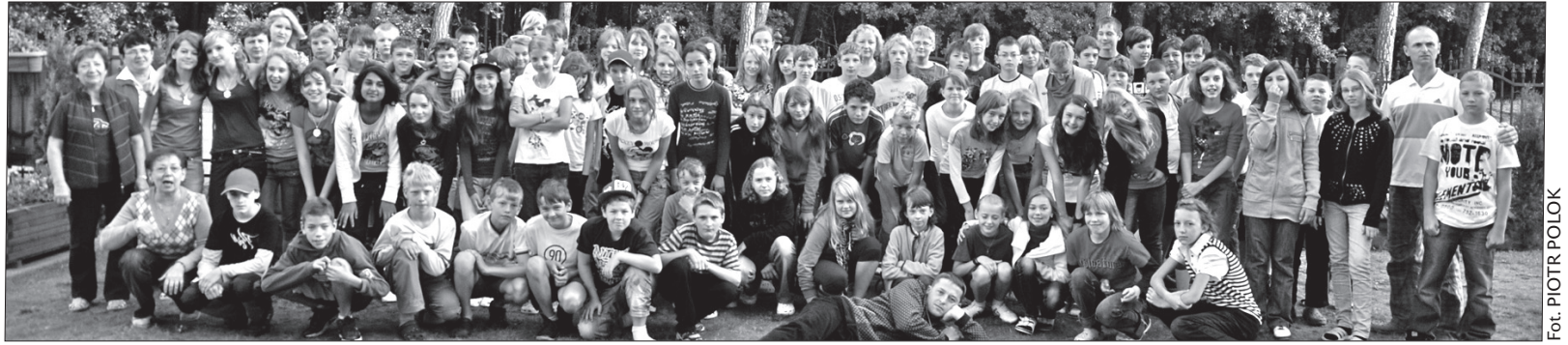
Drugi turnus zielonej szkoły w pełnej krasie...

W trakcie dwutygodniowego pobytu na Kaszubach dzieci poznają krajozaby, kulturę i zwyczaje przynależne nie tylko temu regionowi, ale ogólnie