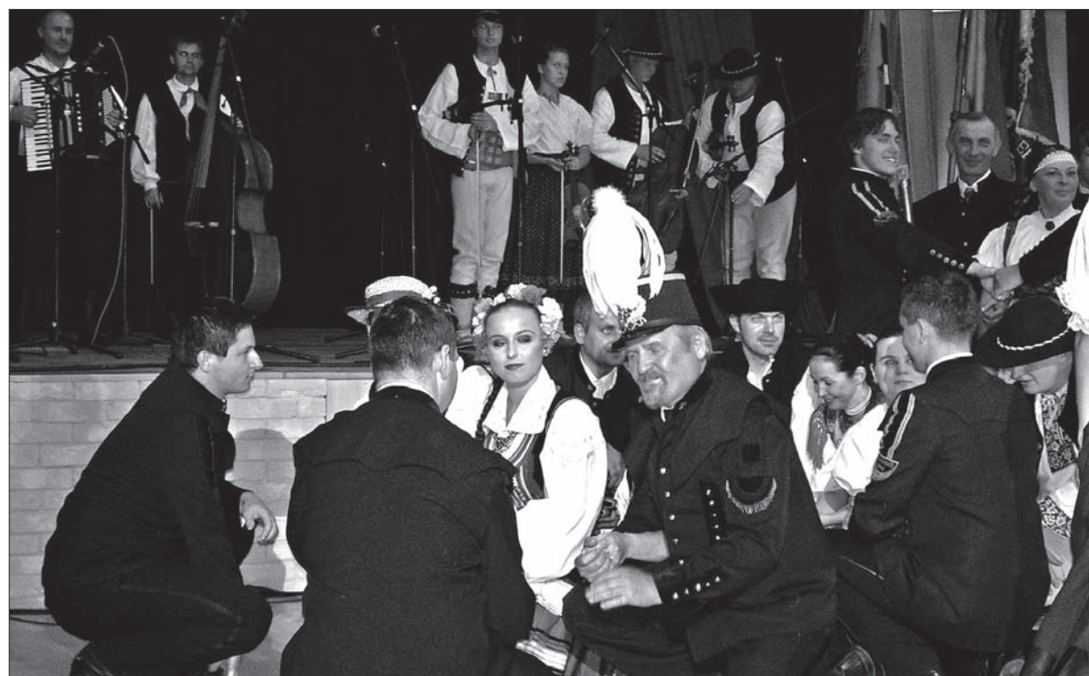
Symboliczna szala, którą zespoły zjadają do kopalni, aby wyfedrować folklor.