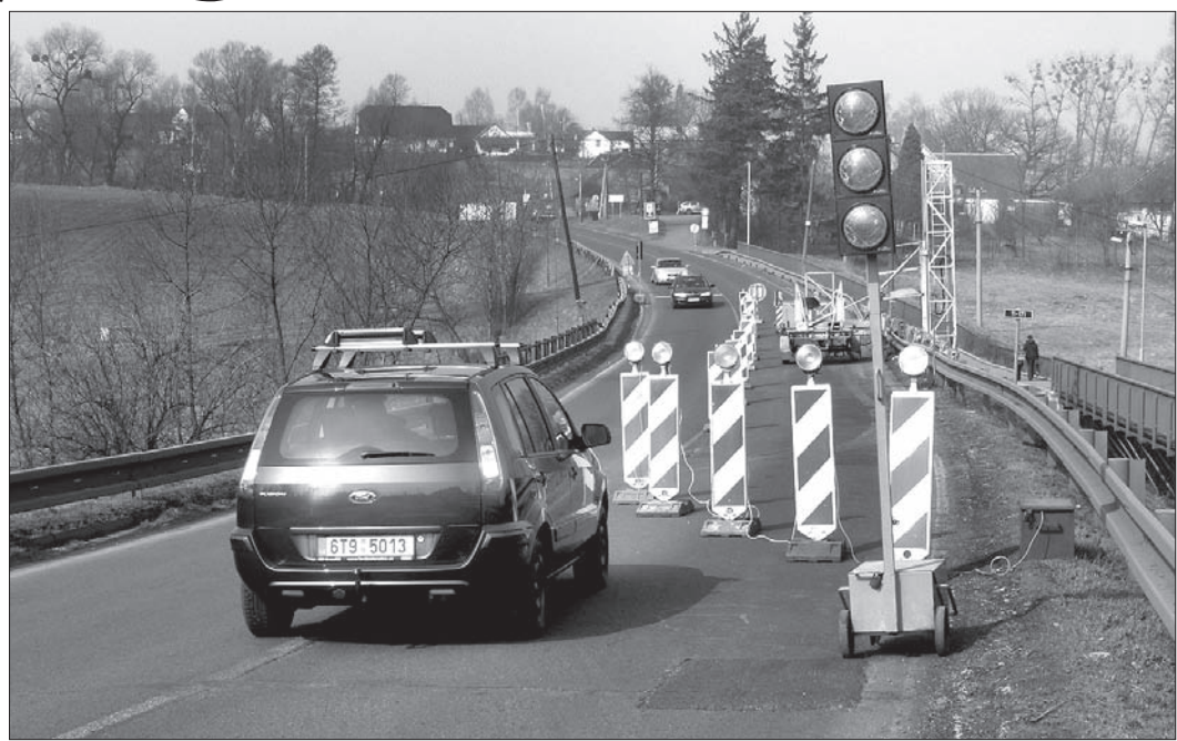
Ruch w Nieborach w pierwszym dniu remontu był płynny.

Zagęścił się natomiast ruch w samym Trzyńcu. Zainstalowano już kamerę internetową na rondzie obok polskiej szkoły, dzięki temu, nim zdecydujemy się jechać samochodem do centrum miasta, możemy sprawdzić aktualną sytuację na rondzie i ul. Cieszyńskiej. Wystarczy, że wejdziemy na stronę Urzędu Miasta – trinecko.cz i otworzymy zakładkę On-line kamera. (dc)