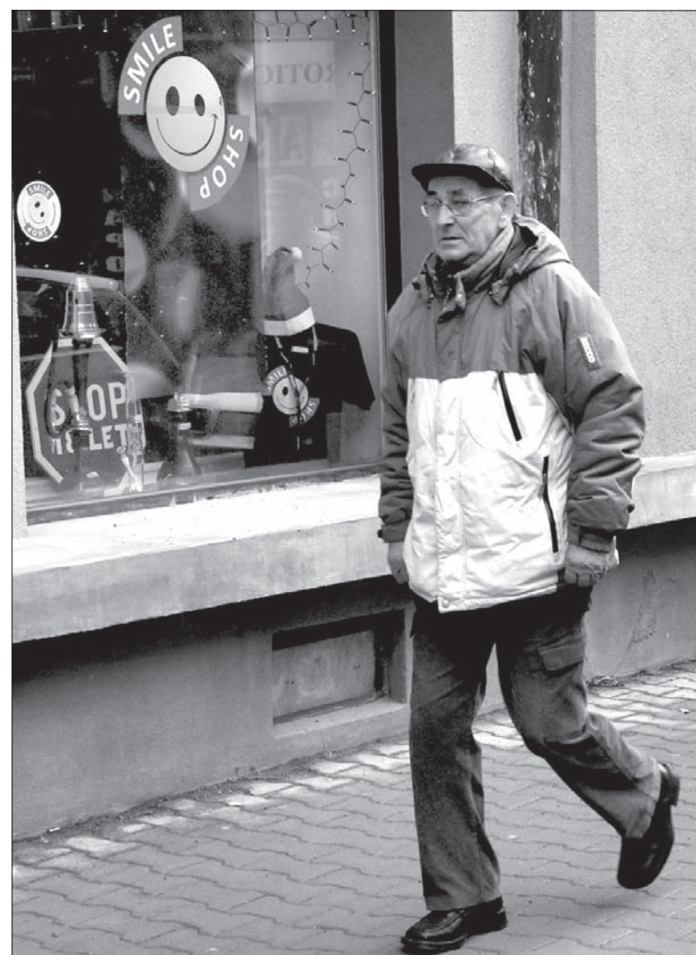
W Czeskim Cieszynie sklepy z dopalaczami rosną jak grzyby po deszczu.

Największy na świecie portret Jana Pawła II rozwieszony zostanie 1 maja. Jego wymiary to 22 na 42 metrów. Projekt Wielki Portret Jana Pawła II powstaje pod patronatem TVP1 i Polskiego Radia oraz we współpracy z wieloma mediami. Dochód z przesłanych SMS-ów zostanie przeznaczony na budowę Muzeum Jana Pawła II i Prymasa Wyszyńskiego, które mieścić będzie się pod kopułą Świątyni Opatrzności Bożej. – Muzeum będzie hołdem dla Jana Pawła II i Prymasa Wyszyńskiego. Stanowiąc wyraz wdzięczności za ich życie i odwagę oraz za duchową, społeczną i polityczną przemianę, jaka dokonała się w naszej Ojczyźnie. Jego celem jest nowoczesna edukacja historyczna, kulturalna i patriotyczna – twierdzi twórca muzeum JP2. (ox, wib)