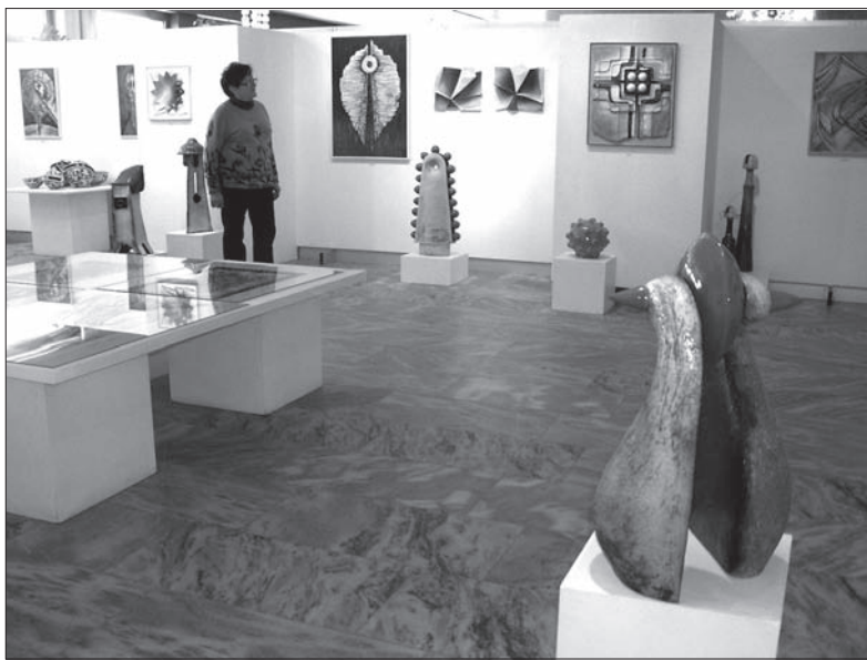
Fragment wystawy z ceramicznymi rzeźbami Jarki Rybowej.

Wystawę oglądać można już tylko do 18 lutego. (o)