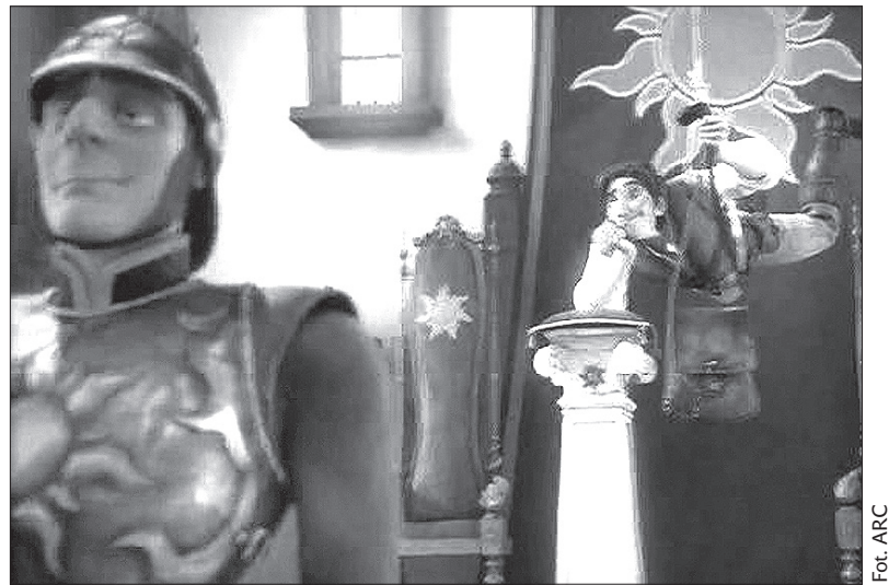
Film „Zaplątani” obiecuje miłą zabawę dla całej rodziny.

W środę 9 lutego w kinie „Pokój” w Jabłonkowie odbędzie się o godz. 17.00 seans nowego amerykańskiego filmu animowanego z wytwórni Walta Disneya pt. „Zaplątani” (po czesku „Na własku”). To komedia muzyczna, która spodoba się całej rodzinie, dlatego nietrudno będzie wam przekonać rodziców, by wybrali się do kina razem z wami. Księżniczka Roszpunka, zamknięta w wieży, marzy o tym, by przeżyć ekscytujące przygody. W tej samej wieży znajdzie schronienie uciekający przed ścigającymi go rozbójnikami uroczy awanturnik Flynn. To właśnie on stanie się dla dziewczynki, której złote włosy mają magiczną moc, przepustką do wolności. (dc)