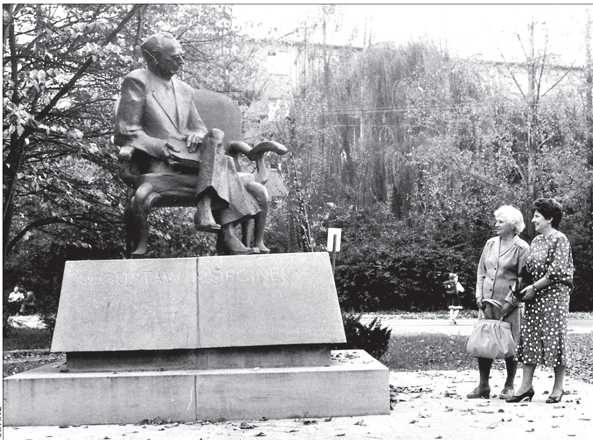
Pomnik Gustawa Morcinka w Skoczowie.