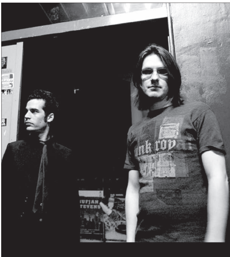
Już w grudniu ubiegłego roku potwierdzono koncert grupy Blackfield. Do Ostrawy powróci więc Steven Wilson (z prawej), który zaważował festiwal w zeszłym roku wraz ze swoim głównym projektem – Porcupine Tree. Drugim liderem Blackfield jest Izraelczyk Aviv Geffen (z lewej).

edycji. – Mam nadzieję, że także inna odsłona Stevensa Wilsona przypadnie słuchaczom festiwalu do gustu – stwierdziła dyrektor Colours of Ostrava. Grupa Blackfield w marcu