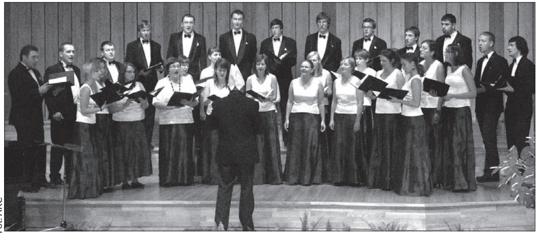
„Canticum Novum” gotuje swoje „Chili con carne” na koncercie laureatów.

– Pragniemy podkreślić coraz większe zainteresowanie festiwalem poprzez liczniejszy udział zespołów, w szczególności zagranicznych. Cieszy fakt coraz większej obecności w programach konkursowych utworów kompozytorów współczesnych polskich i zagranicznych – powiedział w trakcie ogłoszenia wyników przewodniczący jury, prof.