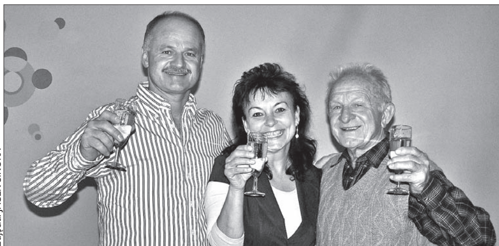
Senator Petr Gawlas z żoną Ewą i ojcem Alojzym.