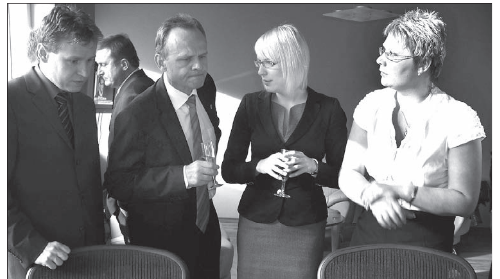
Ostatnie chwile napięcia przed laptopem. Za chwilę będą już znane definitywne wyniki wyborów.

Kiedy idę na autobus, wiatr podrywa z bruku pierwsze zerwane afisze wyborcze. No to po wyborach... JACEK SIKORA