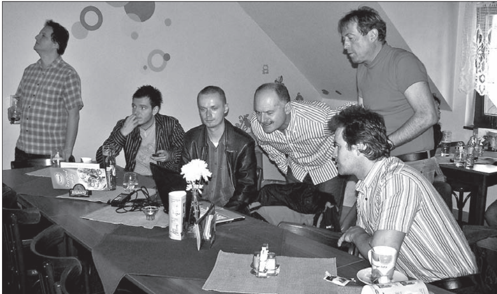
Na razie idzie dobrze!...

W sztabie rozbrzmiewają oklaski. Kierownictwo VV dziękuje swemu kandydatowi, który jako jedyny w całym kraju doznał do drugiej