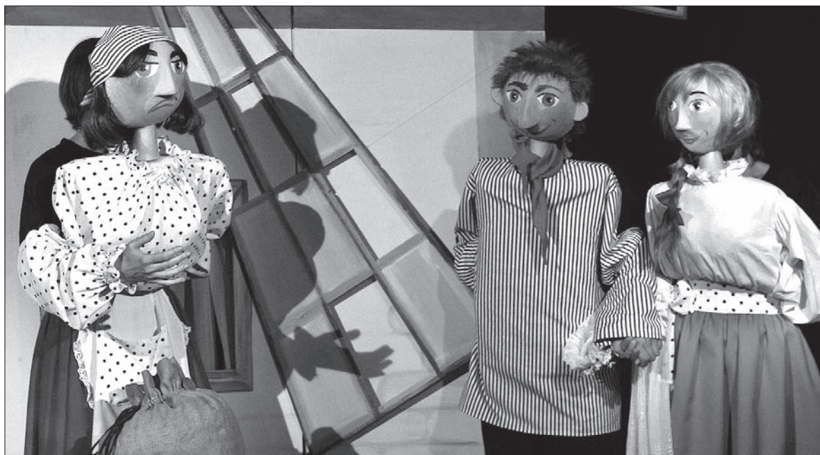
Scena z przedstawienia.