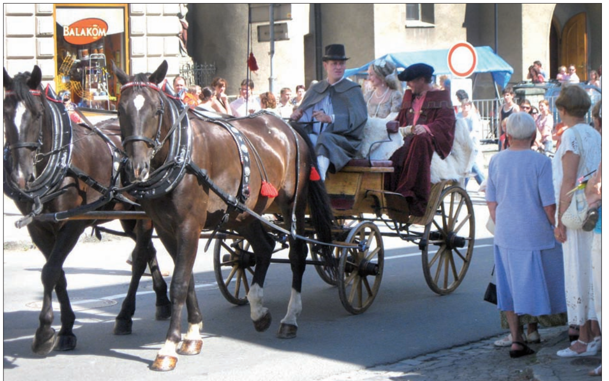
Książę Wacław III Adam wjeżdża na jabłonkowski rynek.