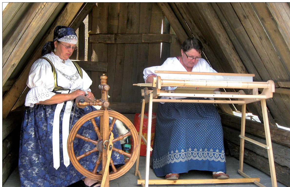
Pokazy tradycyjnych rzemiosł w wykonaniu miejscowych góralek.

Listy motywacyjne i CV należy kierować pod adres: uchadzaci@kronospan.sk , www.kronospan.sk