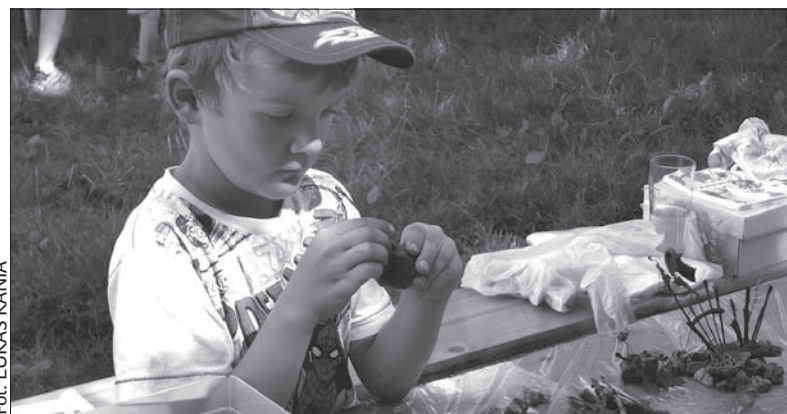
Dziecięcia wyobraźnia nie zna granic.

Wszystkie dzieci mogą np. wziąć udział w konkursie fotograficznym. Aparat można wypożyczyć na miejscu, na małych autorów najciekawszych zdjęć czekają atrakcyjne nagrody. (jb)