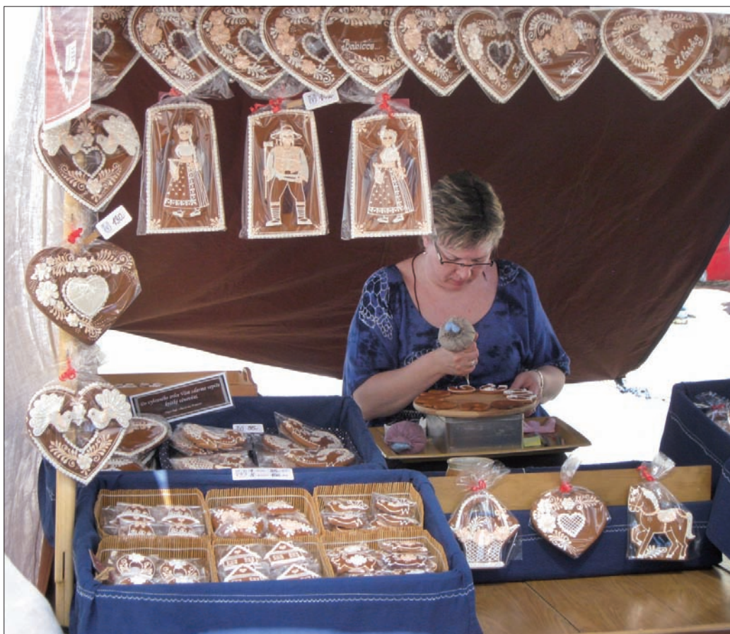
Cuda z piernika powstawały na oczach widzów.