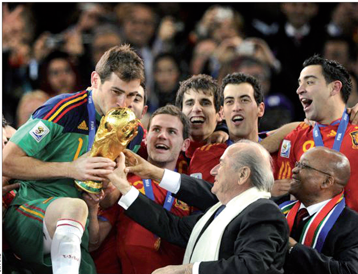
Hiszpanie z pucharem dla mistrza świata.

Nie tylko słynna ośmiornica Paul wyróżyła Hiszpanom złoty medal, pierwszy jakiegokolwiek krążek reprezentacji tego kraju w historii piłkarskich mistrzostw świata. Już przed rozpoczęciem mundialu Hiszpanie byli faworytem numer jeden dla Zbigniewa Bońka. – U Hiszpanów wszystko gra. Od bramkarza do napastnika. Grają na pamięć, mądrze i skutecznie. Potrafią długo utrzymywać się przy piłce tak, jak nikt inny. Mają dwa centra dowodzenia – Iniestę i Xavięgo. Tak to już w życiu bywa: dla jednych wszystko, dla drugich nic – skomentował grę mistrzów świata jeden z najlepszych polskich piłkarzy w historii, były gwiazdor Juventusu Turyn i AS Roma. Legenda polskiej piłki na swoim internetowym blogu trafiła też w innego medalistę, Holandię. Pod wrażeniem gry Hiszpanów byli zresztą wszyscy Polacy, zwłaszcza po drużgócej porażce z kadrą Vi-