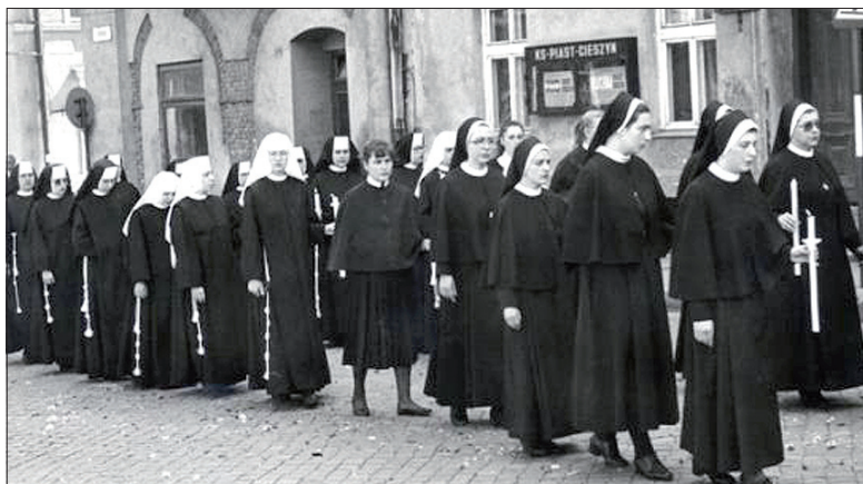
Jedna z prac, którą można oglądać na wystawie.