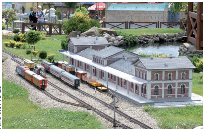
Model dworca kolejowego w Czeskim Cieszynie w Parku Miniatur w Inwałdzie.

Miniatur, coś zaskoczy czy zdziwi podczas wakacyjnych wojaży. Nie zapomnijcie o tym do nas napisać lub przysłać zdjęcia z komentarzem. Bardzo chętnie je w naszej rubryce opublikujemy. Na autora najciekawszego listu z wakacji i najbardziej udanego zdjęcia będą we wrześniu czekały nagrody. (dc)