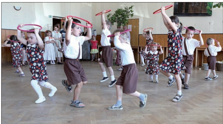
Występują dzieci z polskiego przedszkola w Olbrachcicach.