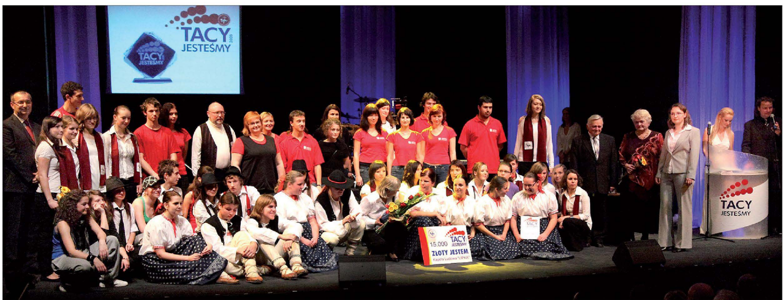
Województwo tradycyjnie wspiera finansowo imprezę „Tacy jesteśmy”, organizowaną przez Kongres Polaków w RC.

Kongres Polaków otrzymał po 70 tys. koron na dwa projekty – „Tacy jesteśmy” i prowadzenie Ośrodka Dokumentacyjnego, Zarząd Główny Polskiego Związku Kulturalno-Oświatowego 70 tys. na 5. Dzień Tradycji i Stroju Regionalnego oraz 56 tys. na wykłady Międzygeneracyjnego Uniwersytetu Regionalnego. 70 tys. koron województwo przyznało również Miejscowemu Kołu PZKO w Hawierzowie-Błędowicach na 41. Dożynki Śląskie. Z kolei Stowarzyszenie Przyjaciół Polskiej Książki otrzyma na projekt „Z książką na walizkach 2010” dotację w wysokości