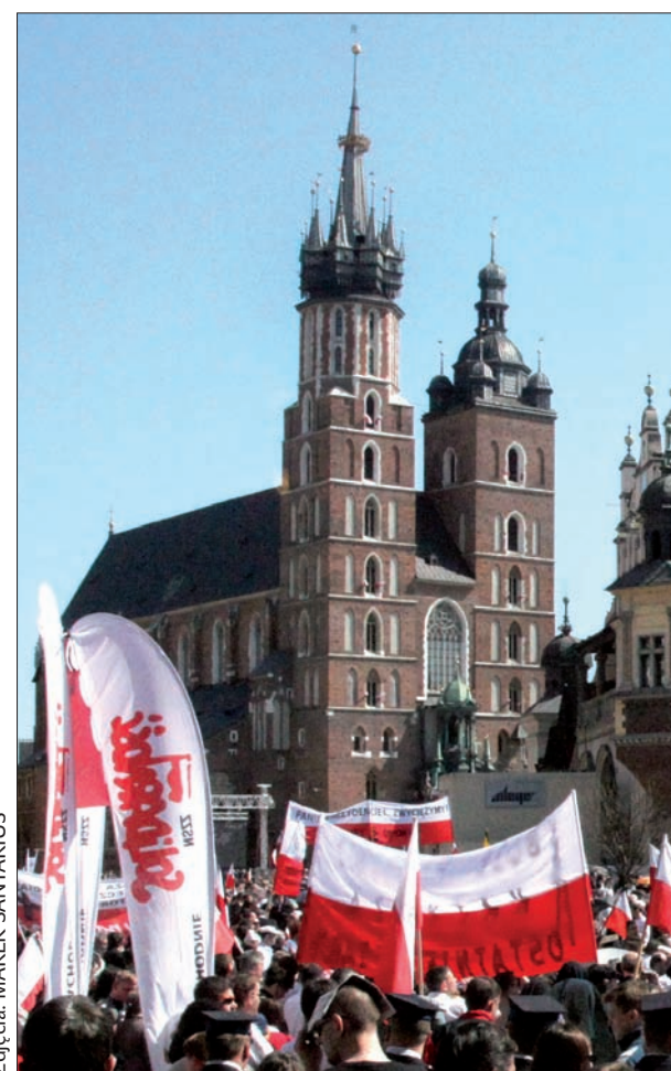
Bazylika Mariacka tonęła we flagach narodowych i transparentach „Solidarność”.