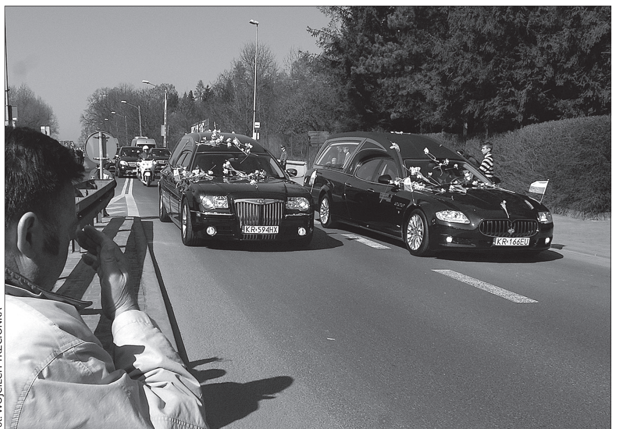
Przy trasie przejazdu konduktu modliło się wiele osób.

W Krakowie byli też górale z Trójwsi Beskidzkiej. Do stolicy Ma-