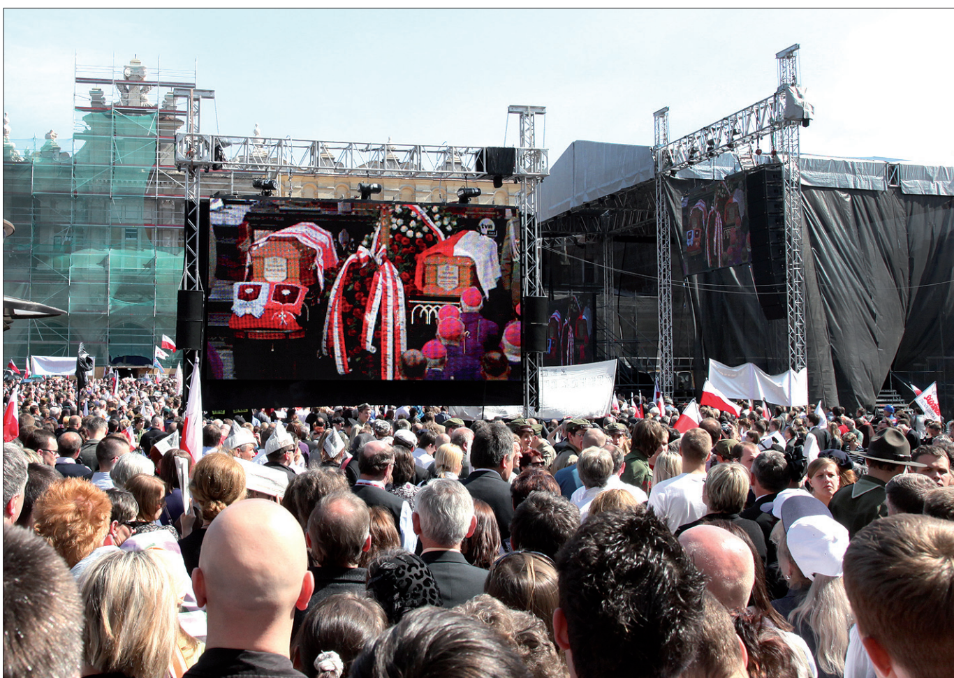
Dla osób, które nie dostały się do strefy czerwonej (najbliżej Bazyliki Mariackiej), przygotowane były olbrzymie telebimy. Ten stał przed Sukienicami na głównym rynku.