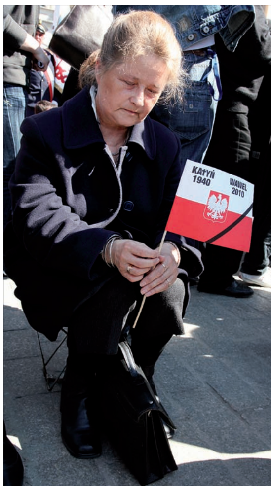
Zaduma i refleksja widoczne były na każdym kroku.