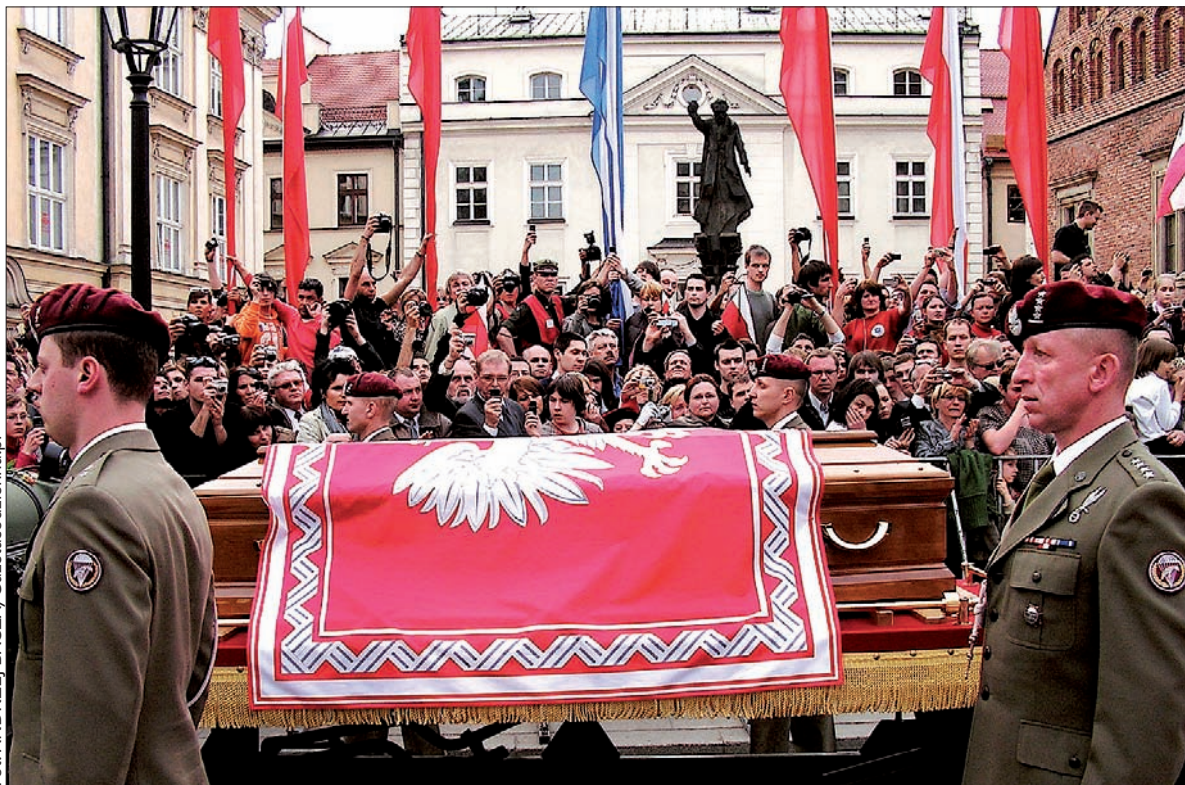
Na trasie przejazdu konduktu żałobnego w Krakowie ustawiły się tłumy ludzi.