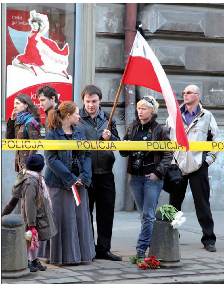
W oczekiwaniu na kondukt żałobny.