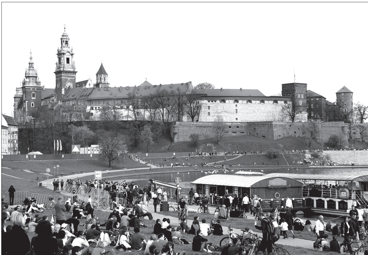
Wawel był w niedzielę niedostępny dla zwykłych śmiertelników.

Niedostępne dla zwykłych śmiertelników jest także Wzgórze Wawelskie. Tam wpuszczane są tylko oficjalne delegacje państwowe i oczywiście najbliżsi Lecha Kaczyńskiego i jego żony. Ze względów bezpieczeństwa krakowski Rynek udostępniono tylko dla 40 tys. osób. Określenie „tylko” nie oddaje jednak w pełni atmosfery, jaka panuje w samym centrum królewskiego miasta podczas ceremonii pogrzebowej. Tłok jest ogromny, niemniej jednak z każdego miejsca dobrze, a nawet świetnie można przebieg uroczystości żałobnej oglądać na telebimach. We znaki coraz mocniej daje się