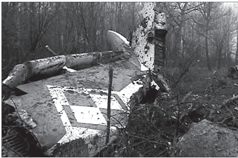
Samolot rozbił się w sobotę 10 kwietnia o godz. 8.56 w czasie podejścia do lądowania w trudnych warunkach pogodowych, kilkaset metrów od pasa startowego.

Samolot wojskowy, który transportował ze Smoleńska trumnę z ciałem prezydenta, wylądował na lotnisku wojskowym na warszawskim Okęciu o godz. 15.04. Trumna przykryta białą-czerwoną flagą została wyprowadzona z samolotu przez żołnierzy z kompanii honorowej Wojska Polskiego i umieszczona na kata-