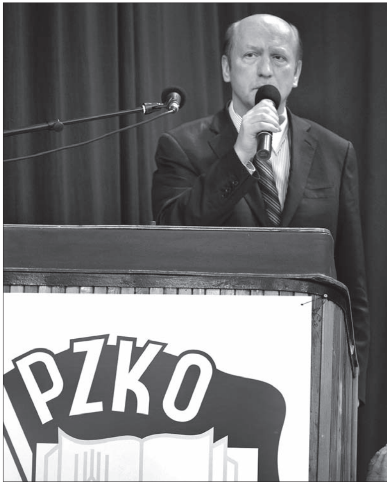
Maciej Płażyński na ostatnim Zjeździe PZKO.

Marszałka Macieja Płażyńskiego, prezesa Stowarzyszenia „Wspólnota Polska”, gościliśmy w ostatnich miesiącach na Zaolziu dwa razy. W grudniu ubiegłego roku wziął udział w XXI Zjeździe PZKO w Suchoj Górnej. W wywiadzie dla „Głosu Ludu” podkreślał, że „Wspólnota Polska” nadal będzie wspomagać Polaków w RC. – Tylko w 2009 roku popłynął na Zaolzie milion złotych na remonty kilku domów PZKO. W przyszłym roku będzie to na pewno kolejne kilkaset tysięcy. Między in-