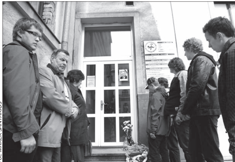
Delegacja Gimnazjum Polskiego złożyła kwiaty i zapaliła znicz przy wejściu do siedziby Kongresu Polaków w RC.

Kącik ze zdjęciami, białymi i czerwonymi goździkami i płonącym zniczkiem pojawił się również w polskiej szkole w Suchoj Górnej. (dc)