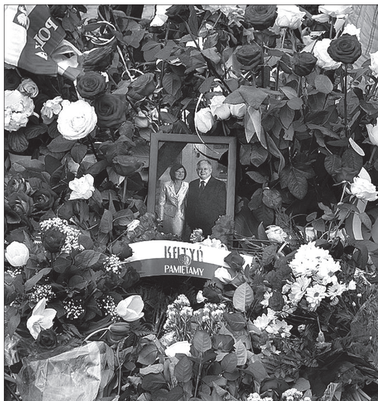
Kwiaty pod Pałacem Prezydenckim w Warszawie.

Czuję wielki smutek i żal. Polecamy Bogu modlitwę za dusze zmarłych. Choć zdajemy sobie sprawę z tego, że żyjemy w świecie materialnym, i natura, i materia, mają swoje prawa. Czasem nieświadomy brak respektu wobec tych zjawisk, albo niechciany, może spowodować tak wielkie nieszczęście, że ten samolot zamiast bezpiecznie wylądować – runął. To jest ten wymiar normalny, codzienny. Jest jeszcze coś takiego, jak wymiar naszego serca – żebyśmy się poczuli otwarci na to wydarzenie, na Boga. Już widać ożywienie, otwarcie umysłów i serc na jedność. Oby to trwało jak najdłużej, rozwijało się i prowadziło nas dobrymi drogami. (wot, dc, kor)