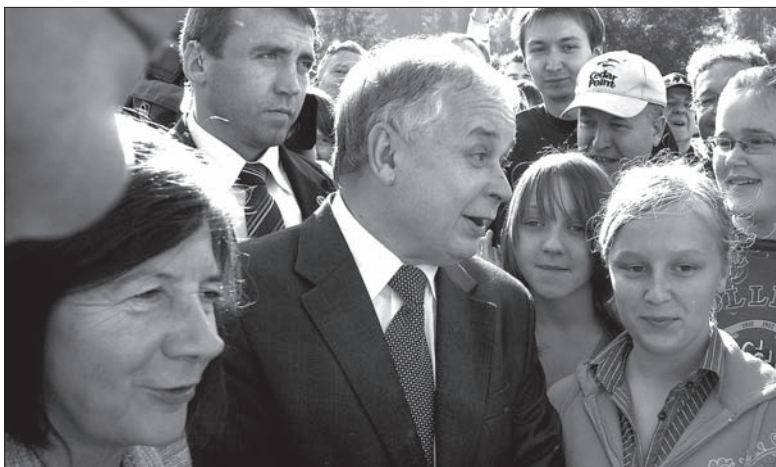
Maria i Lech Kaczyńscy podczas jednej z wizyt w Wiśle.

gdańskiego. 18 listopada 2002 roku został wybrany na prezydenta miasta stołecznego Warszawy, a 1 sierpnia 2004 roku, w 60. rocznicę wybuchu