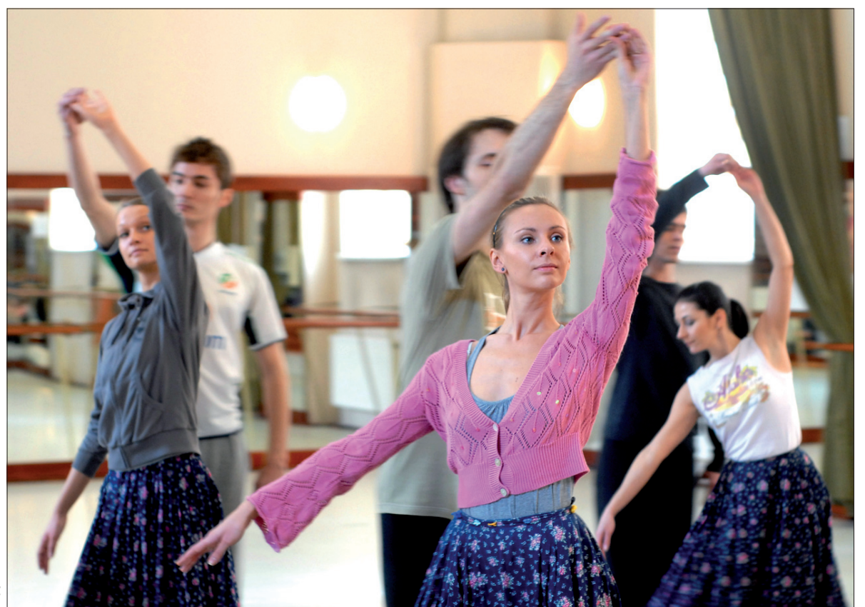
Próba baletu w nowej sali. Zespół tworzy aż 180 artystów.