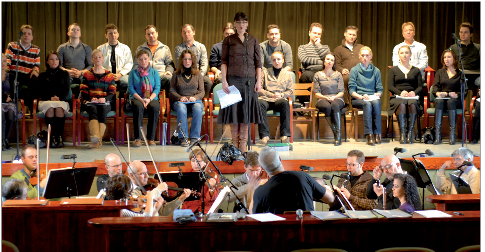
Sala widowiskowa – kiedyś była tu ujeżdżalnia koni.

Renowacja kompleksu pałacowo-parkowego dotyczyła głównie trzech jego części. Remont i modernizacja lewego skrzydła pałacu zakładały powstanie pomieszczeń dydaktyczno-szkoleniowych oraz reprezentacyjnych sal pałacowych. Sale Zielona, Kominkowa i Chóralna odzyskały dawny blask. Odnowione