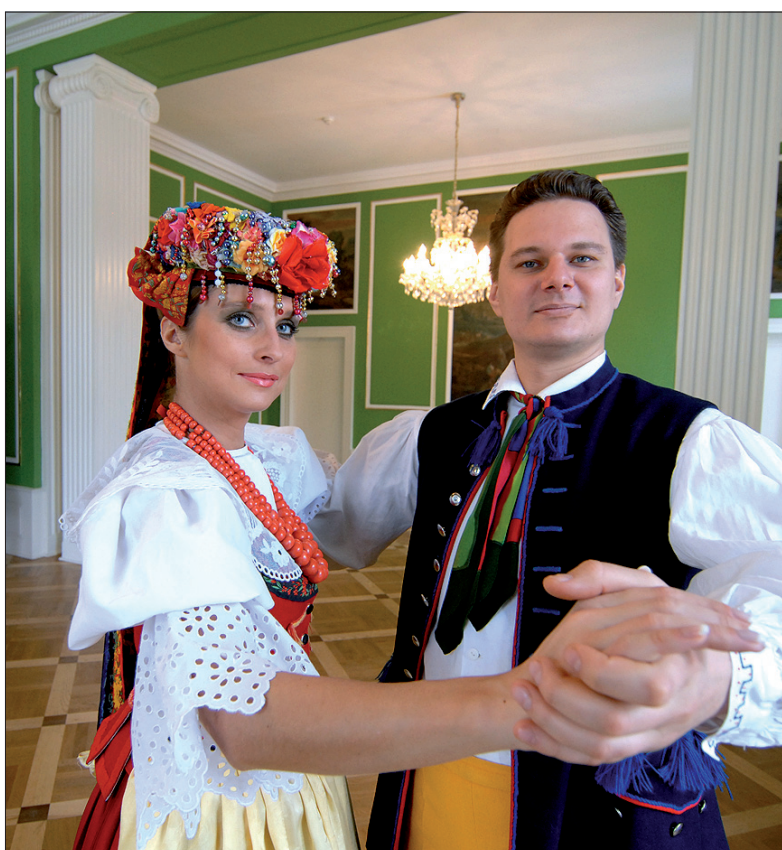
Wnętrze Sali Zielonej zdobió odrestaurowane malowidła ścienne.