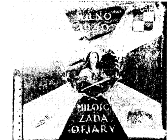
Standard Lotnictwa Polskiego

Wielcy przetrzylnicy, nosili krykoniem „Adler” (orzeł), drugi „Sea Eagle” (lew morski). W walkach tych wzięło udział... (tekst z tytułu)