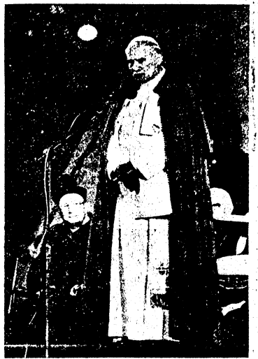
Jan Paweł II przemawia w trakcie spotkania z rodziną kanadyjską, na stadionie CNE w Toronto

WINNIPEG — Dla społeczności ukraińskiej z Toronto trasa papieskiej pielgrzymki prowadziła do Winnipeg, gdzie w niedzielę przy obchodzie 150-lecia niepodległości państwa ukraińskiego w parku na jeziorku królewskim na Ukrainian Road w Fort Simpson, Jan Paweł II odprawił Mszę św. dla około 200 tys. wiernych. Tematem wiązującym wizyty w tym regionie było: wiara i kultura w wielokulturowym społeczeństwie. Nawigował on do „kultury” i „kultury” w tym celu politycznym jego balancem, iż na tym terenie działała ję 3 archidiecezje: angielska z Winnipeg, francuska z Winnipeg, a także polska z Winnipeg. Jan Paweł II odwiedził także miasto Fort Simpson, które zamieszkuje około 1000 osób.