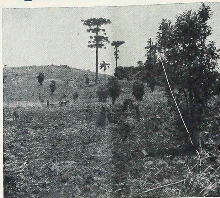
O desmatamento tem causado sérias modificações no clima.

De início, o homem era dominado pela natureza. Com suas forças incontroladas, ela limitava os espaços de liberdade do homem primitivo. O homem tinha medo das forças naturais, criou mitos e invocava deuses para dominá-las. Levou alguns milhares de anos para se atingir uma primeira situação de equilíbrio entre o homem e a natureza. A natureza, desmitizada pelo cristianismo, dos ídolos com que o paganismo a povoara, é restituída, na sua autenticidade profana, à liberdade do homem. Mas o homem só dispunha de recursos artesanais de produção e só conhecia energias inocentes: a tração animal, a força dos ventos e dos cursos d'água. A humanidade ainda rarefeita consegue viver do planeta sem destruí-lo. Poucos séculos porém bastaram para que o homem invertesse a situação inicial. Da condição de dominado pela natureza, ele passou à condição de dominador. Dispondo já de novas formas de energia: a vapor, elétrica, nuclear, ele começa a perigosa escalada da exploração da terra, na suposição ingênua de que os recursos dela eram praticamente inesgotáveis. Foram necessárias apenas algumas décadas, para que se chegasse à situação atual: o domínio na natureza se transforma em risco de destruição da natureza. O homem tem hoje o poder sinistro de destruir o lar que Deus preparara para seus filhos e cuja preservação lhe confiara. O alarme foi dado quando se percebeu que esse lar maravilhoso subsistia por um admi-