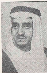
KROL KHALED — władca Arabii Saudyjskiej, rządzi krajem mądrze i roztropnie. Trudno jednak przewidzieć, jak długo potrwą jego panowanie.

Z powyżej wymienionych władców najbogatszym jest szach Iranu. Po jego stracie, który sumy złożone w bankach zachodnich ocenia się na 20 miliardów dolarów, nie mówiąc o ogromnym majątku skonfiskowanym przez nowy rząd w tym kraju. Tini były król Grecji, który nie należał do jednej z najstarszych monarchii w świecie.