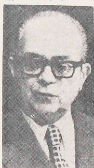
Kanclerz AZEREDO DA SILVA, szef Itamarati, ma ręce pełne roboty, by przygotować przyjęcie dla zagranicznych gości, którzy wezmą udział w objęciu władzy przez prezydenta João Baptista Figueiredo.

Objęcie władzy przez nowego prezydenta João Baptista Figueiredo dnia 15 marca bieżącego roku zmobilizowało Ministerstwo Spraw Zagranicznych (Itamarati), by jak najszybciej przyjąć licznych gości zagranicznych na ten historyczny akt. Zgromadzone już największych znawców podobnych ceremonii, oraz tłumaczy mówiących różnymi językami.