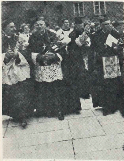
O Papa João Paulo II, quando ainda Cardeal "Karol Wojtyła", por vários anos participou das festividades em honra de Sto. Estanislau, na cidade de Cracóvia.

O governo de Varsóvia aprovou, depois de ouvir o de Moscou, os planos para uma visita do Papa João Paulo II à Polónia em junho próximo, nos dias 2 a 10.