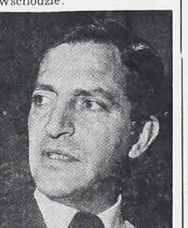
ADOLFO SUARES, premier hiszpański, pragnie skłonić do wstąpienia do NATO, lecz ma na razie rezerwy związane, ponieważ wielu sprzeciwia się socjalistom i komunistom, którzy razem liczą 38 proc. wyborców. Wprawdzie partia Suareza (Zjednoczone Centrum Demokratyczne) zwyciężyła w ostatnich wyborach do parlamentu (1 marca br.) lecz posiada małą stosunkowo większość w parlamencie, stąd musi się liczyć z opozycją.

Organizacja Paktu Atlantyckiego (NATO) pragnie przyjąć z otwartymi rękoma Hiszpanię jako swego członka. Tymczasem kraj ten od czasu gdy stał się demokracją, nie sprzyjał temu wstąpieniu do tego Traktatu. Dawniej za rządów gen. Franco Hiszpania starała się o przystąpienie do NATO, lecz kilka państw — członków wypowiedziało stanowczy sprzeciw. Skąd się wzięła ta wielka zmiana w stanowisku Portugalii?