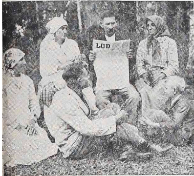
A leitura do Jornal "LUD" sempre foi parte integrante da vida dos imigrantes poloneses.

Infelizmente, o Governo nem sempre cumprira (Murici Nossa Terra, pág. 29) as normas e cláusulas referentes à construção da escola nas colônias estabelecidas. Os colonos, então, não querendo que os filhos crescessem analfabetos ou "bugres", viram-se obrigados a resolver o crucial problema por própria conta. Destarte, quase a totalidade das escolas polonesas no Brasil surgiu por iniciativa e com recursos do próprio povo migrante. Junto com elas nasceram também as Sociedades, edifícios de vários compartimentos tão próprios senão indispensáveis para outros fins sócio-culturais. Mormente, para angariar o necessário à manutenção do Professor que, obviamente devia ser pago também pelo Povo, e para administrar os adequados melhoramentos à agricultura e demais setores colaterais, sem exclusão dos merecidos lazeres.