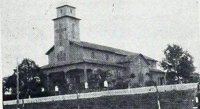
A Igreja dedicada ao Imaculado Coração de Maria, atual Matriz, onde foi realizada a última etapa das Santas Missões.