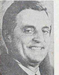
WALTER MONDALE, wiceprezydent USA, złożył wizytę w Brazylii w dniach 21 i 22 marca br.

Je Itamarati, stwierdzając, że stosunki między Brazylią i Ameryką są przyjazne lecz chłodne. Jakkolwiek USA są największym eksporterem i importerem Brazylii, a inwestycje amerykańskie w Brazylii wynoszą 3,6 miliardów dolarów, Ameryka musi zrozumieć, że ona nie jest