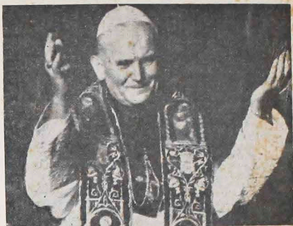
Objawienie Encykliki "REDEMPTOR HOMINIS" przez Papieża Jana Pawła II przyjęte zostało z wielkim uznaniem na Zachodzie. Natomiast prasa państwa socjalistycznych skrytykowała niektóre jej części zwłaszcza odnoszące się do wolności religii i do uprzywilejowanej pozycji ateizmu, jedynie małą część prawdy obywatelskiej. Popularny dziennik w Polsce "Zgoda Warszawa" skomentował pozytywnie i we wprowadzeniu Papieża w których pociąg on stylizacja formy imperializmu oraz obecny konsumpcyjny umysł życia.

Papież Jan Paweł II w 4 miesiące po objęciu stanowiska głowy Kościoła katolickiego, ogłosił dnia 15 marca br. Encyklikę pod tytułem "Redemptor Hominis" (Zbawiciel Człowieka). W Encyklice tej Ojciec św. zawarł najważniejszy program swego urzędowania. Papież napisał ją w języku polskim, poczym Encyklika, przetłumaczona została na język łaciski, angielski, francuski i włoski.