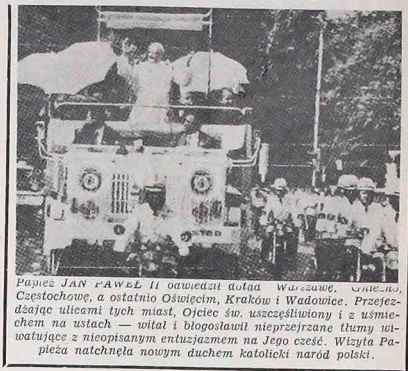
Papież Jan Paweł II odwiedził dotąd Warszawę, Gniezno, Częstochowę, a ostatnio Oświęcim, Kraków i Wadowice. Prezydentów uścił miast, Ojciec św. uszczęśliwił i z uśmiechem na ustach — uśmieł i błogosławił nieprzebrane tłumy wiwatujące z napisanym entuzjazmem na jego cześć. Wycieczka Papieża natchnęła nowym duchem katolicki naród polski.

Podczas swej wizyty w Polsce Jan Paweł II wygłosił już ponad 300 przemówień, których wysłuchało kilka milionów Polaków. Papież wykonał przy tym, że jest doskonałym mówcą. Silny i przyjemny głos, świetna dyktacja i gesty godne znakomitego aktora a w dodatku poruszane tematy interesujące wszystkich - sprawiają, że miliony słuchaczy nie mogło oderwać od Niego wzroku.