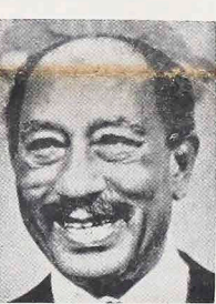
Prezydent SADAT, zawierając traktat pokojowy z Izraelem, odizolował Egipt od innych państw arabskich, naraził swój kraj na ich ostre sankcje ekonomiczne i polityczne. Egipt jednak nie miał innego wyjścia by skłonić z ustanowieniem ogólnemu wojskowym swej liczącej armii i nie narzucając kraj na krach ekonomiczny i finansowy.

Prezydent Sadat, podpisawszy traktat pokojowy z Izraelem, naraził swój kraj na odwet ze strony prawie wszystkich państw arabskich, które nazwały go zdradca sprawy Palestyńczyków. Wykreślono Egipt z Ligii Arabskiej i usiedli mu dookoła nady, zerwano stosunki dyplomatyczne, a także powzięto przeciw niemu sankcje ekonomiczne. W konsekwencji Egipt pozostał sam.