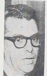
JARBAS PASSARINHO, były minister Wychowania za rządów p. Geisela a obecnie lider ARENY w Senacie, opowiedział się za rozwiązaniem obecnym partii ARENY i MDB, co może nastąpić jedynie w wypadku, gdyby taki projekt rząd zatwierdził został przez Kongres.

W rezultacie — rozwiązanie dwóch partii stoi na razie pod znakiem zapytania, jak również przeniesienie wyborów municypalnych na 1982 r.