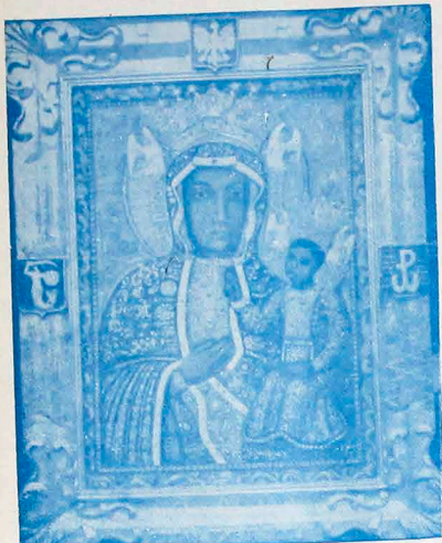
Nossa Senhora de Czestochowa, a Padroeira da Polônia, a quem João Paulo II tributa especial devoção.