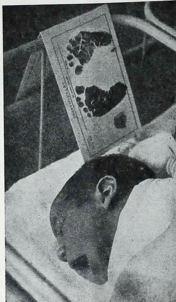
Tirar a vida de um ser humano indefeso é um crime bárbaro. Por que matar se se pode dar a vida?

na leva ao abuso. A gravidez resultante de um estupro ou de uma menor de idade leva a praticar o aborto. São relativamente poucos os casos de aborto por problemas genéticos. Se a prática do aborto é um atentado contra a vida, que sentido terá então a vida para quem escrupulosamente assassina crianças inocentes? (CIC).