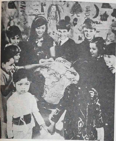
Todas as crianças são nossas — as asiáticas, africanas, européias e também as americanas.