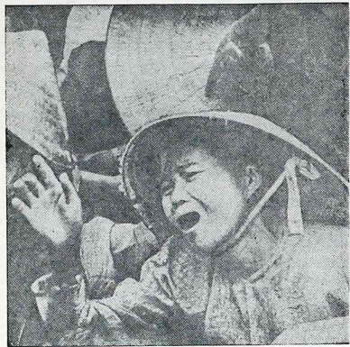
Agora, com os indícios de liberdade religiosa dada pelo novo governo, o povo chinês não ficará mais privado da Evangelização.

"A luz do pensamento de Mao Tsé-tung iluminará para sempre o caminho do povo chinês rumo ao progresso". Esta foi a declaração oficial quando morreu Mao Tsé-tung no dia 9 de setembro de 1976. Hoje, porém, três anos mais tarde, a realidade é completamente outra. O mito Mao Tsé-tung quase desapareceu. Houve profundas mudanças políticas, sociais e religiosas. A Igreja reprimida há 60 anos, quando aconte-