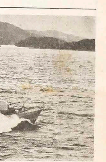
Spór między Argentyną i Chile, do kogo ma należeć Kanał Beagle, nie został dotąd rozwiązany. Na zdjęciu argentyńska motorówka — ścigająca na wodach tego kanału w głębokim kontrze trzy amerykańskie torpedowce.

Rakiety Cruise mogą być wystrzelone z ziemi, z morza i z powietrza. Amerykański samolot bojowy Boeing 727 zdolny jest przewieźć od 40 do 60 rakiet Cruise i wystrzelić je w odległości 200 km od granicy nieprzyjaćielskiej. Inny bombowiec typu Hercules może uczynić to samo co