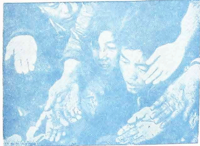
O ano de 1979 será o Ano Internacional da Criança.

Considerando que os povos das Nações Unidas, na Declaração Universal dos Direitos Humanos, proclamaram que todo homem tem capacidade de gozar