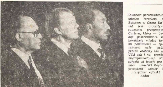
Zawarcie porozumienia między Izraelem a Egiptem w Camp David. Jest osobistym sukcesem prezydenta Cartera, który — będąc pośrednikiem w konflikcie między tymi państwami — ryzykował cały swój prestiż osobisty tak w USA jak i na arenie międzynarodowej. Na zdjęciu od lewej: premier izraelski Begin, prezydent Carter i prezydent egipski Sadat.

Trwająca kilkanaście dni w Camp David konferencja na szczycie z udziałem prezydenta Cartera, prezydenta Sadata i premiera Beginia, zakończyła się powodzeniem: Izrael i Egipt zawarli układ pokłowy. Izrael zobowiązał się oddać Egipcjom rejon Synaju w ciągu 2 - 3 lat. Nie rozwiązano natomiast sprawy 100 kolonii izraelskich ustanowionych na zdobytych obszarach arabskich liczących około 10 tys. Żydów.