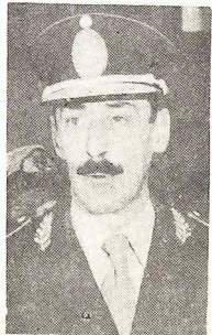
Prezydent VIDELA spotkał się ostatnio z prezydentem Pinochet, by na drodze polubowej szukać rozwiązania zatargu odnośnie własności trzech wysp położonych u wejścia do Kanału Beagle.

By rozstrzygnąć polubowym ten trudny problem, Argentyna i Chile ustanowiły