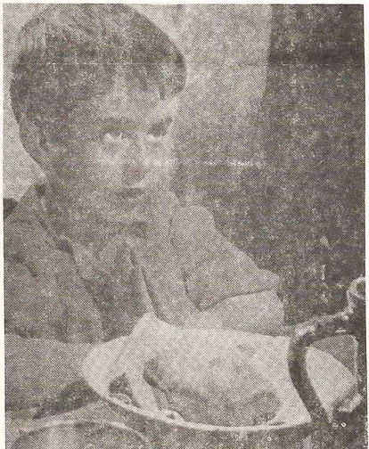
"Marcelino, Pão e Vinho", (colorido) está sendo projetado simultaneamente em mais de 100 cinemas brasileiros. São momentos de intensa ternura, bondade e uma lição do mais puro amor. Você não pode perder.

Um dos filmes clássicos do cinema religioso, também consagrado pelo seu conteúdo humano e poético, está sendo relançado simultaneamente nas principais cidades brasileiras: "Marcelino Pão e Vinho", produção espanhola que realizada há 24 anos atrás se tornou um dos maiores fenômenos de bilheteria do cinema. Distribuição da Famafilmes no Brasil, amparado por milionário esquema publicitário, o relançamento em Curitiba foi feito no dia 6, quinta-feira passada no cine Opera, com censura livre.