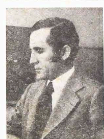
Prezydent Portugalii Ramalho Eanes usłyszał opinie Brazylii. Celem tej wizyty jest zwiększenie wymiany handlowej między obu krajami. Eanes odbędzie rozmowę m. in. z gen. Figueiredo.