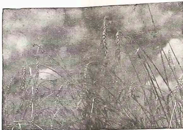
5 — As chuvas havidas regularizam o abastecimento de água e aliviam a situação do suprimento de energia elétrica.

4 — Segundo informação do governo do Paraná, as chuvas caídas permitem, ainda, o plantio do trigo naquele Estado.