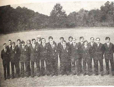
Seleção da Polônia

No dia 1.º de junho os olhos do Mundo estarão voltados para a capital argentina. Não é exagero afirmar-se isto, altamente o interesse pelo futebol, no mundo inteiro, tem sido cada vez maior. E principalmente em se tratando de certame máximo do mais popular dos esportes, do qual participariam as dezessete equipes mais poderosas de vários Continentes.