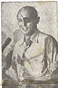
Gen. Moshe Dayan, bohater z wojny 1948 roku, który wspólnie z emigracją Ben Gurionem i Golda Meir stał się filarem utworzenia niepodległego państwa Izraela.

Od tego czasu datuje się ruch niepodległościowy Palestynczyków, który z czasem przybrał formy ostrego terroru. Jeszcze dwa zwycięstwa nad Egiptem i Syrią w 1967 r. 1973 roku, powiększając swe granice i przeobrażając je w państwo silne i doskonale uzbrojone. Istnienie zaś państwa izraelskiego cieszy się gwarancją daną przez Stany Zjednoczone.