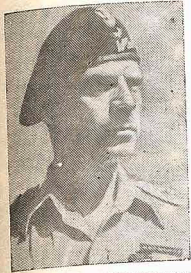
General broni — WLADYSŁAW ANDERS dowodzący zwycięską ofensywą w bitwie o Monte Cassino zmarł w Londynie w dniu 12 maja 1970 roku. Został on pochowany w bazylice św. Piotra w Watykanie.